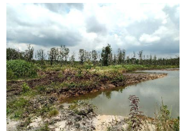
หน้าเหมืองปัจจุบัน