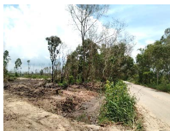
แนวเวนไม่ทำเหมืองระยะ 10 เมตร