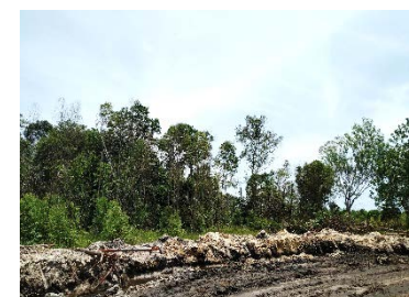
แนวเวนไม่ทำเหมืองระยะ 50 เมตร