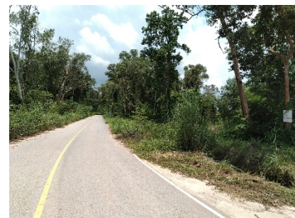
เส้นทางเข้าสู่พื้นที่โครงการ