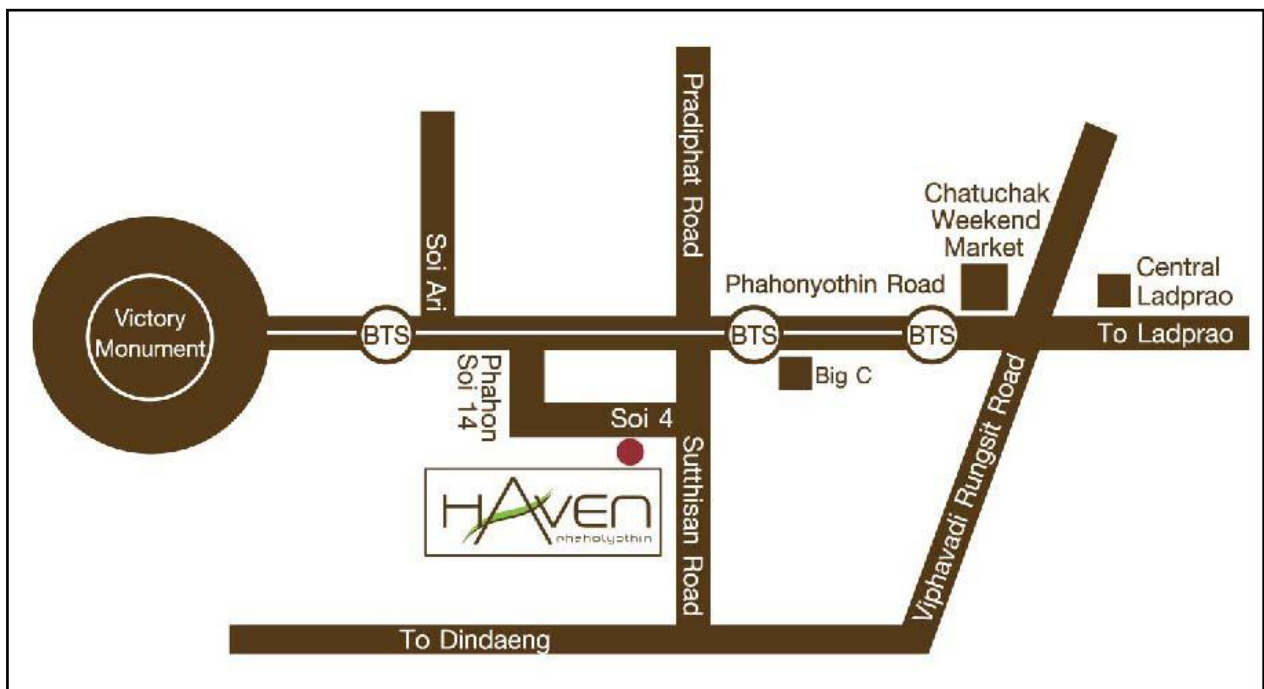
ภาพที่ 1.3-1 แสดงตำแหน่งที่ตั้งโครงการ และเส้นทางคมนาคม

การเดินทางเข้าสู่พื้นที่โครงการสามารถเดินทางได้หลายเส้นทางแต่จะใช้ถนนพหลโยธินเป็นเส้นทางหลัก โดยเริ่มต้นจากอนุสาวรีย์ชัยสมรภูมิ มุ่งสู่ลาดพร้าวเป็นระยะทางประมาณ 3.2 กิโลเมตร เลี้ยวขวาเข้าสู่ถนนสุทธิสารวินิจฉัย ตรงไปเป็นระยะทางประมาณ 650 เมตร แล้วเลี้ยวขวาเข้าซอยอินทามระ 4 ตรงไปเป็นระยะทางประมาณ 60 เมตร เลี้ยวขวาเข้าซอยตรงไปประมาณ 81 เมตร จะเจอพื้นที่โครงการอยู่ทางขวามือ