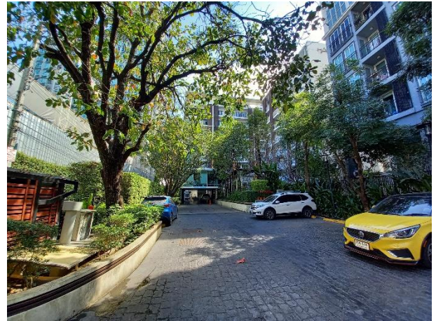
พื้นที่สีเขียวกลางโครงการ