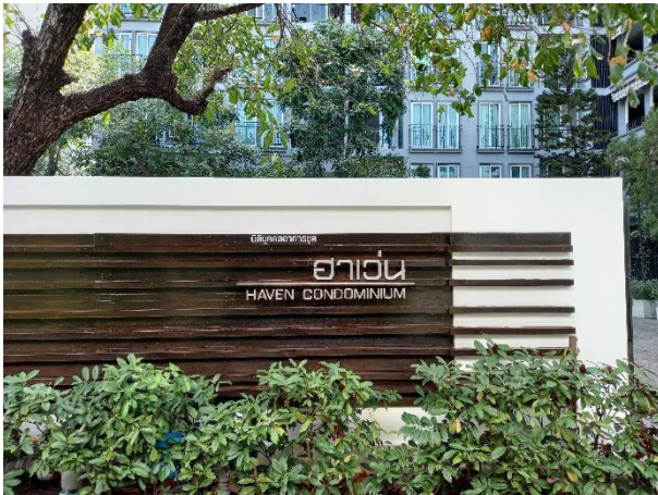
ป้ายชื่อหน้าโครงการ