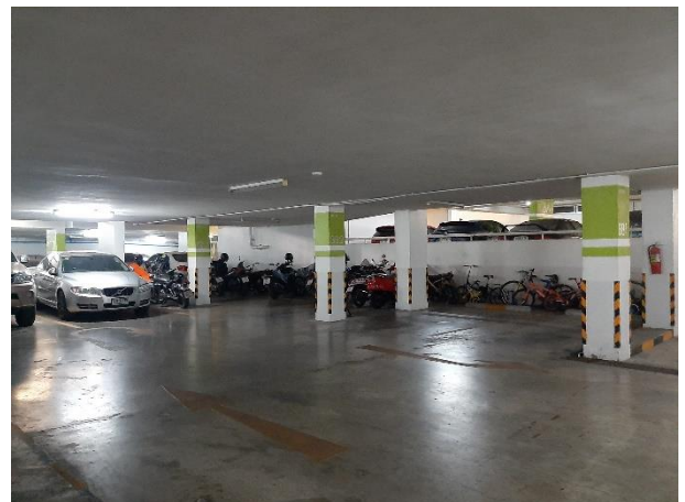
การจราจรในโครงการ