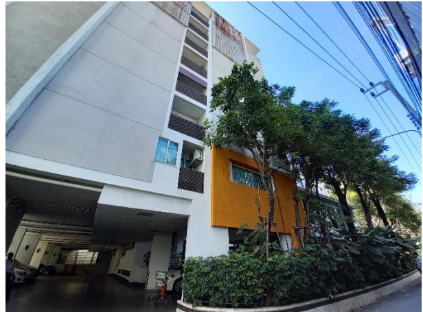
ทางเข้า-ออกหน้าโครงการ