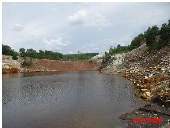
รูปที่ 1 ลักษณะหน้าเหมืองปัจจุบัน