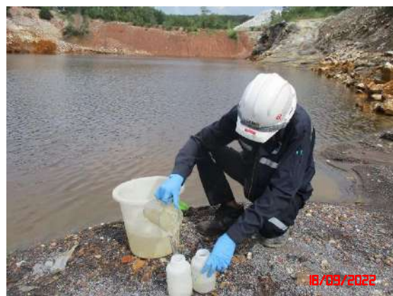
บ่อกักเก็บน้ำ