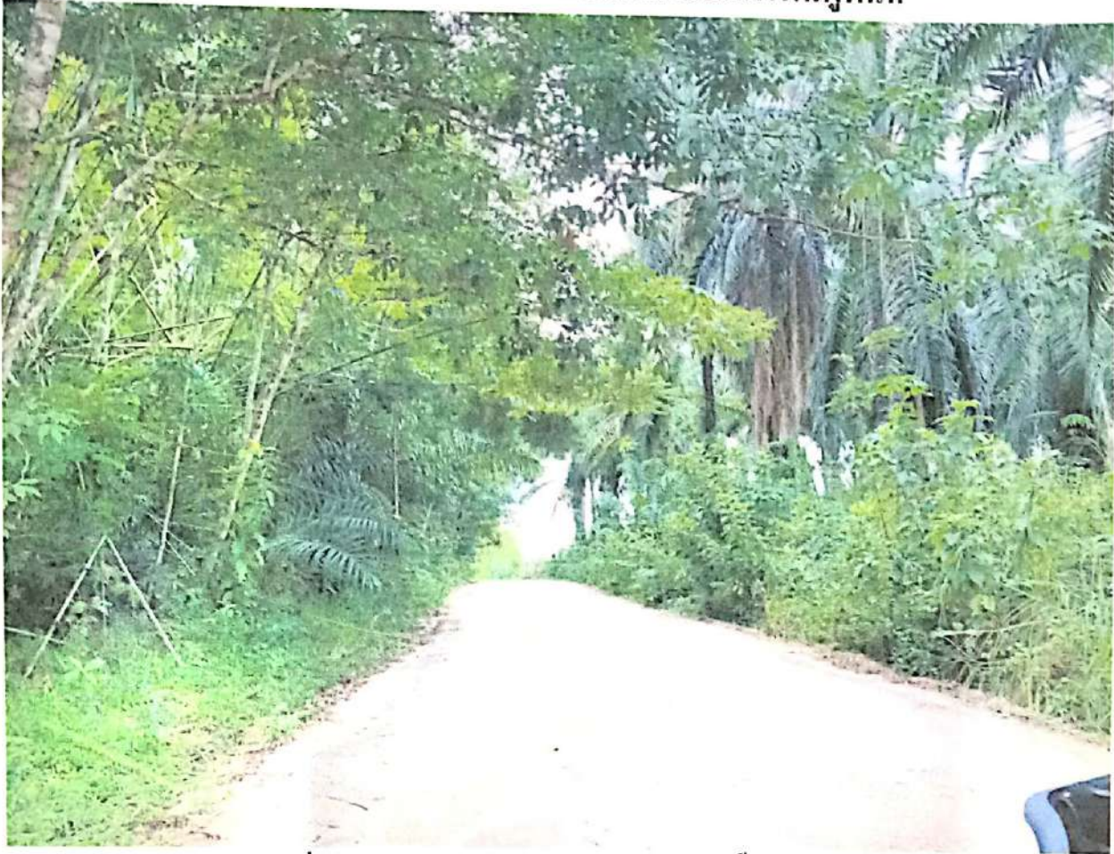
ภาพที่ 1 สภาพเส้นทางและต้นไม้ริมทางในเขตพื้นที่โครงการ