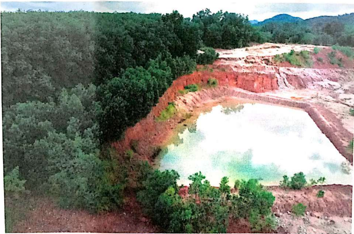
ภาพที่ 2 แนวต้นไม้และคันดินบ่อดักตะกอนด้านทิศใต้