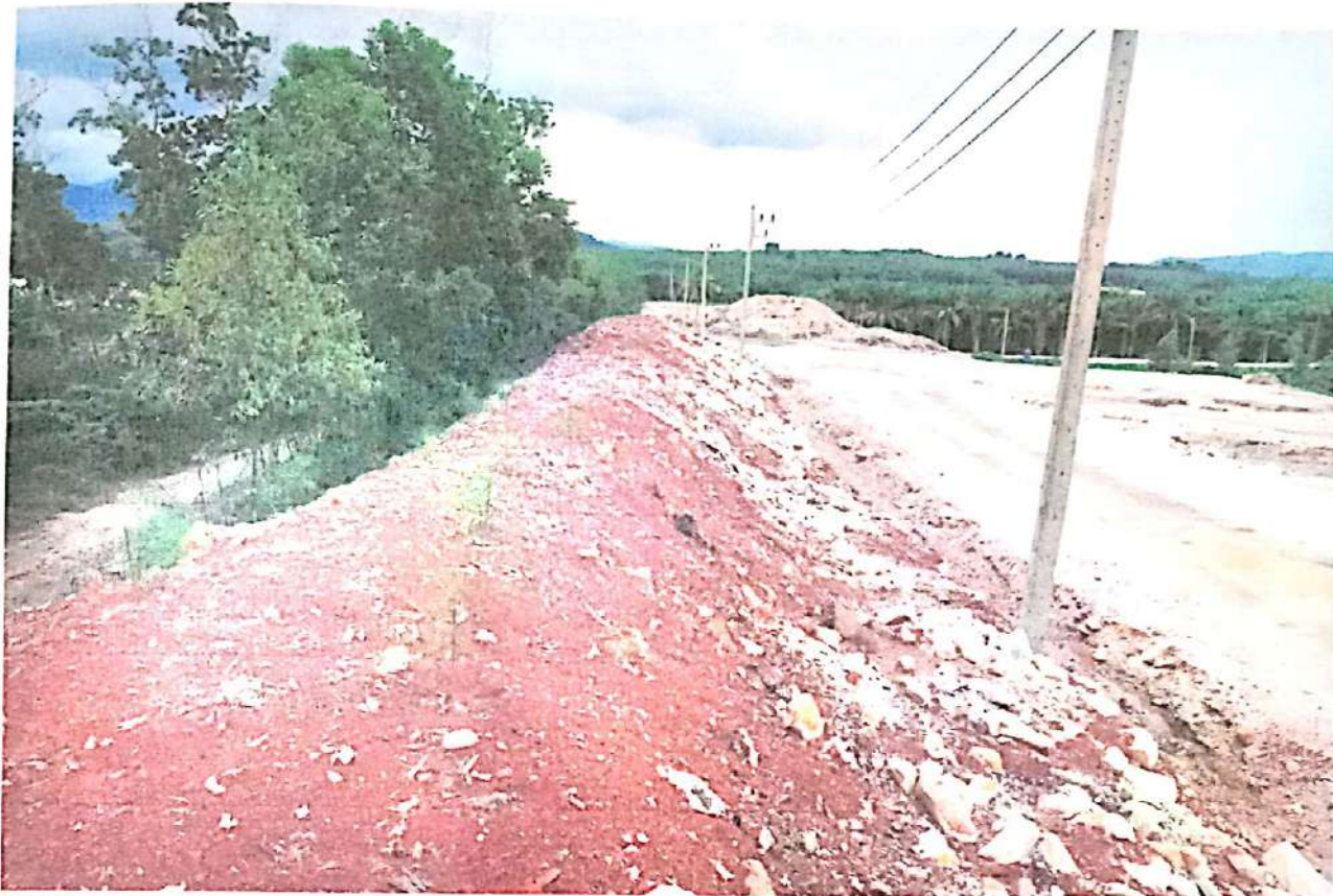
ภาพที่ 9 การปลูกต้นไม้เป็นแนวในพื้นที่โครงการ