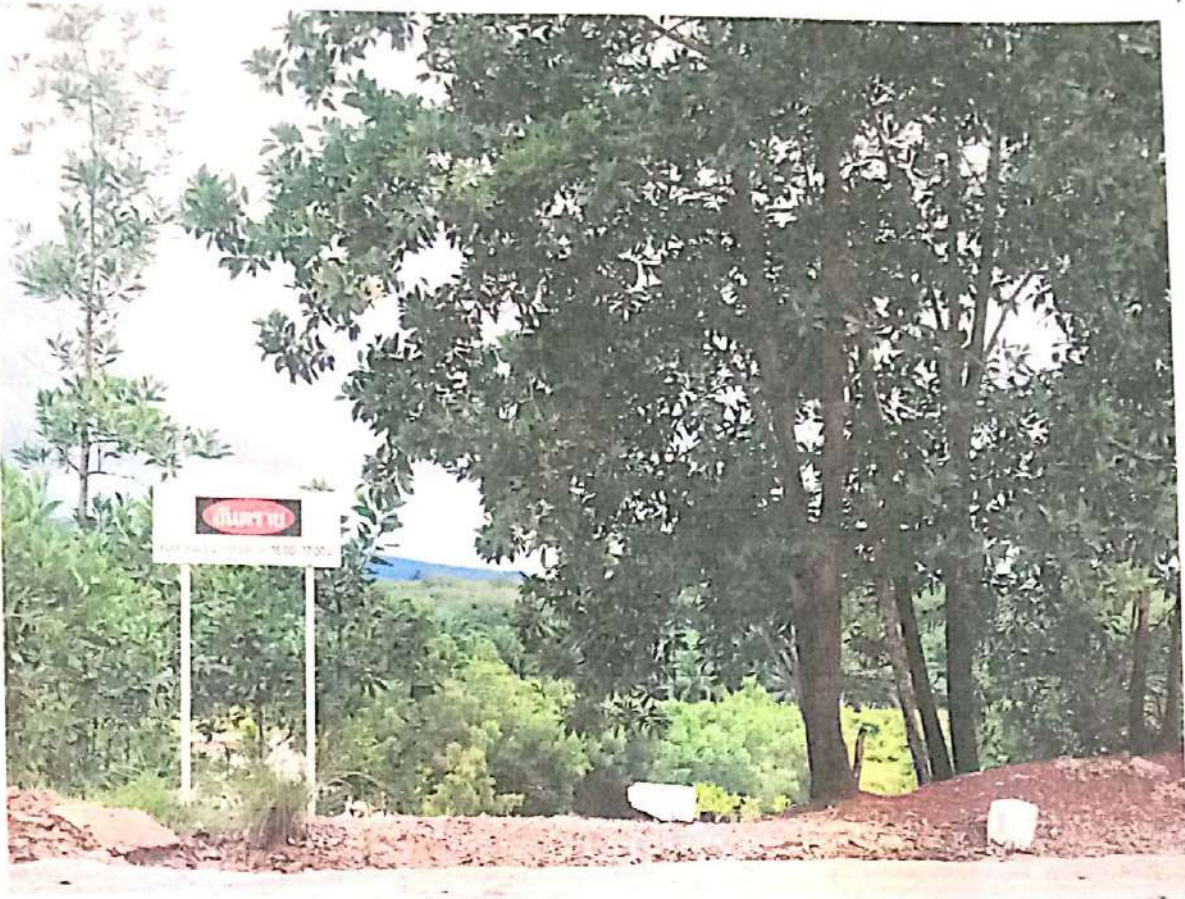
ภาพที่ 3 สภาพต้นไม้รอบๆ สำนักงาน และ โรงซ่อมเครื่องจักร