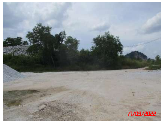
บริเวณภายในพื้นที่โครงการ