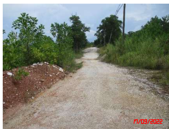
บริเวณเส้นทางสาธารณะ