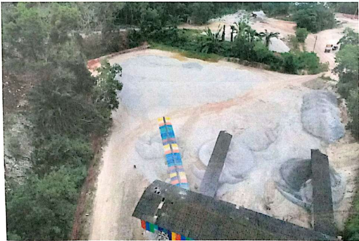
ภาพที่ 6 ลานกองแร่ในพื้นที่โรงแต่งแร่