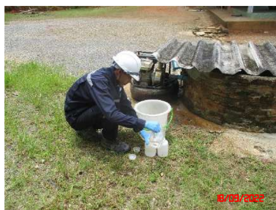
บ่อน้ำต้นบ้านคลองลำพลา