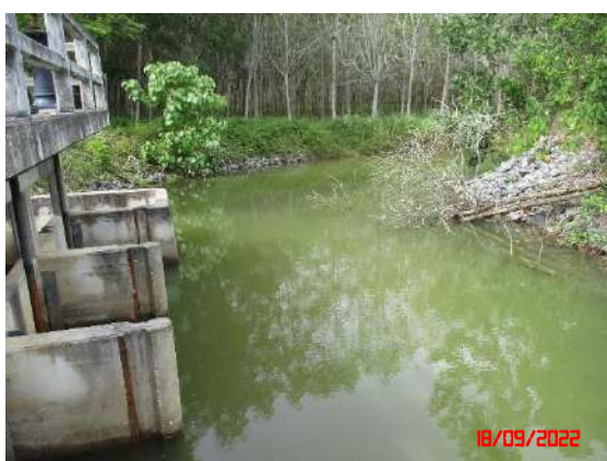
รูปที่ 16 การเก็บตัวอย่างน้ำ เมื่อวันที่ 18 กันยายน 2565

ชุมชนที่อยู่ตามเส้นทางขนส่งแร่ (บ้านเขาโคก)