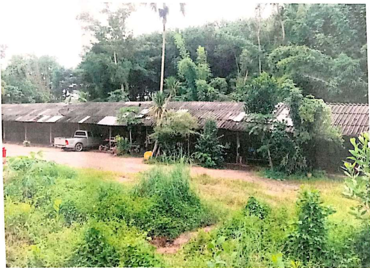
ภาพที่ 4 สภาพต้นไม้ที่โคแล้ว รอบๆ บ้านพัก