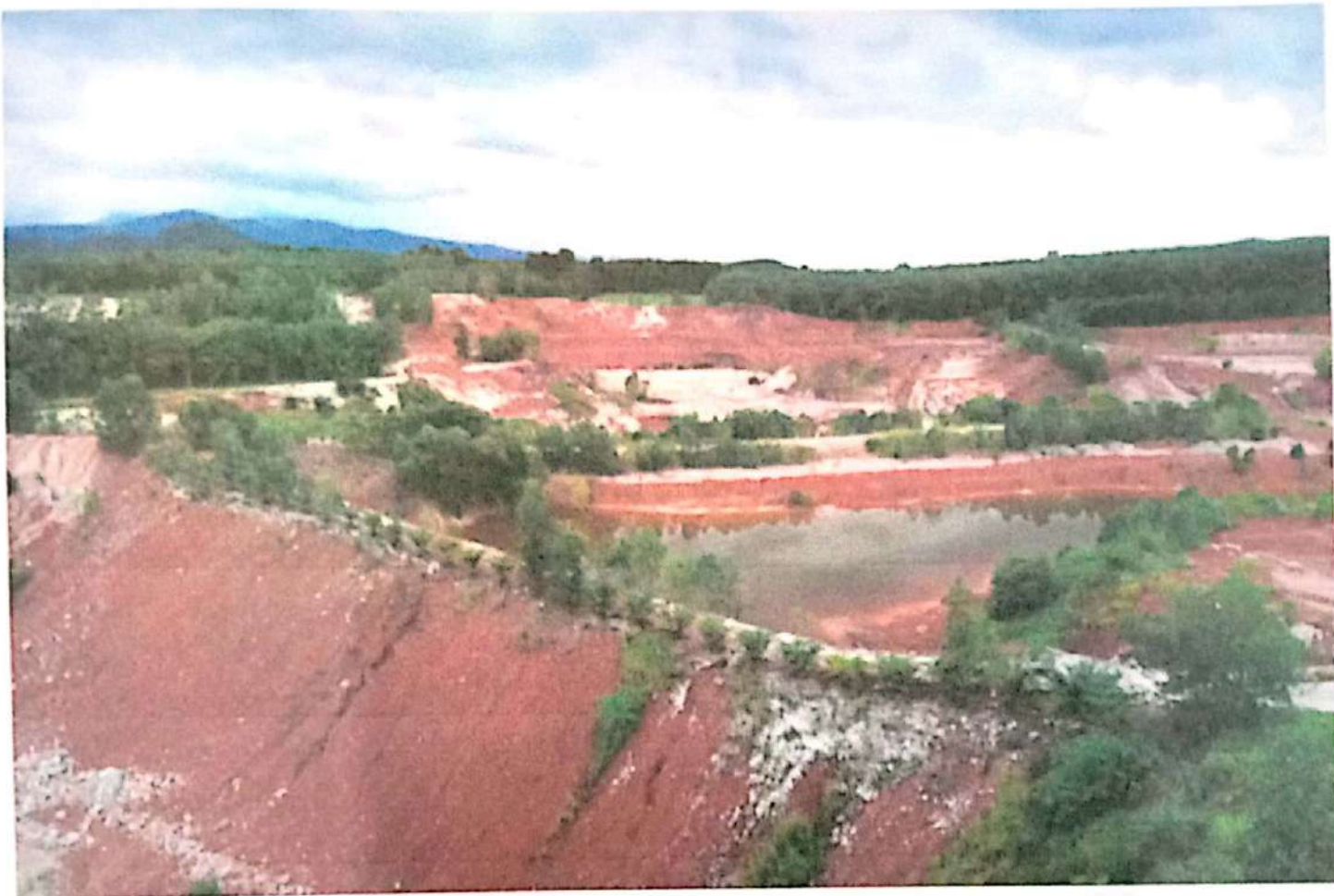
ภาพที่ 11 ดินไม้บริเวณทิศใต้ของโครงการ