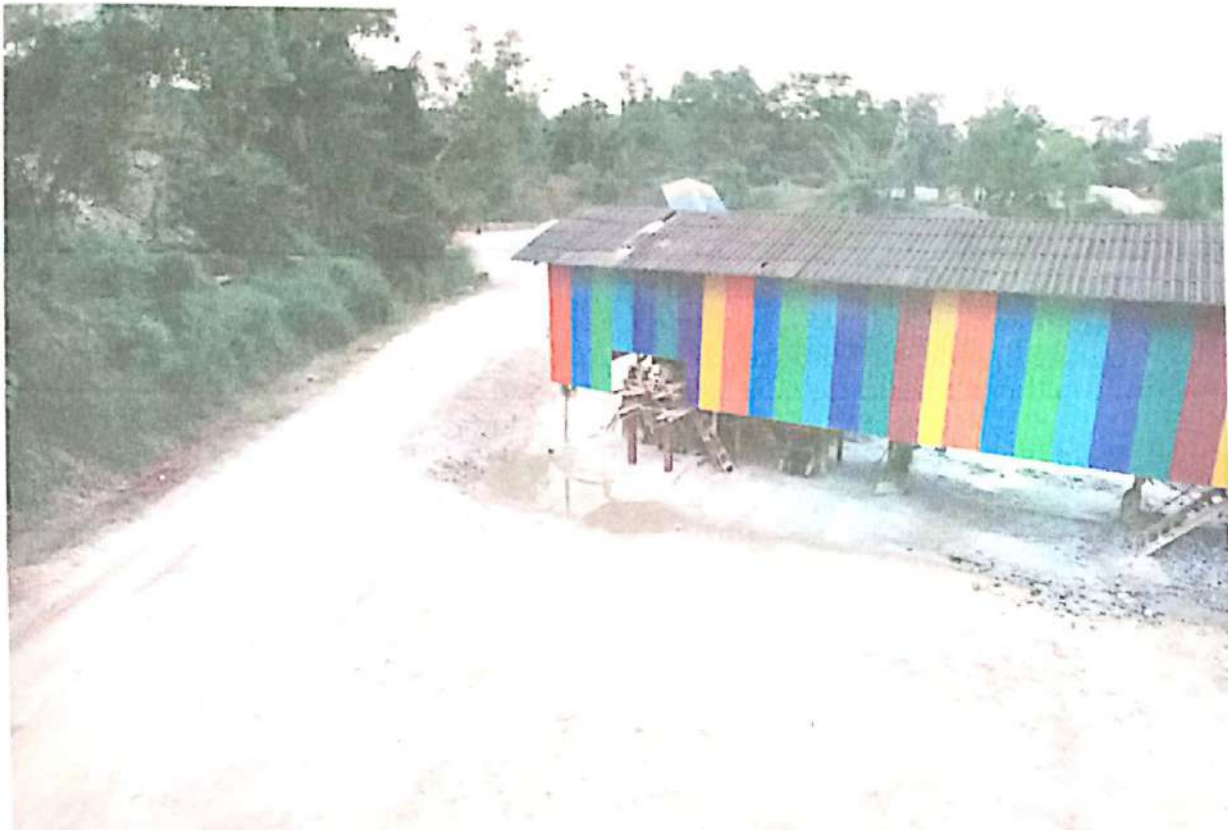
ภาพที่ 5 พื้นที่โรงแต่งแร่ ที่บริเวณโดยรอบผ่านการปลูกต้นไม้ซึ่งปัจจุบันเกือบเต็มพื้นที่แล้วและการติด metal sheet เป็นแนวป้องกันฝุ่นออกนอกบริเวณ