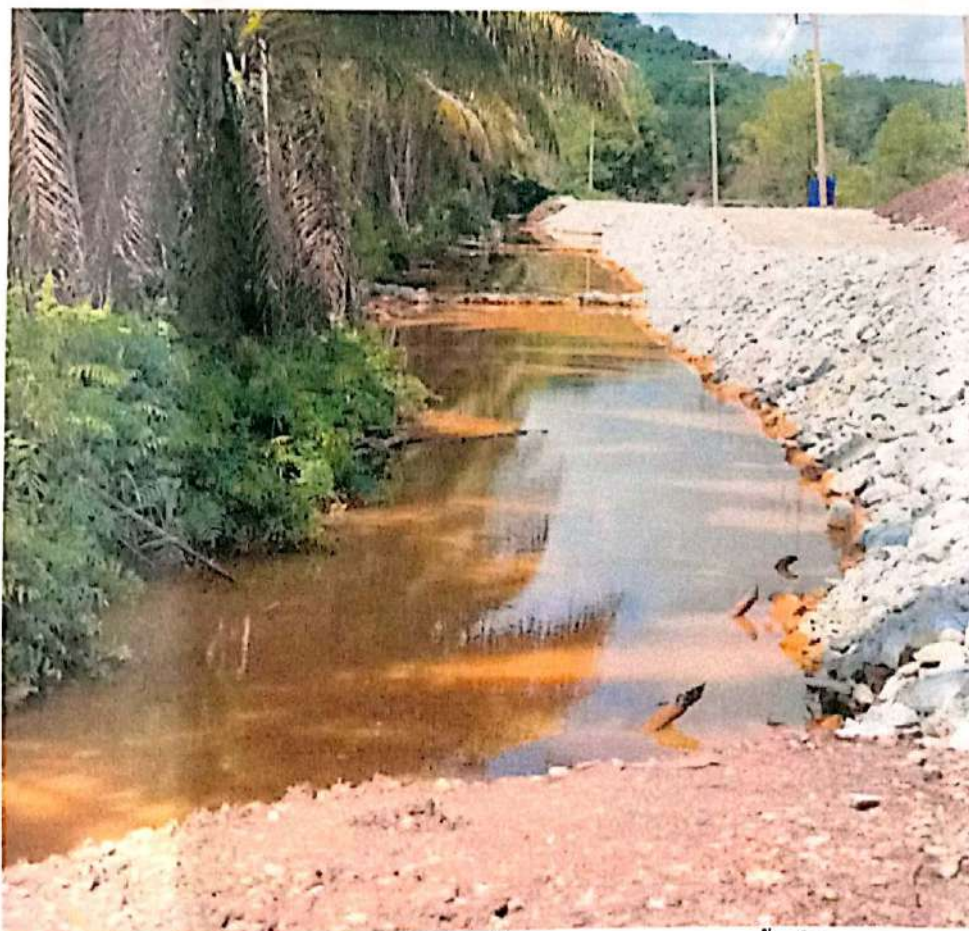
ภาพที่ 8 สภาพทำนบและทางระบายน้ำ ก่อนปล่อยออกนอกพื้นที่โครงการ