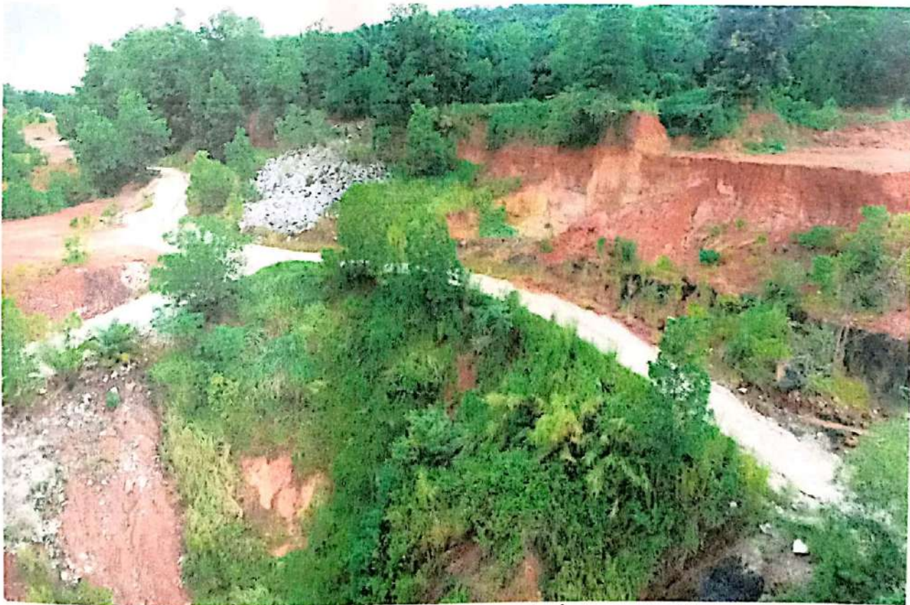
ภาพที่ 10 ภาพเส้นทางและต้นไม้คลุมดินที่เจริญเติบโตแล้ว