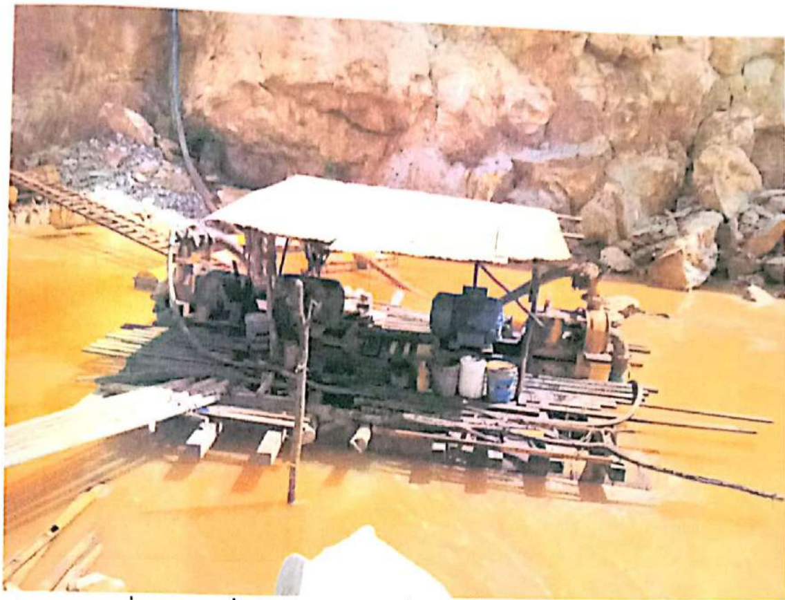
ภาพที่ 7 แพวางเครื่องกวนปูนขาวและเครื่องสูบน้ำ เพื่อลดความเป็นกรดของน้ำ ก่อนปล่อยออกนอกพื้นที่โครงการ