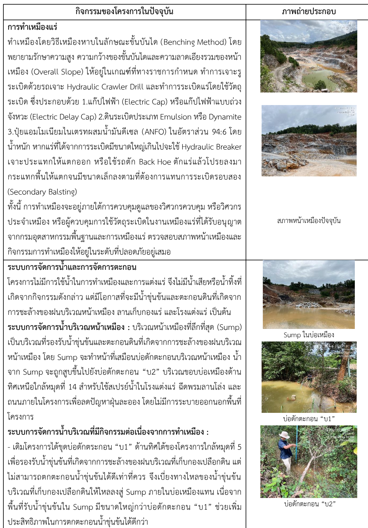
ตารางที่ 1-1 แสดงรายละเอียดของการดำเนินกิจกรรมของโครงการในปัจจุบัน