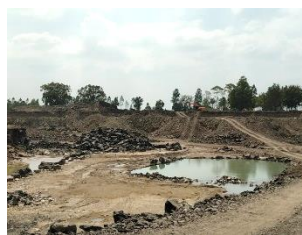
หน้าเหมืองปัจจุบัน

พื้นที่โครงการประทานบัตรที่ 33638/16367 ของทกจ. โรงงานไม่บดหินยังตั้ง