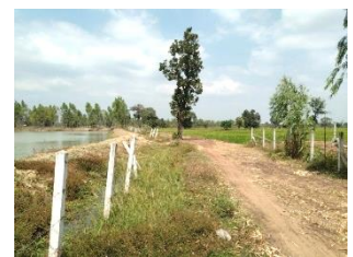
แนวเวนการท่าเหมือง