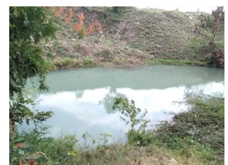
บ่อดักตะกอน บ1