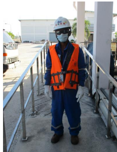
รูปที่ 3-11 พนักงานสวมใส่อุปกรณ์คุ้มครองความปลอดภัยส่วนบุคคล