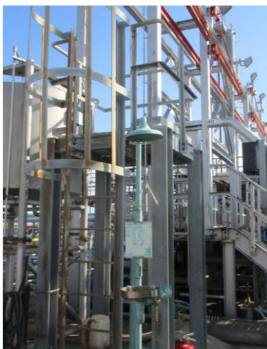
Emergency Shower & Eye/Face Washer