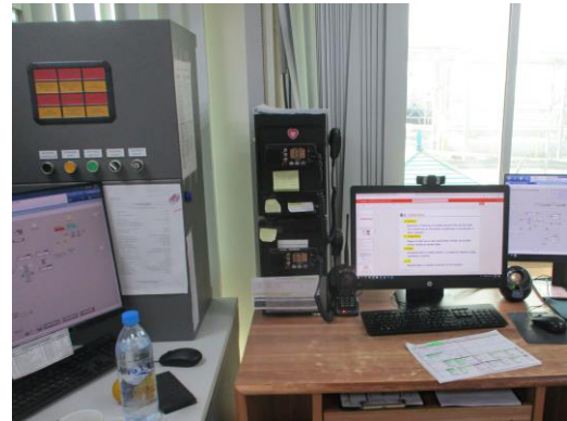
รูปที่ 3-8 ระบบโทรคมนาคม