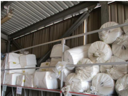
Oil Sorbent Pads