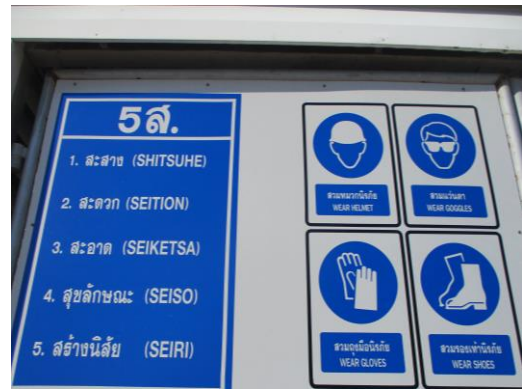
รูปที่ 3-10 ป้ายเตือนให้พนักงานสวมใส่อุปกรณ์คุ้มครองความปลอดภัยส่วนบุคคล