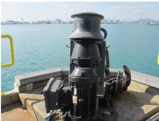
รูปที่ 3-9 อุปกรณ์ยึดเรือ