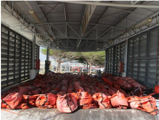
Rapid deploy boom