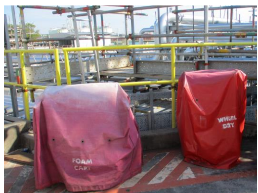
Form Cart and Wheel Dry