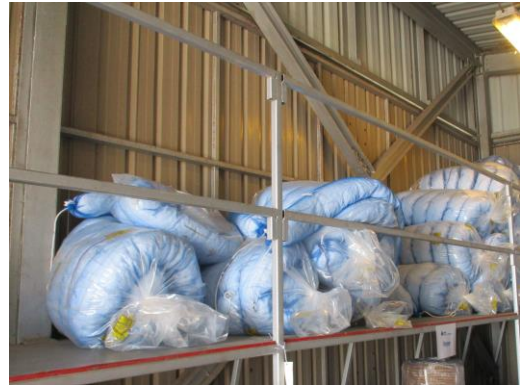
Oil Sorbent Booms