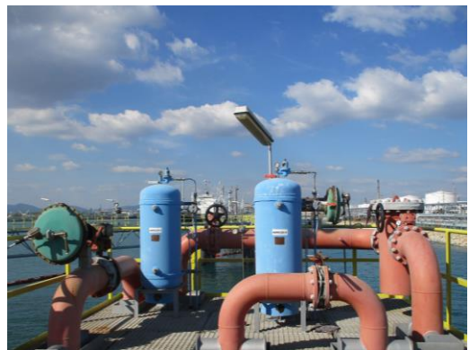
Fire Water Accumulator