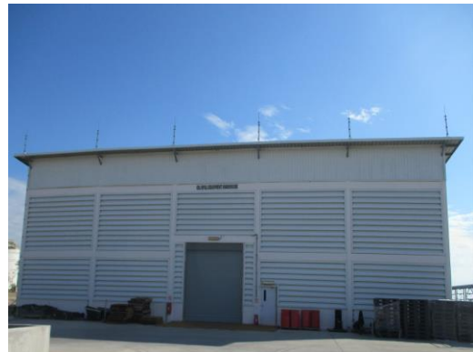
Oil Spill Equipment Warehouse