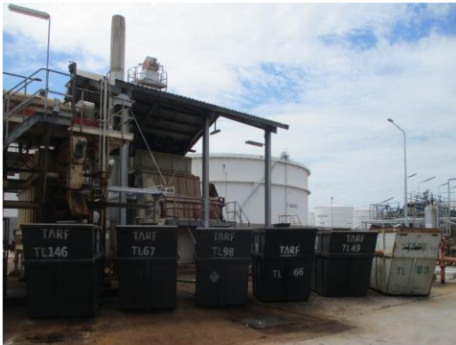
รูปที่ 3-7 ภาพขณะจัดเก็บกากตะกอนปนเปื้อนน้ำมัน