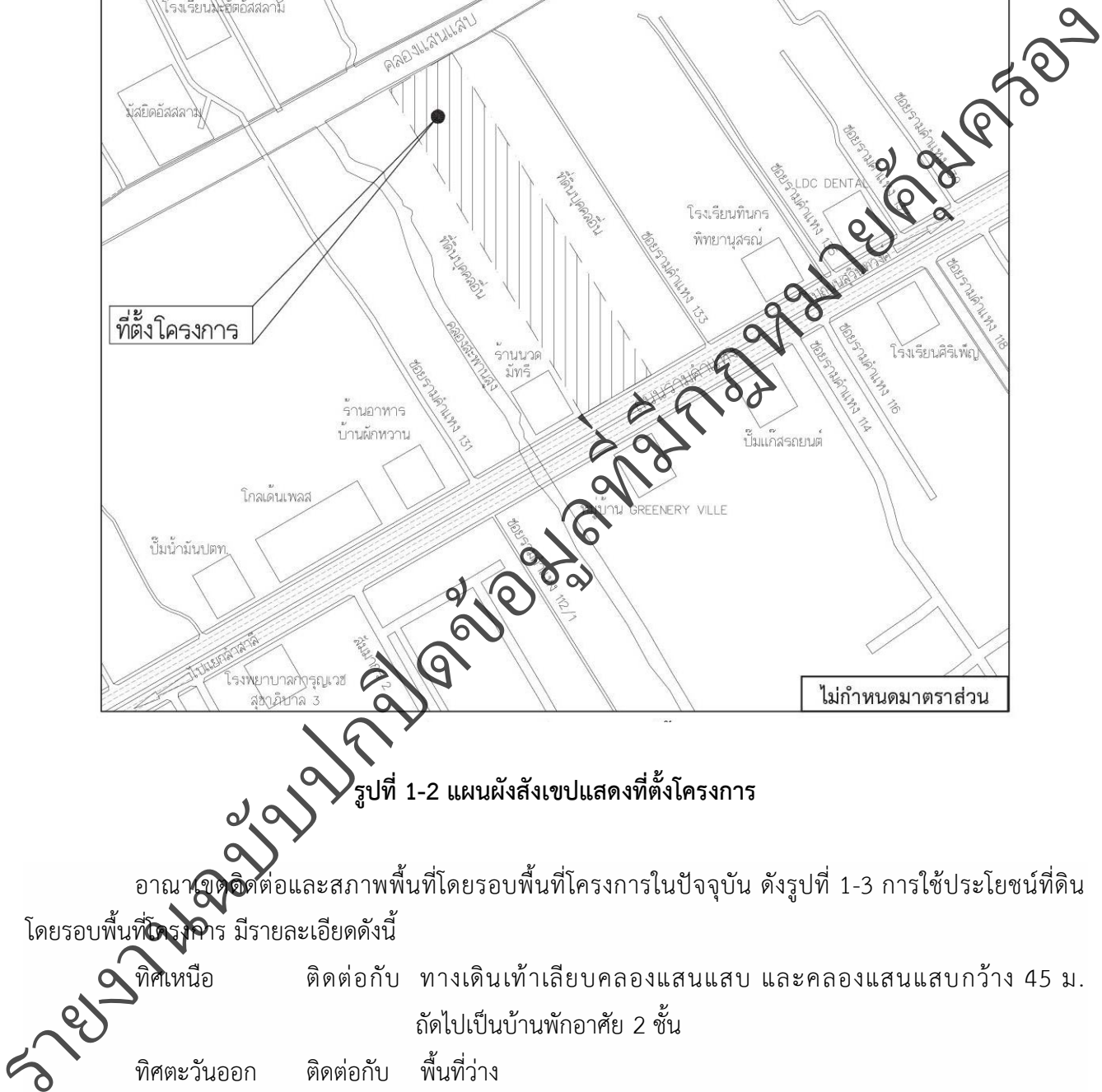
รูปที่ 1-2 แผนผังสังเขปแสดงที่ตั้งโครงการ

อาณาเขตติดต่อและสภาพพื้นที่โดยรอบพื้นที่โครงการในปัจจุบัน ดังรูปที่ 1-3 การใช้ประโยชน์ที่ดินโดยรอบพื้นที่โครงการ มีรายละเอียดดังนี้