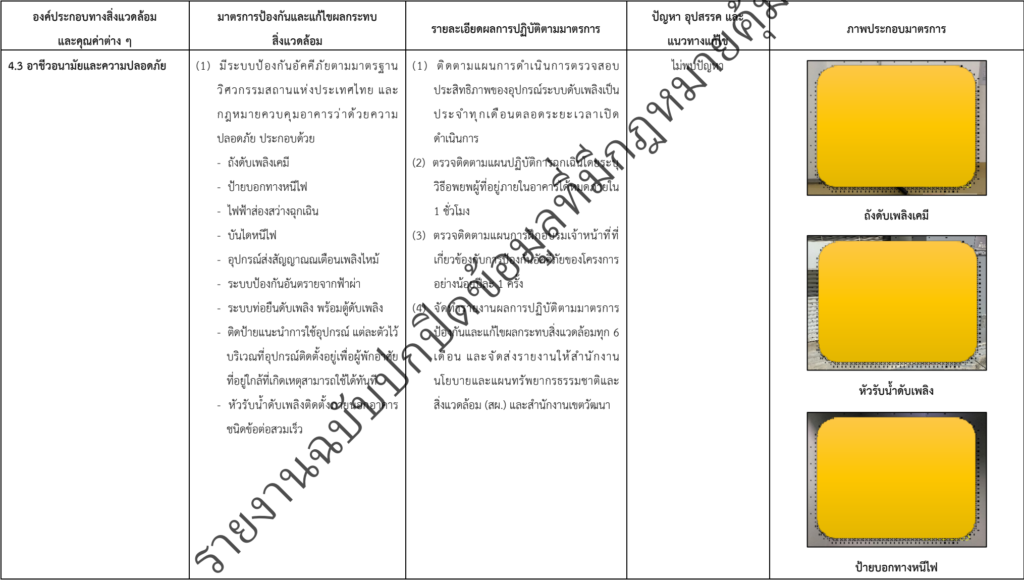
ตารางที่ 2-1 สรุปผลกระทบสิ่งแวดล้อม มาตรการป้องกันและแก้ไขผลกระทบสิ่งแวดล้อมและมาตรการติดตามตรวจสอบผลกระทบสิ่งแวดล้อม (ระยะดำเนินการ) โครงการโรงแรมจัสมิน ฟิฟตี้ไนน์ (โรงแรม จัสมิน ทองหล่อ เรสซิเดนส์) (ต่อ)