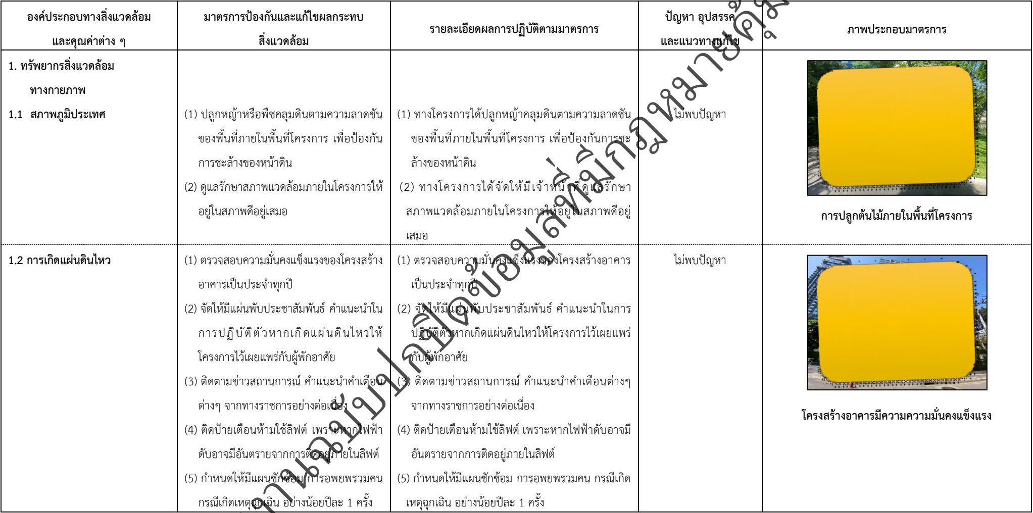
ตารางที่ 2-1 สรุปผลกระทบสิ่งแวดล้อม มาตรการป้องกันและแก้ไขผลกระทบสิ่งแวดล้อมและมาตรการติดตามตรวจสอบผลกระทบสิ่งแวดล้อม (ระยะดำเนินการ) โครงการโรงแรมจัสมิน ฟิฟตีไนน์ (โรงแรม จัสมิน ทองหล่อ เรสซิเดนส์)