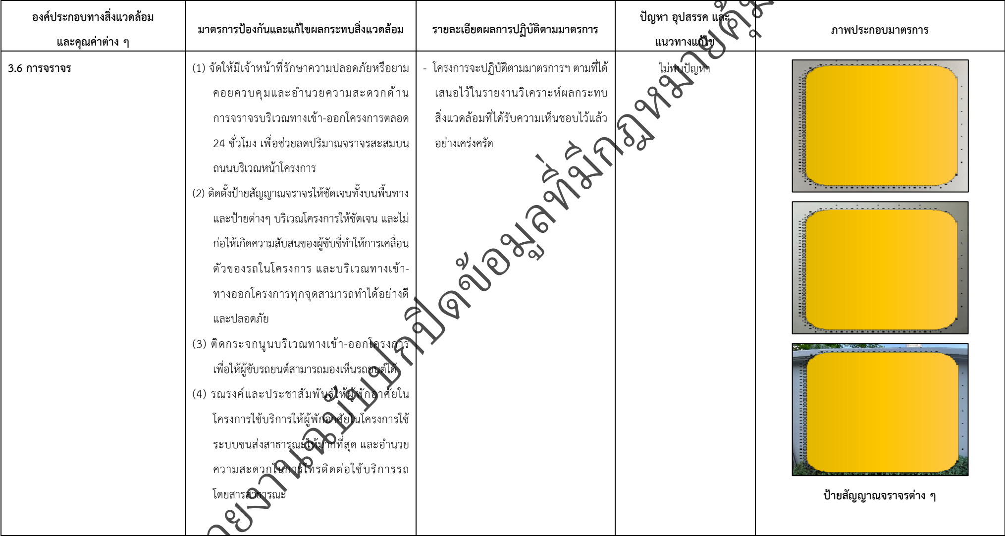
ตารางที่ 2-1 สรุปผลกระทบสิ่งแวดล้อม มาตรการป้องกันและแก้ไขผลกระทบสิ่งแวดล้อมและมาตรการติดตามตรวจสอบผลกระทบสิ่งแวดล้อม (ระยะดำเนินการ) โครงการโรงแรมจัสมิน ฟิฟตี้ไนน์ (โรงแรม จัสมิน ทองหล่อ เรสซิเดนส์) (ต่อ)