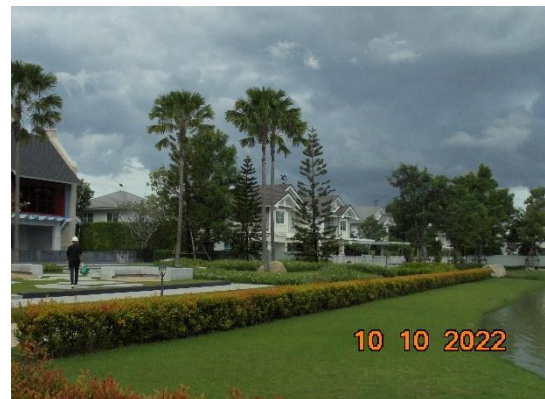
รูปที่ 2-14 การดูแลรักษาความสะอาดสิ่งแวดล้อมภายในโครงการเป็นประจำและสม่ำเสมอ