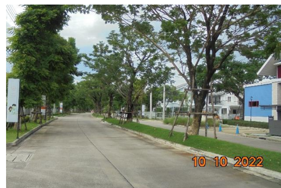
รูปที่ 2-9 ลักษณะถนนภายในโครงการ