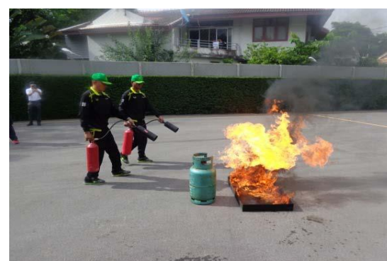
รูปที่ 2-11 การฝึกอบรมพนักงานรักษาความปลอดภัยในเรื่องป้องกันและบรรเทาอัคคีภัยเบื้องต้น