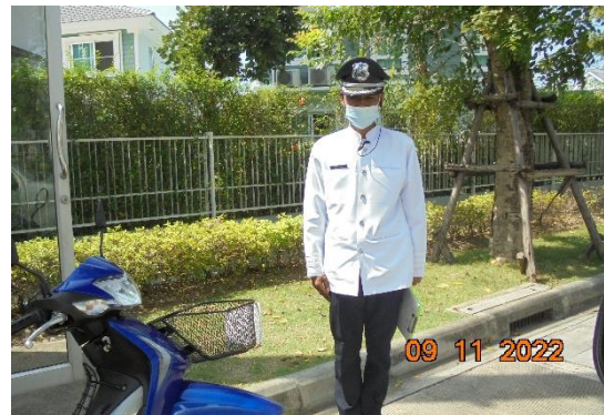
รูปที่ 2-13 การรักษาความปลอดภัยในพื้นที่โครงการตลอด 24 ชั่วโมง