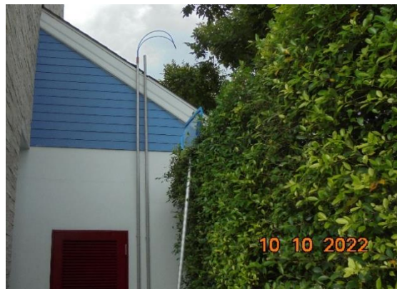
รูปที่ 2-22 ระบบความปลอดภัยของสระว่ายน้ำ