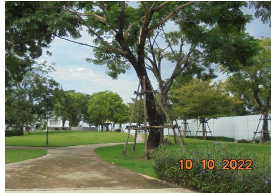
รูปที่ 2-3 รั้วรอบพื้นที่โครงการที่มีส่วนกันขโมย ความสูง 2.8 เมตร