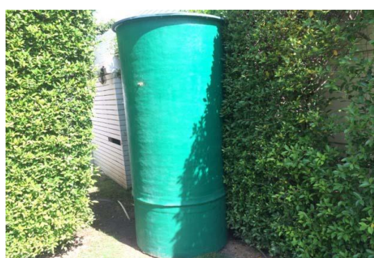
รูปที่ 2-4 ระบบบำบัดน้ำเสียขั้นต้นประจำบ้าน (บน) และระบบบำบัดน้ำเสียรวมส่วนกลาง พื้นที่ที่ 1 และถังดักละออง (ล่าง)