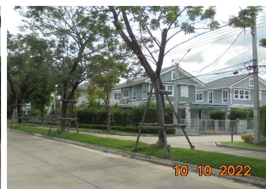
รูปที่ 2-12 การออกแบบก่อสร้างที่เป็นไปตามมาตรฐานและเลือกใช้วัสดุที่เหมาะสม