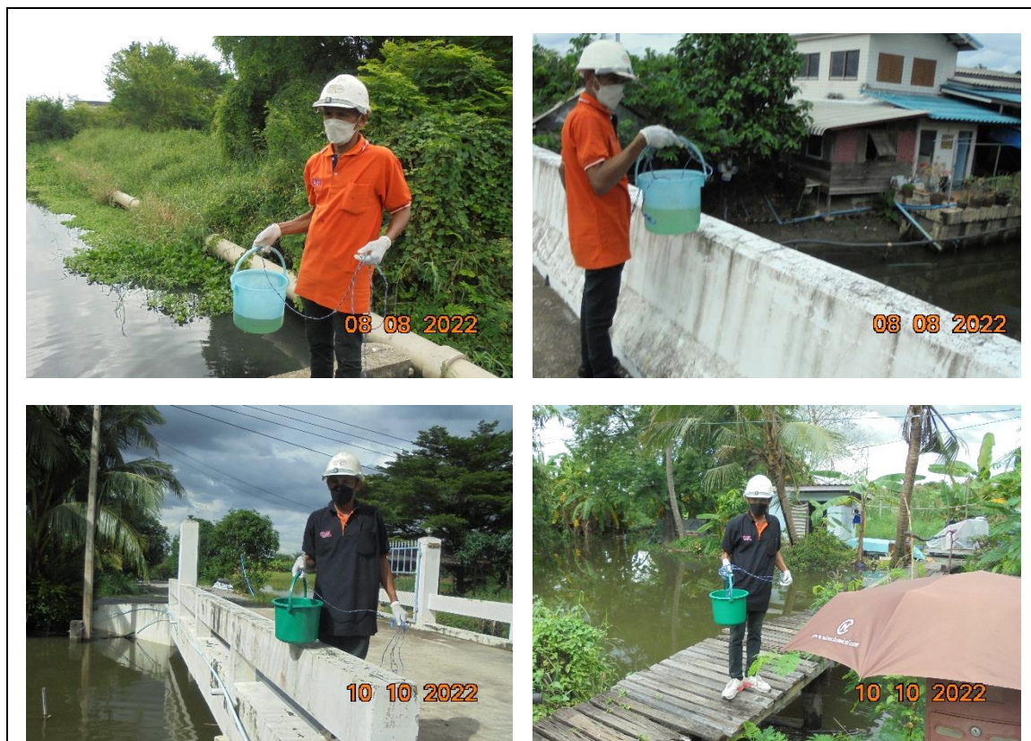
รูปที่ 2-19 เก็บน้ำบริเวณคลองสาธารณะ