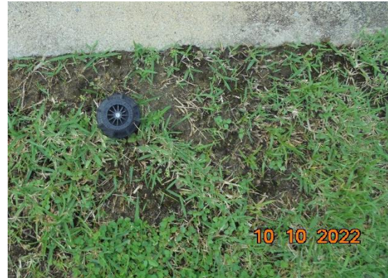
รูปที่ 2-7 ใช้น้ำทิ้งสุดท้ายรดน้ำต้นไม้แบบซึมดิน