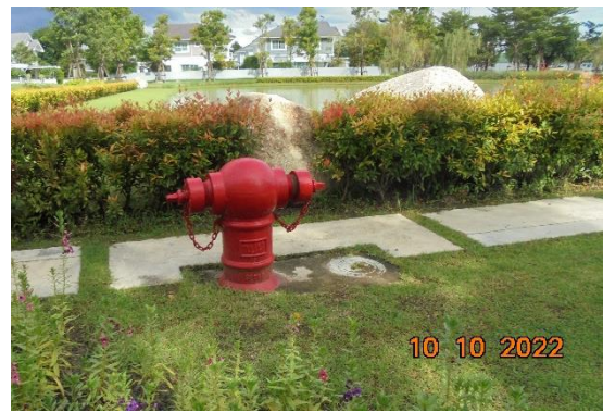
รูปที่ 2-16 หัวดับเพลิง (Fire Hydrant) ที่ได้ติดตั้งในพื้นที่ 1