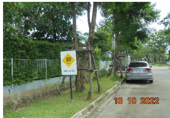
รูปที่ 2-8 ป้ายสัญญาณจราจรประเภทต่างๆ ภายในโครงการ