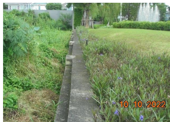
รูปที่ 2-6 การป้องกันการชะล้างพังทลายของดิน โดยจัดทำเป็นกำแพงล้อมโครงการ