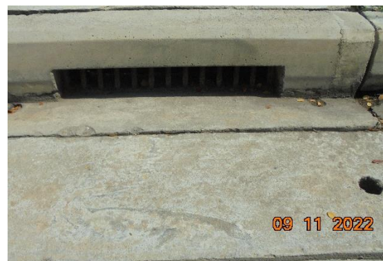
รูปที่ 2-18 ตะแกรงดักขยะ