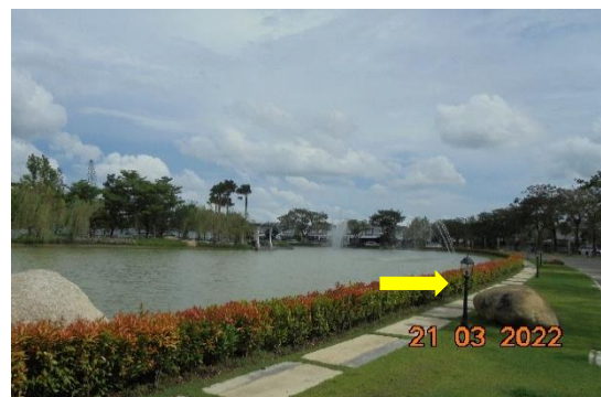
รูปที่ 2-15 ไฟส่องสว่างตามแนวถนนและพื้นที่ส่วนกลาง