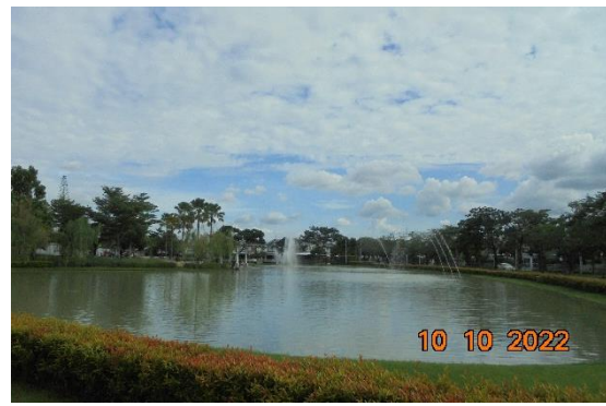
รูปที่ 2-17 บ่อหนองน้ำ