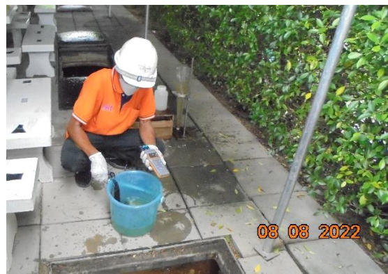
รูปที่ 2-21 ตรวจสอบน้ำในระบบบำบัดน้ำเสียรวม