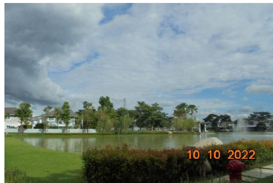
รูปที่ 2-5 พื้นที่สวนหย่อม เกาะกลางถนนโครงการ และการปลูกหญ้าคลุมดิน