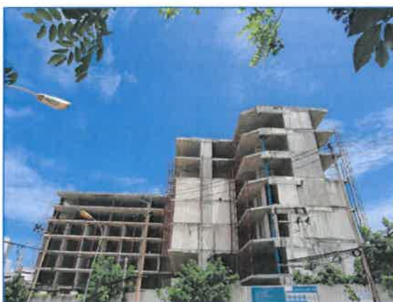
ภาพถ่ายที่ 1.1-1 สภาพพื้นที่โครงการปัจจุบัน วันที่ 18 พฤษภาคม 2565