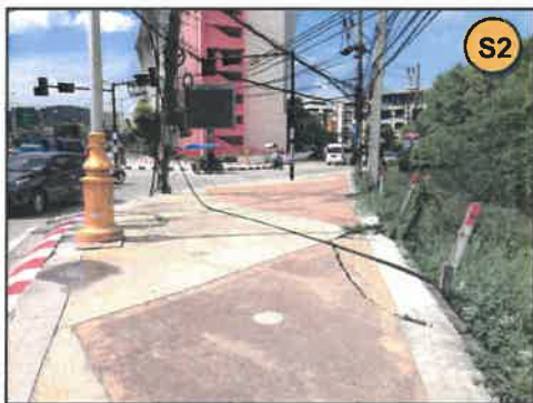
ทิศใต้ : ที่ดินบุคคลอื่น