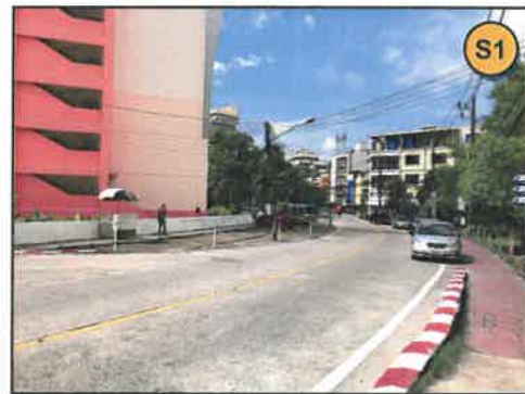
ทิศใต้ : ถนนราชปาทานุสรณ์