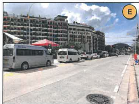
ทิศตะวันออก : ถนนพระเมตตา