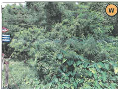
ทิศตะวันตก : ที่ดินบุคคลอื่น (ต้นไม้และวัชพืชปกคลุม)