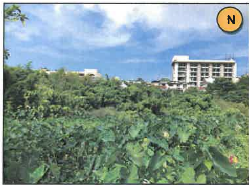
ทิศเหนือ : ที่ดินบุคคลอื่น (ต้นไม้และวัชพืชปกคลุม)