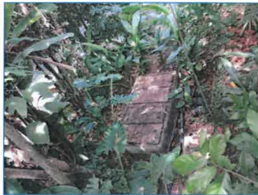
ภาพถ่ายที่ 2.2-10 บ่อหน่วงน้ำและบ่อพักน้ำทั้งก่อนระบายออกสู่ทางระบายน้ำสาธารณะ