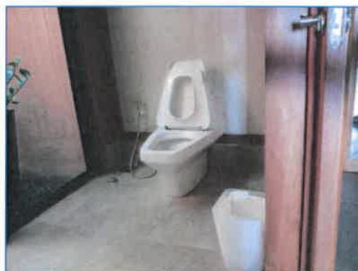
ภาพถ่ายที่ 2.2-27 ถึงขยะมูลฝอยในพื้นที่ต่าง ๆ ของโรงแรม