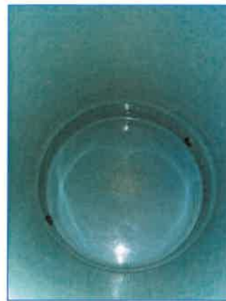
ภาพถ่ายที่ 2.2-25 การล้างทำความสะอาดถังน้ำใช้