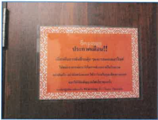
ภาพถ่ายที่ 2.2-3 ป้ายเตือนการขับขีรถภายในโรงแรม