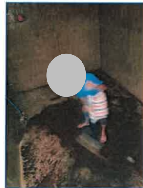
ภาพถ่ายที่ 2.2-9 การล้างทำความสะอาดถึงน้ำใช้