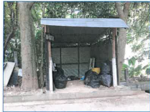
จุดรวบรวมขยะอันตราย