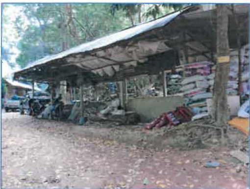
จุดทำปุ๋ยหมักชีวภาพ