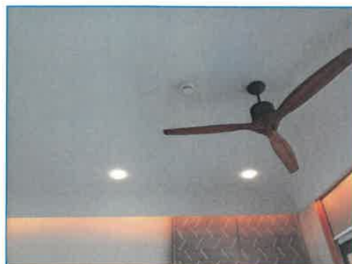
ภาพถ่ายที่ 2.2-16 อุปกรณ์ไฟฟ้าส่องสว่างแบบประหยัดพลังงาน