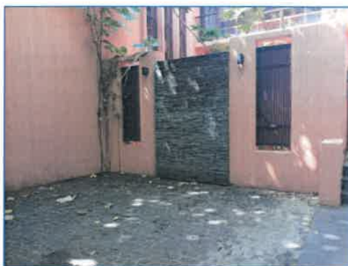
ภาพถ่ายที่ 2.2-32 จุดรวมพลของโรงแรมบริเวณด้านหน้า