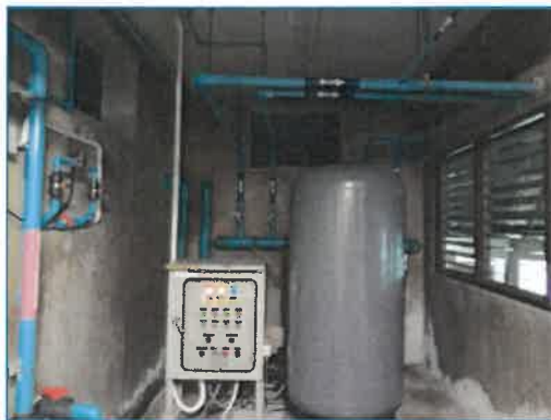
ภาพถ่ายที่ 2.2-24 ถังเก็บน้ำบาดิน