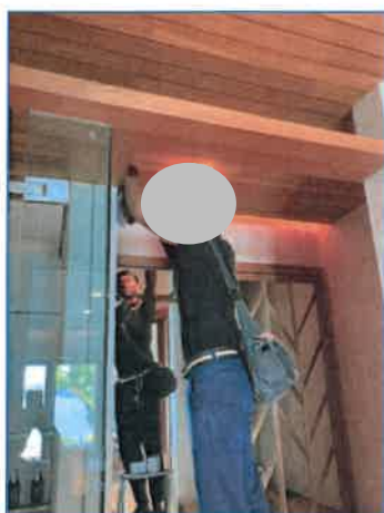
ภาพถ่ายที่ 2.2-18 การทำความสะอาดหลอดไฟส่องสว่างของเจ้าหน้าที่