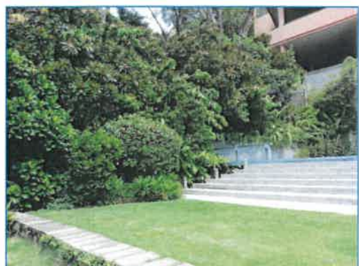
ภาพถ่ายที่ 2.2-2 พื้นที่สีเขียวของโรงแรม