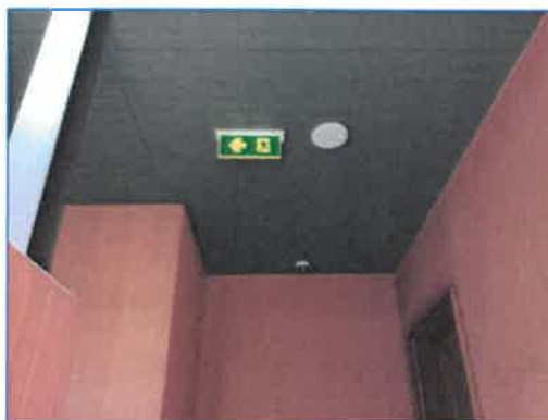
ภาพถ่ายที่ 2.2-22 โทรศัพท์วงจรปิด (CCTV)