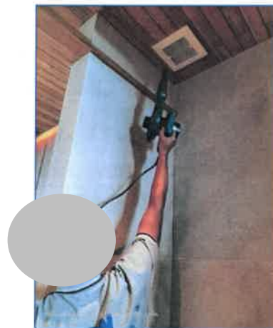
ภาพถ่ายที่ 2.2-21 การทำความสะอาดเครื่องปรับอากาศ