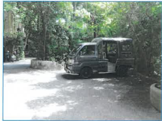
ภาพถ่ายที่ 2.2-6 รถบริการภายในโรงแรม