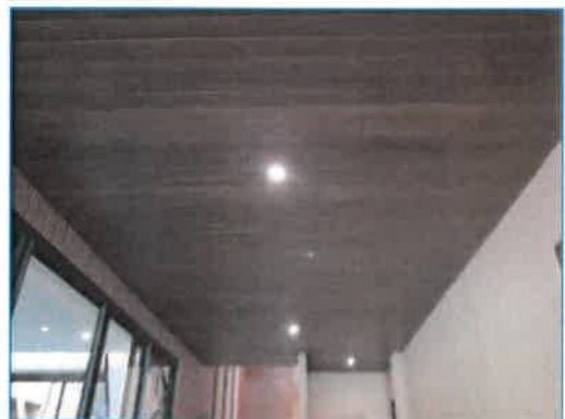
ภาพถ่ายที่ 2.2-30 อุปกรณ์ไฟฟ้าส่องสว่างแบบประหยัดพลังงาน