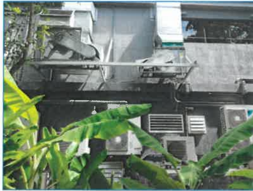
ภาพถ่ายที่ 2.2-12 ระบบไฟฟ้าสำรอง (generator)