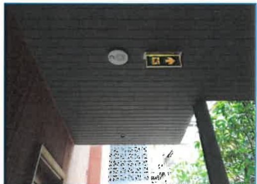
ภาพถ่ายที่ 2.2-20 บ้ายทางหนีไฟของโรงแรม