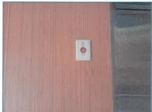
ภาพถ่ายที่ 2.2-19 ระบบแจ้งเตือนอัคคีภัยและป้องกันอัคคีภัยภายในโรงแรม (ต่อ)