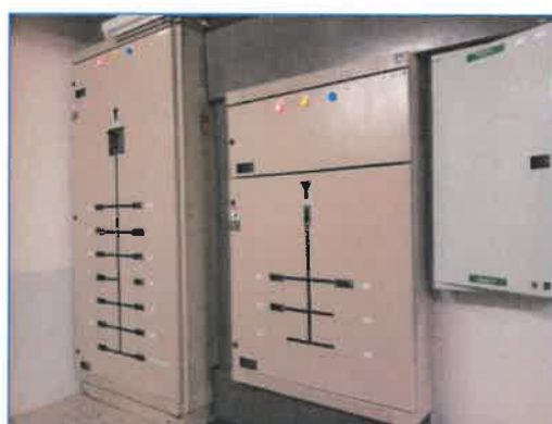
ภาพถ่ายที่ 2.2-19 ระบบแจ้งเตือนอัคคีภัยและป้องกันอัคคีภัยภายในโรงแรม