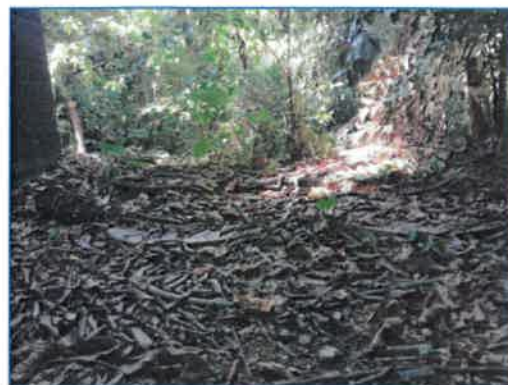
ภาพถ่ายที่ 2.2-26 ระบบบำบัดน้ำเสียสำเร็จรูปของโรงแรม