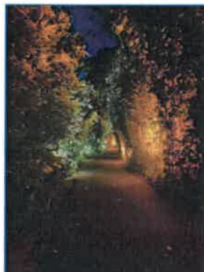
ภาพถ่ายที่ 2.2-5 ระบบไฟฟาส่องสว่าง บริเวณทางเข้า-ออกโครงการ