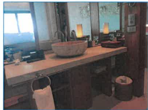
ภาพถ่ายที่ 2.2-13 ถึงขยะมูลฝอยในพื้นที่ต่าง ๆ ของโรงแรม