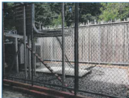
ภาพถ่ายที่ 2.2-15 หม้อแปลงไฟฟ้าของโรงแรม

ภาพถ่ายที่ 2.2-14 จุดรวบรวมขยะแยกประเภท ปุ๋ยชีวภาพของโรงแรม (ต่อ)