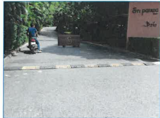
ภาพถ่ายที่ 2.2-1 ป้ายเตือนจำกัดความเร็วรถและสัญญาณบนผิวถนน