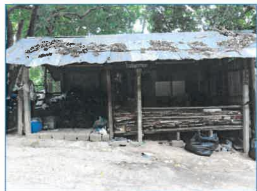
โรงคัดแยกขยะ