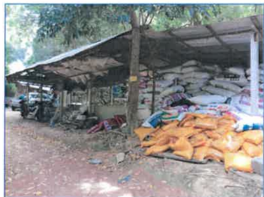
จุดทำปุ๋ยหมักชีวภาพ

ภาพถ่ายที่ 2.2-14 จุดรวบรวมขยะแยกประเภท ปุ๋ยชีวภาพของโรงแรม (ต่อ)