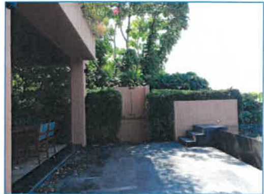
ภาพถ่ายที่ 2.2-23 พื้นที่สีเขียวของโรงแรม