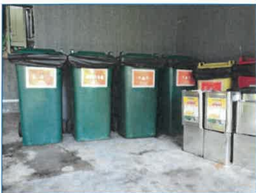
ถังขยะแยกประเภทในโรงแรม