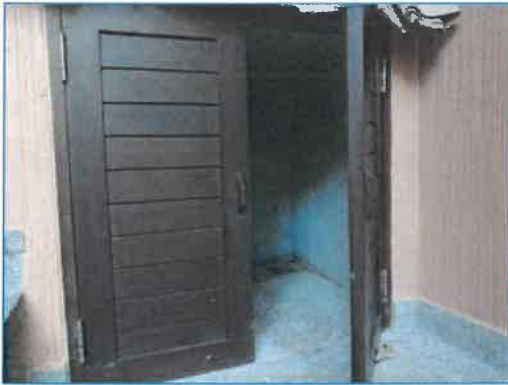
ภาพถ่ายที่ 2.2-28 ห้องพักขยะรวมของโรงแรม