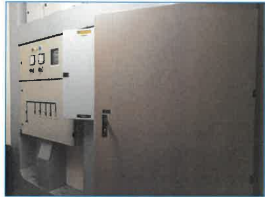
ภาพถ่ายที่ 2.2-29 Circuit Breaker ของโรงแรม