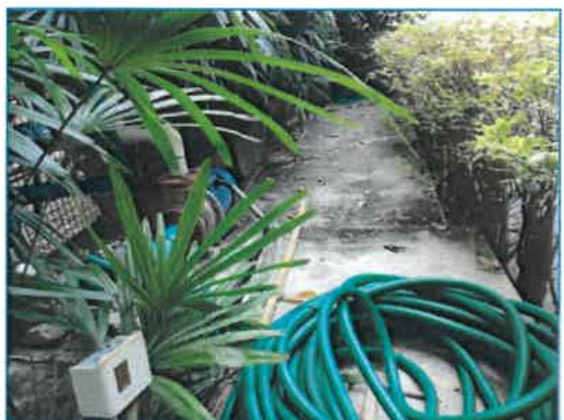
ภาพถ่ายที่ 2.2-8 ระบบปรับปรุงคุณภาพน้ำ และจุดรับน้ำเอกชน