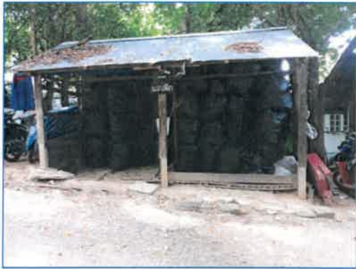
จุดรวบรวมขยะพลาสติก