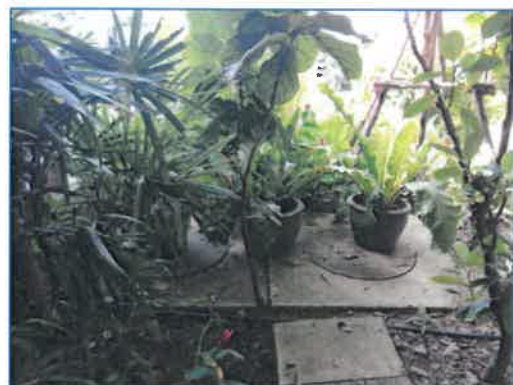
ภาพถ่ายที่ 2.2-11 ระบบบำบัดน้ำเสียสำเร็จรูปของโรงแรม และถังดักไขมัน