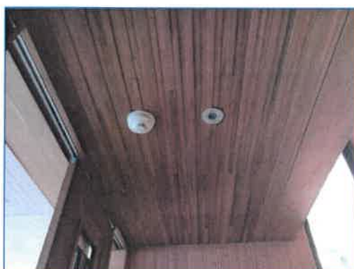
ภาพถ่ายที่ 2.2-31 ระบบแจ้งเตือนอัคคีภัยและป้องกันอัคคีภัยภายในโรงแรม