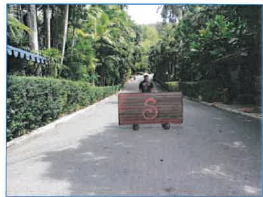
ภาพถ่ายที่ 2.2-4 เจ้าหน้าที่รักษาความปลอดภัย ของโรงแรม