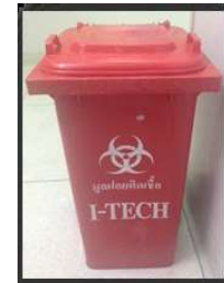
รูปภาพที่ 4