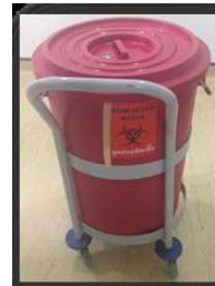
รูปภาพที่ 3