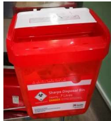
รูปภาพที่ 2