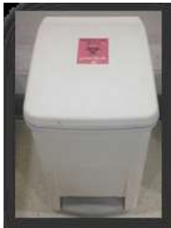
รูปภาพที่ 1