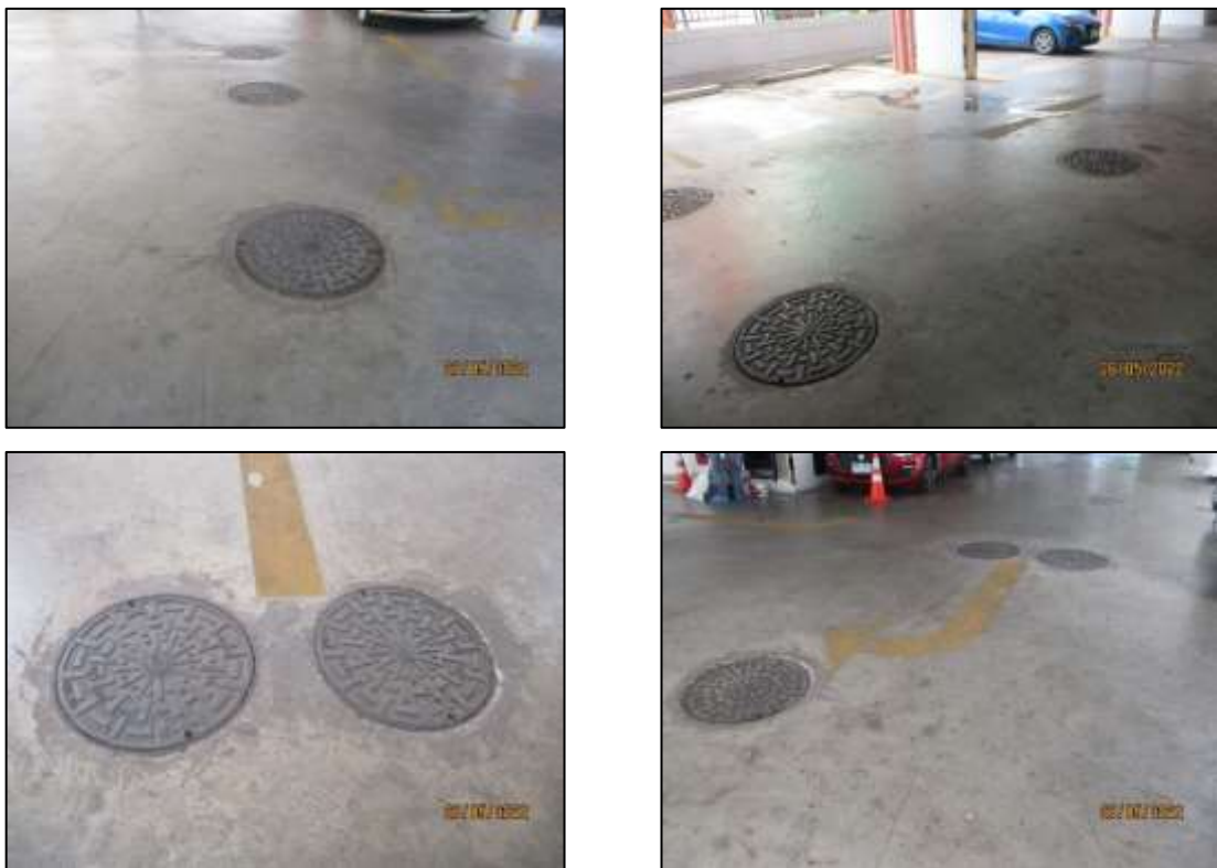
รูปที่ 1-5 ระบบบำบัดน้ำเสียสำเร็จรูป

การกำจัดกากตะกอนจากระบบบำบัดน้ำเสียสำเร็จรูป ทางโครงการจะประสานงานกับสำนักงานเขตดินแดง หรือบริษัทเอกชนที่ได้รับอนุญาตจากหน่วยงานราชการเข้ามาสูบน้ำกากตะกอนไปกำจัดต่อไป ระบบบำบัดน้ำเสียของโครงการทั้ง 4 ชุด ซึ่งเป็นระบบบำบัดน้ำเสียในปริมาณที่น้อยมากตะกอนที่เกิดขึ้นจึงมีน้อย ดังนั้น โครงการจะทำการสูบน้ำกากตะกอนจากระบบบำบัดน้ำเสียของโครงการทั้ง 4 ชุด ไปกำจัดประมาณปีละ 1 ครั้ง