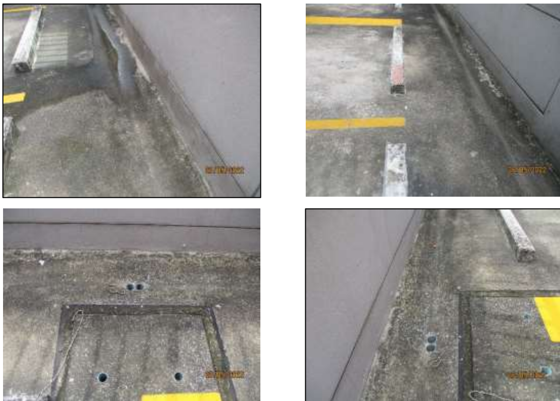
รูปที่ 1-6 ระบบระบายน้ำ