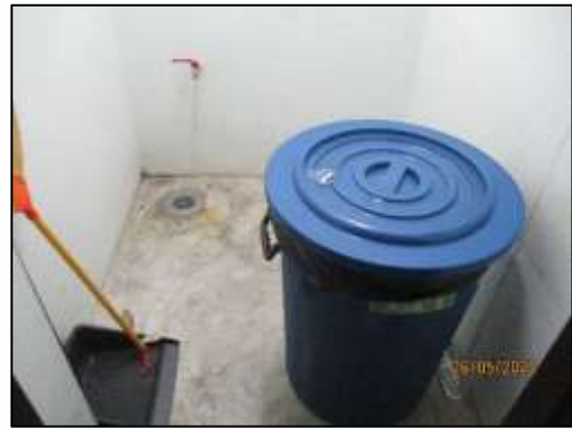
รูปที่ 1-7 ห้องพักขยะ