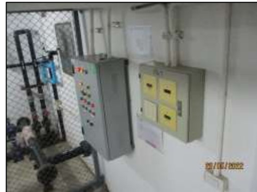
รูปที่ 1-4 ระบบปั้มน้ำของโครงการ