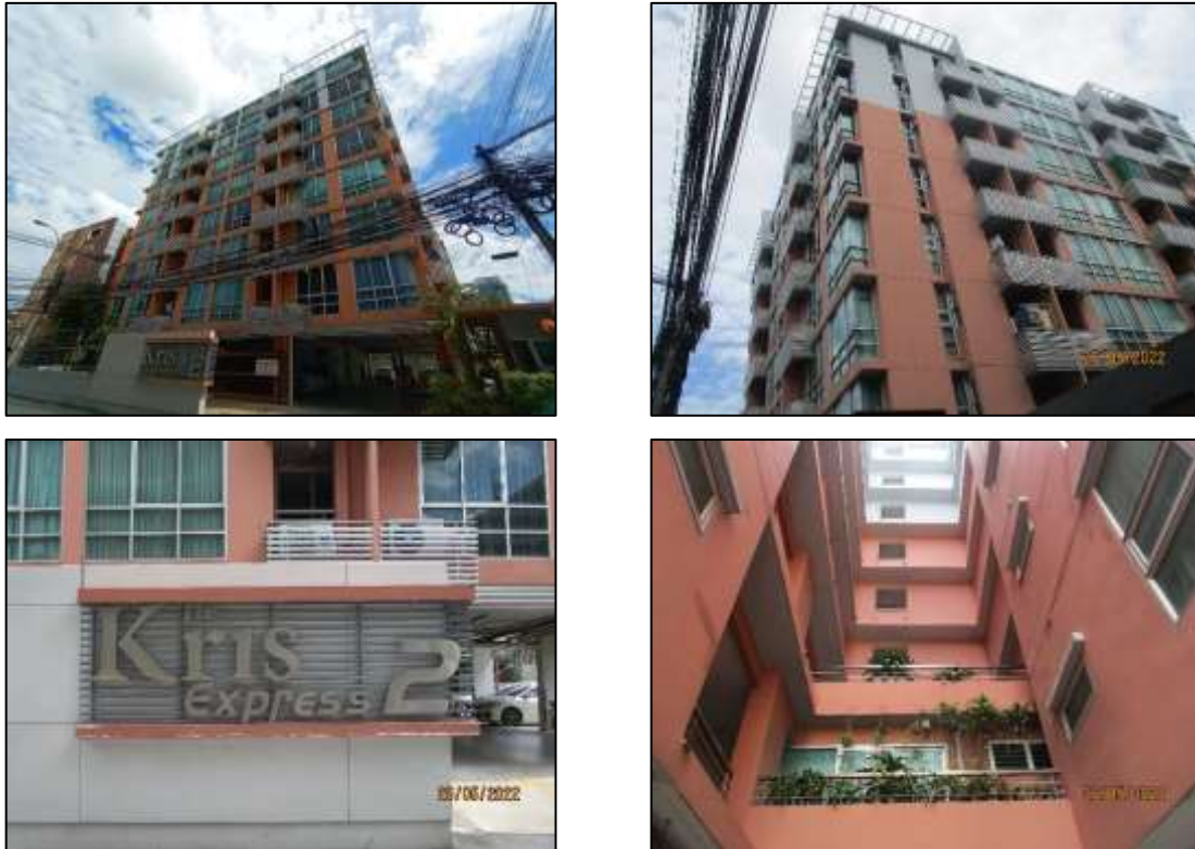
รูปที่ 1-3 สภาพปัจจุบันของโครงการ

ปัจจุบัน โครงการอยู่ในช่วงเปิดดำเนินการ โดยโครงการได้รับใบรับรองการก่อสร้างอาคาร คัดแปลงอาคาร หรือเคลื่อนย้ายอาคาร (อ.6) เรียบร้อยแล้ว ดังแสดงในภาพผนวก ก-3 และแสดงในรูปที่ 1-3