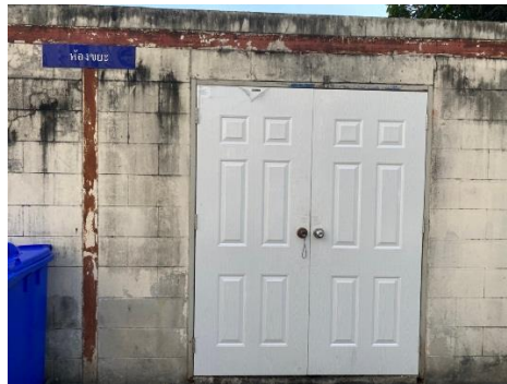
ห้องพักขยะรวมของเฟส 3