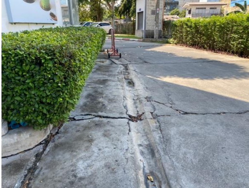
แนวท่อรับน้ำฝนรอบโครงการ

โครงการจัดให้มีท่อรับน้ำฝนจากหลังคาและท่อรับน้ำฝนโดยรอบโครงการ ซึ่งจะไหลไปยังบ่อหน่วงน้ำบริเวณทิศใต้ของโครงการ