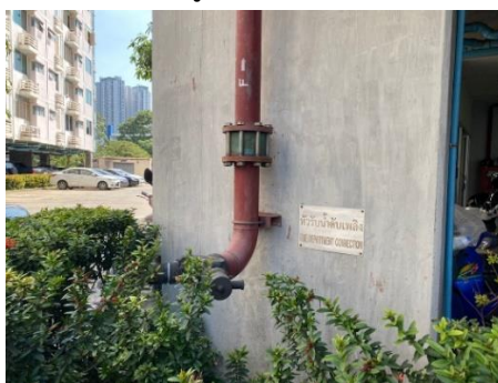
หัวรับน้ำดับเพลิง