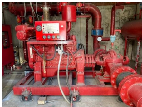
ปั๊มสูบน้ำดับเพลิง