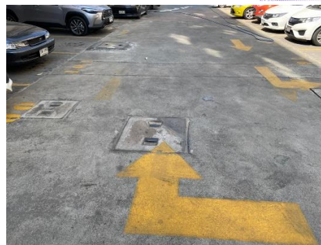
บ่อเก็บน้ำชั้นใต้ดิน