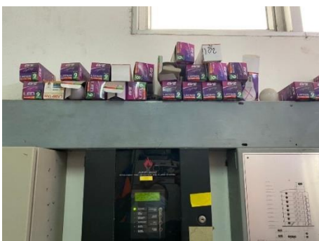
Fire Alarm Control Panel: FCP