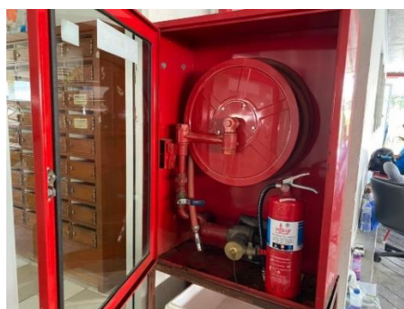
ตู้เก็บสายฉีดน้ำดับเพลิง