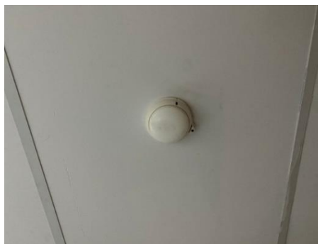
เครื่องตรวจจับความร้อน