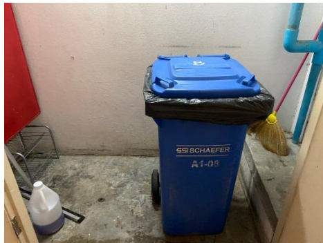
ห้องพักขยะประจำชั้น