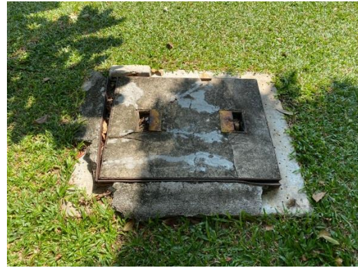
บ่อหน่วงน้ำ