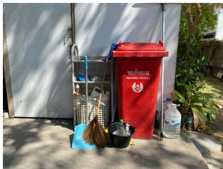
ถึงขยะอันตรายประจำอาคาร