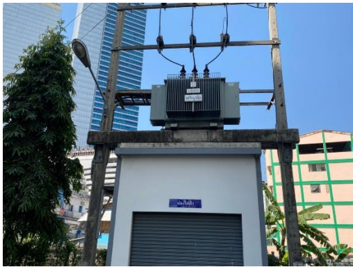
หม้อแปลงไฟฟ้า เฟส 3