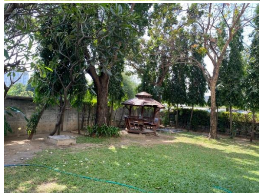
ทักษะนิยภาพบริเวณรอบโครงการ