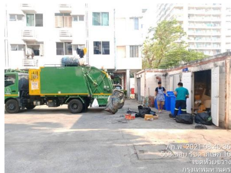
สำนักงานเขตมาเก็บขยะ