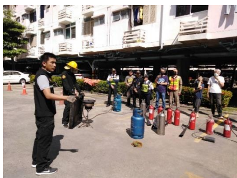
การซ้อมดับเพลิงประจำปี