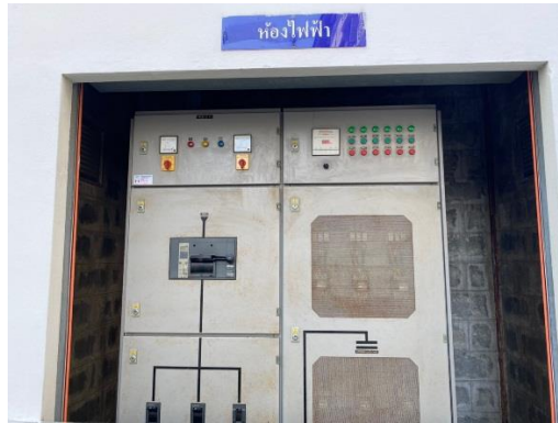
Transformer ประจำอาคาร