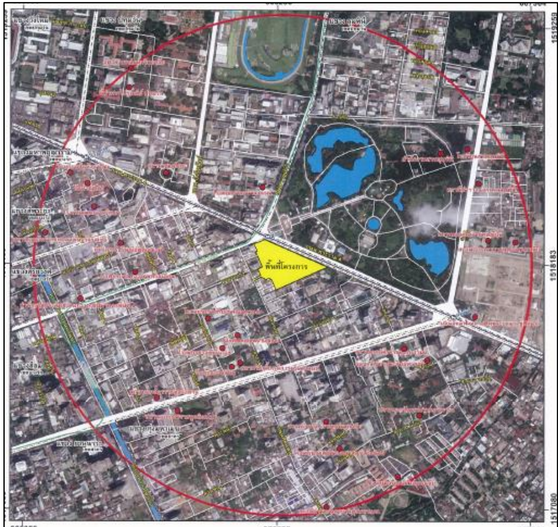
รูปที่ 1-1 แผนที่แสดงที่ตั้งโครงการ