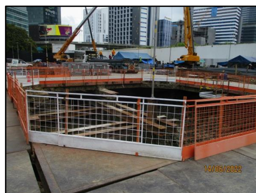
รูปที่ 1.2 สภาพปัจจุบันของพื้นที่โครงการระยะก่อสร้าง