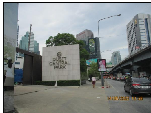
รูปที่ 1.2 (ต่อ) สภาพปัจจุบันของพื้นที่โครงการระยะก่อสร้าง