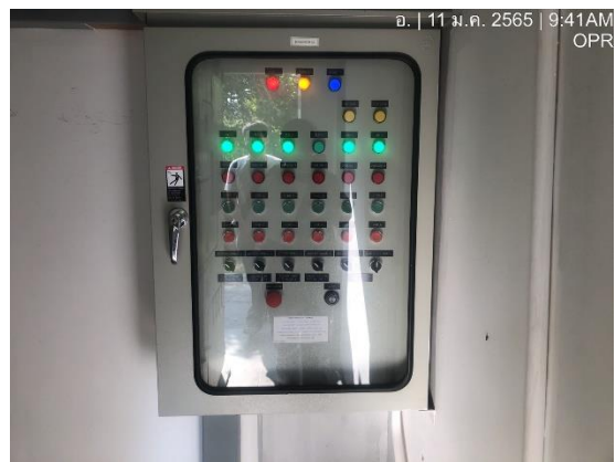
รูปที่ 11 มิเตอร์ไฟฟ้าสำหรับระบบบำบัดน้ำเสีย