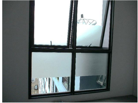
รูปที่ 15 ช่องระบายอากาศภายในอาคาร