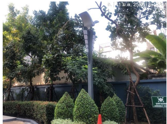
รูปที่ 16 ไฟฟ้าส่องสว่างภายในพื้นที่โครงการ