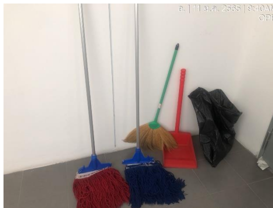
รูปที่ 31 อุปกรณ์ทำความสะอาด