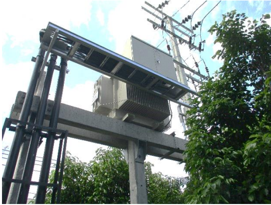
รูปที่ 14 หม้อแปลงไฟฟ้า