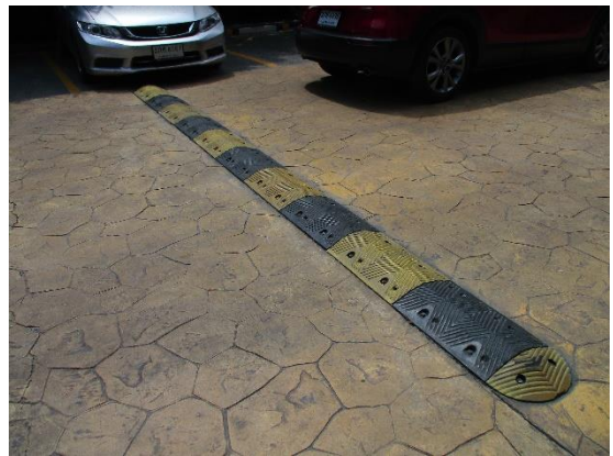
รูปที่ 3 สันนุนชะลอความเร็ว