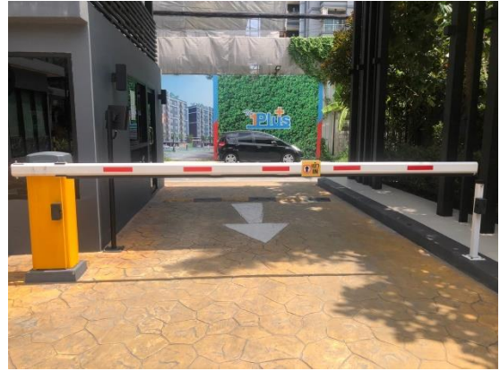
รูปที่ 2 ประตูอัตโนมัติบริเวณทางเข้า-ทางออก