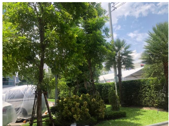
รูปที่ 1 พื้นที่สีเขียว