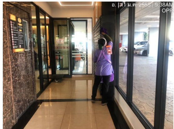
รูปที่ 13 แม่บ้านทำความสะอาด