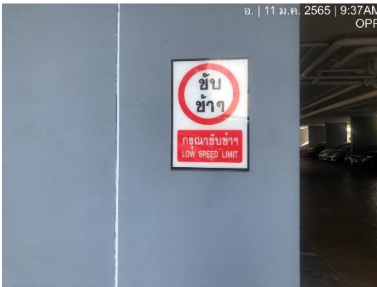
รูปที่ 8 ป้าย “กรุณาขับช้าๆ”