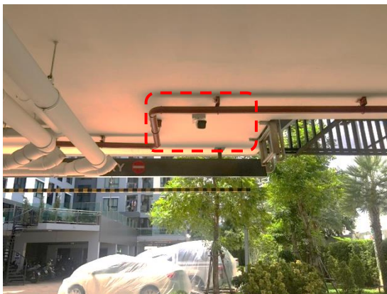
รูปที่ 21 CCTV