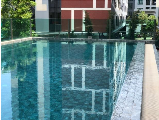
รูปที่ 23 สระว่ายน้ำ