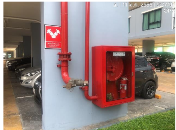
รูปที่ 9 หัวรับน้ำดับเพลิง