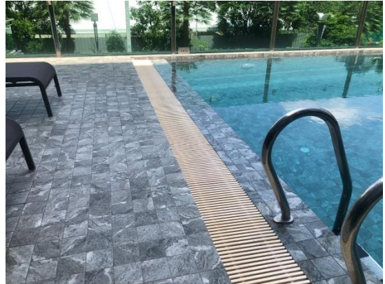
รูปที่ 24 รางระบายน้ำบริเวณสระว่ายน้ำ