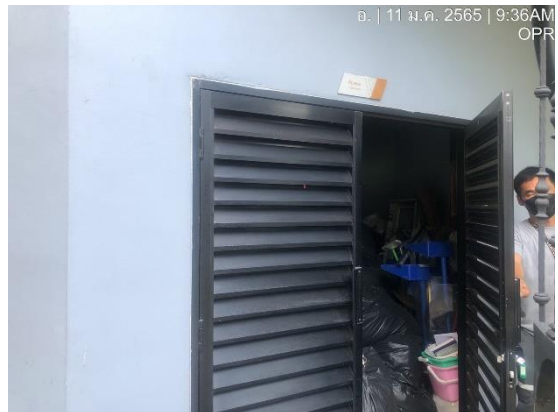
รูปที่ 28 ห้องเก็บสารเคมี