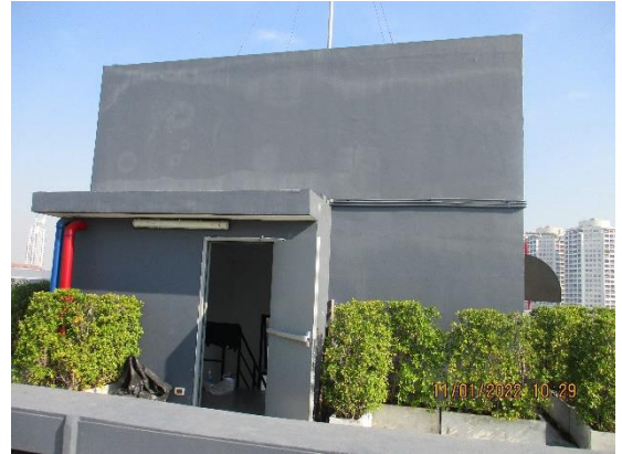
รูปที่ 30 ถังสำรองน้ำ