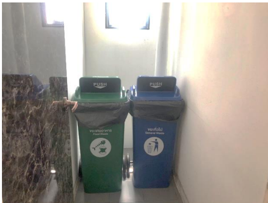
รูปที่ 17 ถังรองรับมูลฝอย