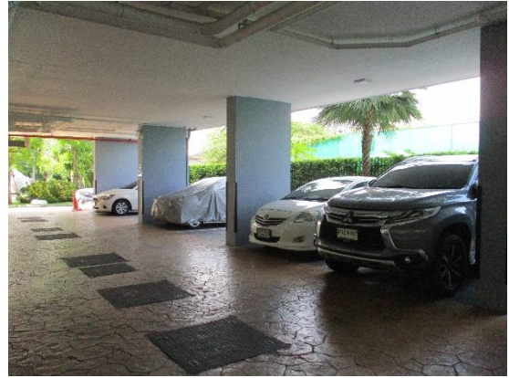
รูปที่ 10 พื้นที่สำหรับจอดรถ