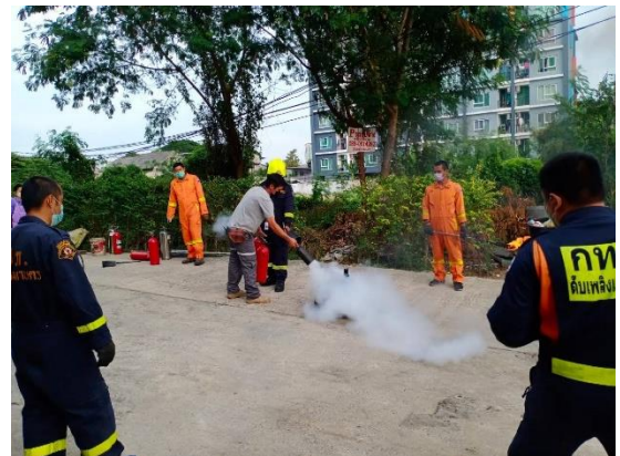
รูปที่ 32 ซ้อมอพยพหนีไฟ