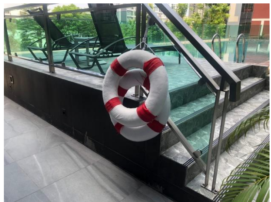
รูปที่ 26 อุปกรณ์ช่วยชีวิตบริเวณสระว่ายน้ำ