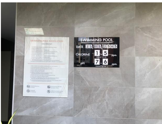
รูปที่ 25 ป้ายบอกค่า pH บริเวณสระว่ายน้ำ