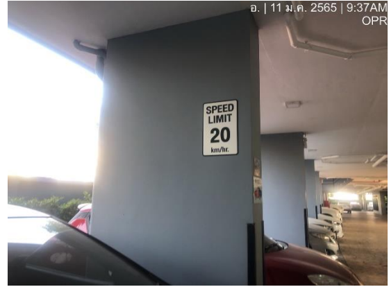
รูปที่ 6 ป้ายจำกัดความเร็ว 20 กม./ชม.