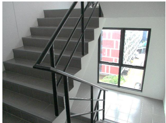
รูปที่ 20 ทางหนีไฟ / บันไดหนีไฟ