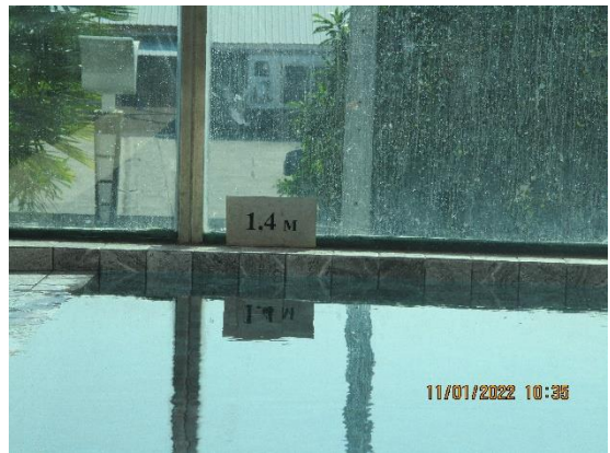
รูปที่ 22 ป้ายบอกความลึกบริเวณสระว่ายน้ำ