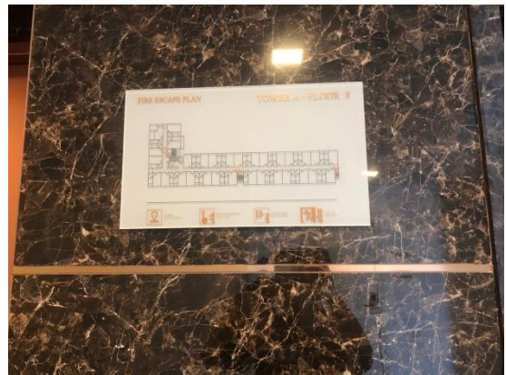
รูปที่ 18 แผนผังของโครงการ