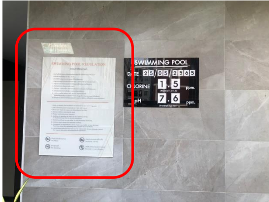
รูปที่ 29 กฎระเบียบการใช้สระว่ายน้ำ