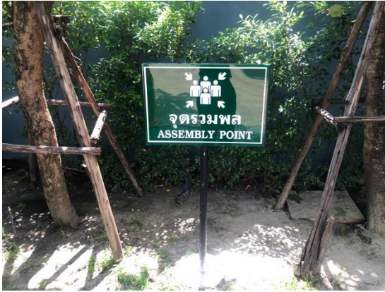
รูปที่ 5 ป้ายจุดรวมพล