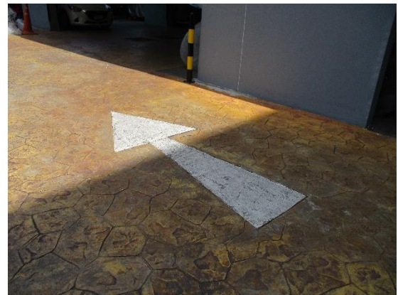
รูปที่ 7 สัญลักษณ์บนพื้นทาง