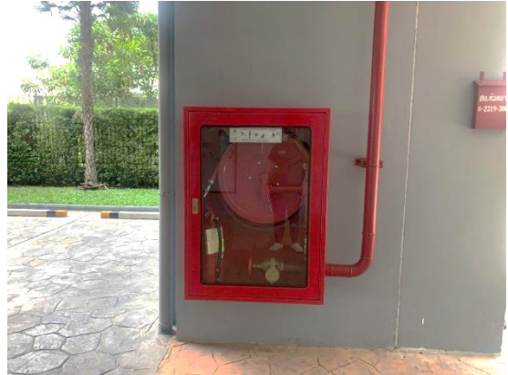
รูปที่ 19 ถังดับเพลิง / ตู้ดับเพลิง