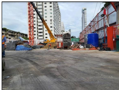
รูปที่ 1-2 สภาพปัจจุบันของโครงการ