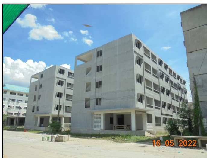
รูปที่ 4 สภาพพื้นที่โครงการเคหะชุมชนและบริการชุมชน (ผู้มีรายได้น้อยถึงปานกลาง) จังหวัดนนทบุรี (บางใหญ่-วัดพระเงิน) ส่วนที่ 1 และส่วนที่ 2 ปัจจุบัน (มิถุนายน 2565)