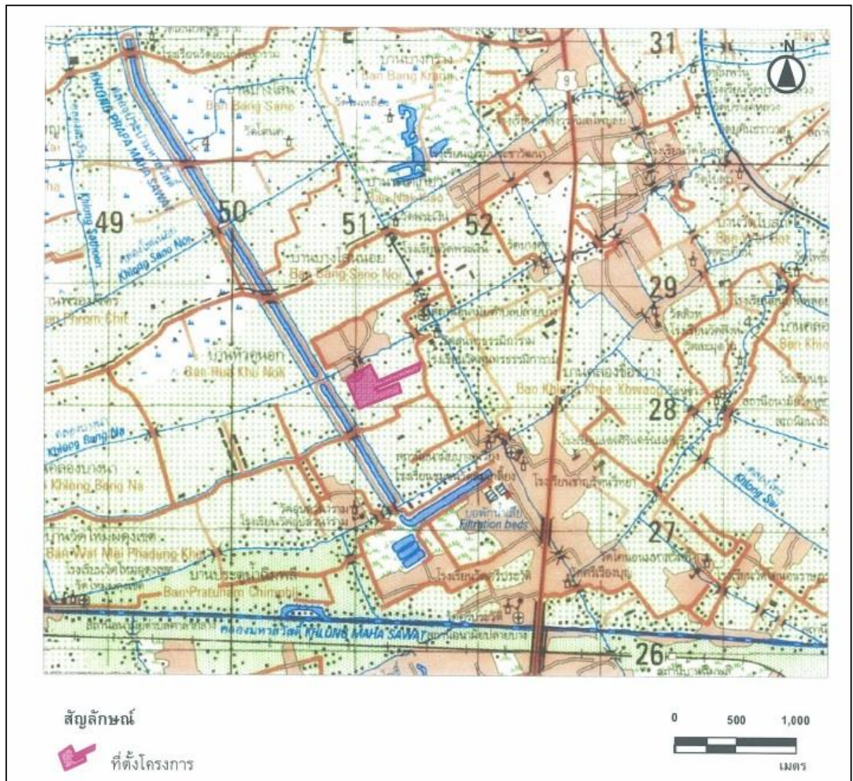
รูปที่ 1 แสดงตำแหน่งที่ตั้งโครงการ