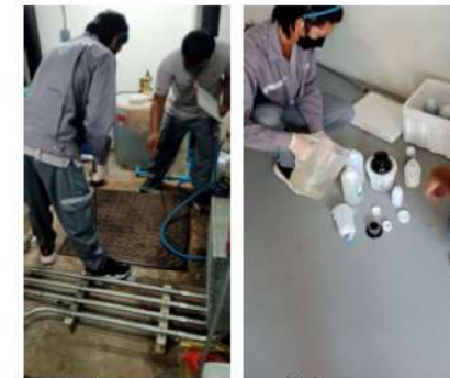
ภาพที่ 3 การเก็บตัวอย่างน้ำทิ้งของโครงการ