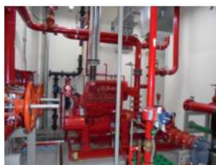
ภาพที่ 2-18 ห้องเครื่องดับเพลิง