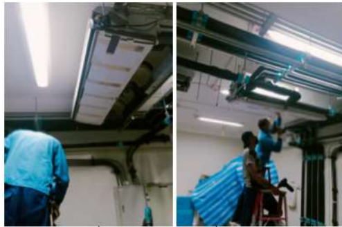
ภาพที่ 2-42 ทำความสะอาดเครื่องปรับอากาศ