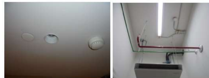
ภาพที่ 2-19 หัวกระจายน้ำอัตโนมัติและเครื่องตรวจจับควัน