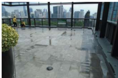
ภาพที่ 2-25 พื้นหินโพลีโพรพิลีน