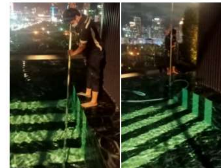
ภาพที่ 2-41 สูดตะกอน ทำความสะอาดสระว่ายน้ำ