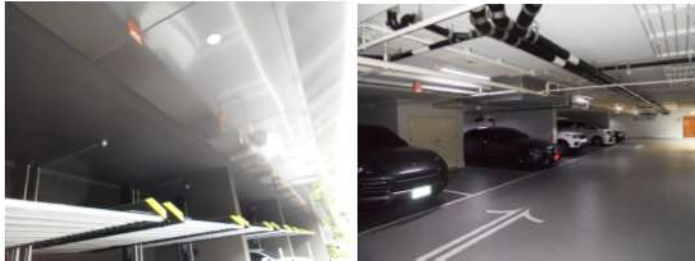
ภาพที่ 2-7 ที่จอดรถของโครงการ