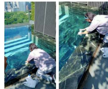
ภาพที่ 4 การเก็บตัวอย่างน้ำระเหยน้ำของโครงการที่ส่วนลึกและส่วนต้น