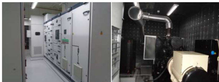
ภาพที่ 2-17 ห้องเครื่องไฟฟ้าและห้องเครื่องไฟฟ้าฉุกเฉิน