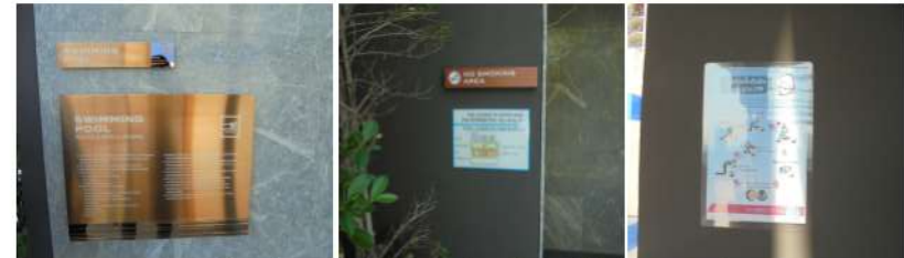
ภาพที่ 2-12 ป้ายกฎระเบียบการใช้สระว่ายน้ำ และป้ายแสดงวิธีปฐมพยาบาลคนจมน้ำ