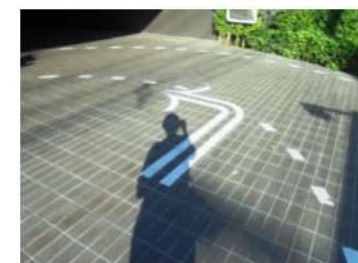
ภาพที่ 2-5 สัญลักษณ์ลูกศรแสดงทิศทางการจราจรบนถนนรอบอาคาร