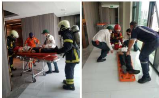
ภาพที่ 2-39อบรมและซ้อมดับเพลิงปี 2564