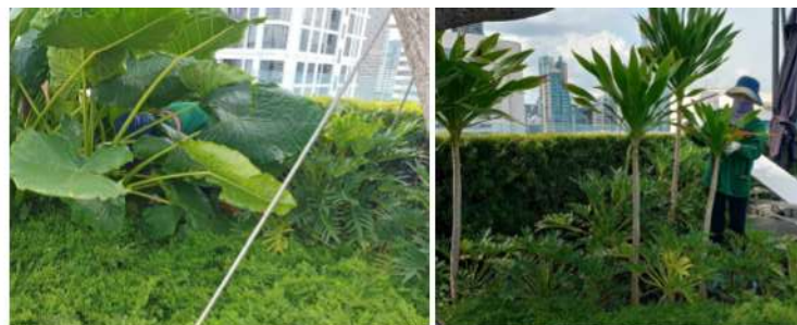
ภาพที่ 2-2 การดูแลรักษาพื้นที่สีเขียวภายในโครงการ