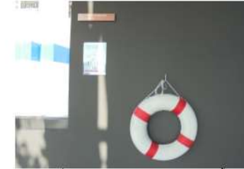
ภาพที่ 2-11 อุปกรณ์ช่วยชีวิตบริเวณสระว่ายน้ำ