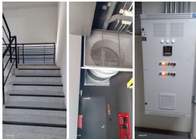
ภาพที่ 2-31 บันไดหนีไฟ และพัดลมระบายอากาศ