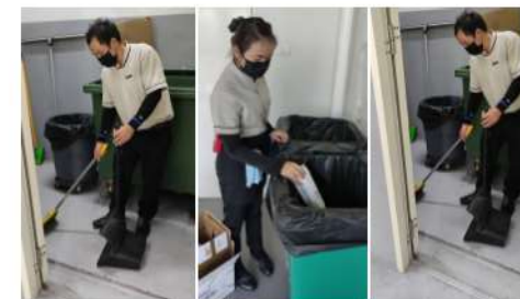
ภาพที่ 2-14 ภายในห้องพักรวมของโครงการ และมีที่ล้างทำความสะอาดห้องพักรวม และที่รวบรวมน้ำเสีย