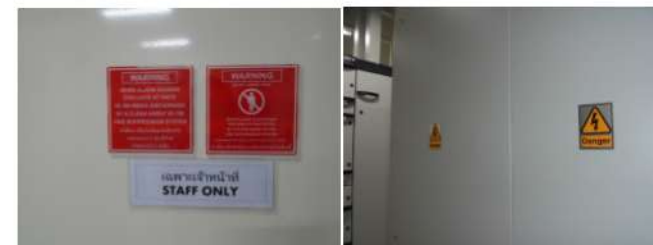
ภาพที่ 2-20 บ้ายเตือนอันตรายห้องเครื่องไฟฟ้า