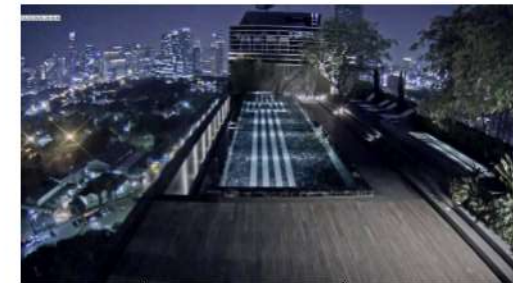
ภาพที่ 2-32 ไฟส่องสว่างบริเวณสระว่ายน้ำกลางแจ้งกลางคืน