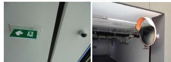
ภาพที่ 2-28 กล้องวงจรปิดและป้ายหนีไฟอาคาร และกระจกโถงบริเวณจุดขึ้นลงบันได