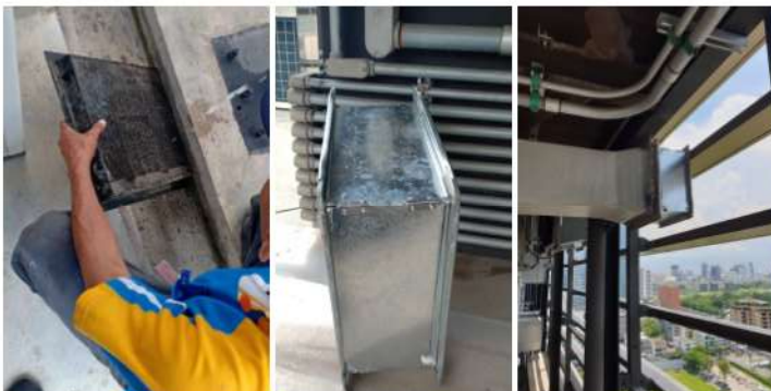
ภาพที่ 2-35 ติดตั้ง ถังกรองบรรจุ Activated Carbon และแผ่น Filter สำหรับกักขัง Aerosol และดูแลรักษาโดยตอนแผ่น Filter นำมาล้าง