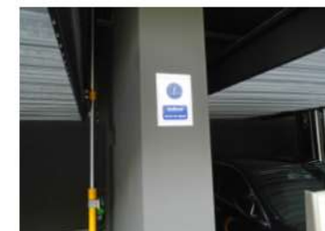
ภาพที่ 2-4 ติดป้ายห้ามติดเครื่องแฉิ่งไว้