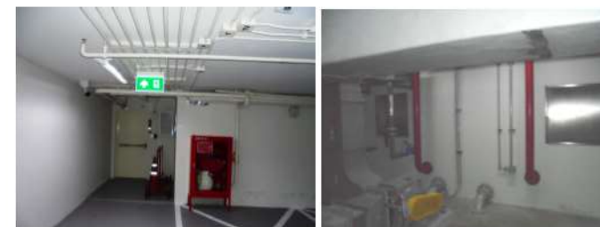
ภาพที่ 2-21 ตู้เก็บสายดินนำดับเพลิงพร้อมอุปกรณ์ และท่ออื่น