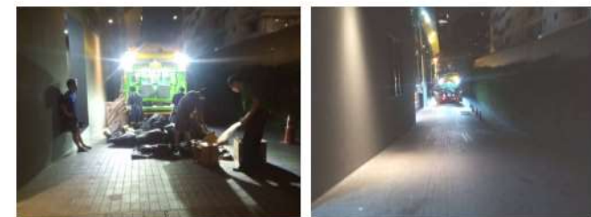
ภาพที่ 2-34 ดูแลไร้รื้อจัดเก็บมูลฝอยเข้ามาจัดเก็บภายในโครงการ