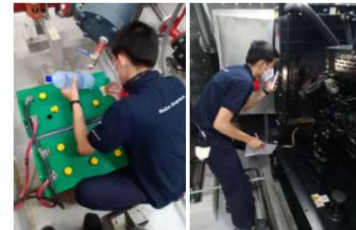
ภาพที่ 2-40 ตรวจสอบและบำรุงรักษา ระบบ Fire Pump และ Generator