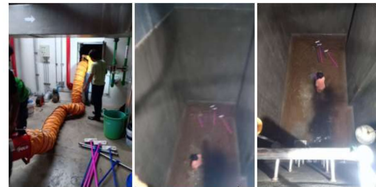
ภาพที่ 2-36 ล้างทำความสะอาดถังสำรองน้ำใช้ (ต่อ)