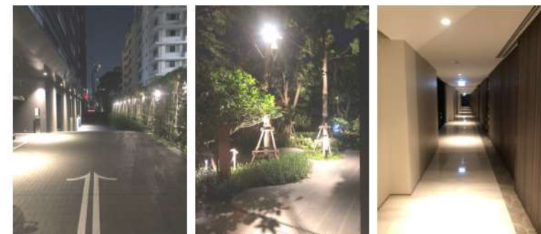
ภาพที่ 2-27 ไฟฟ้าส่องสว่างภายในโครงการ