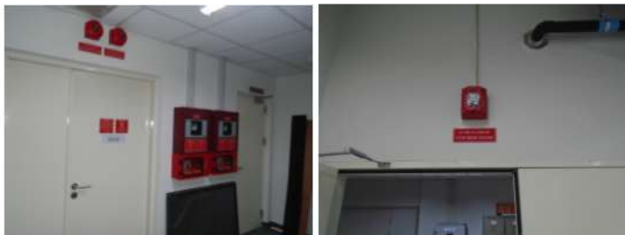
ภาพที่ 2-23 อุปกรณ์แจ้งเหตุโดยใช่มือดึง กิ่งสัญญาณเตือนภัย และโทรศัพท์ฉุกเฉิน