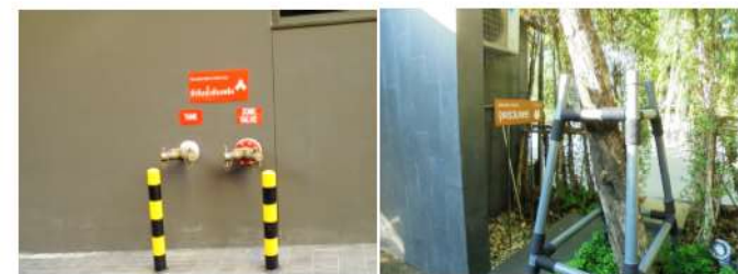
ภาพที่ 2-37 รั้วกันน้ำดับเพลิงจากภายนอก และพื้นที่จุดรวมพลด้านหน้าทางเข้าออกโครงการ