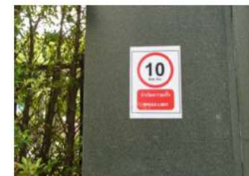
ภาพที่ 2-3 ติดป้ายจำกัดความเร็ว