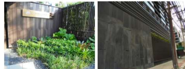
ภาพที่ 2-26 ป้ายชื่อโครงการและรั้วด้านติดกับถนนสาธารณะ