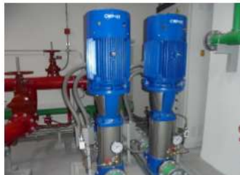
ภาพที่ 2-9 ห้องเครื่องสูบน้ำดับเพลิง และน้ำประปา