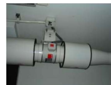
ภาพที่ 2-6 พัดลมระบายอากาศที่มีตัวกรองอากาศ