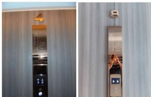
ภาพที่ 2-24 ป้ายแบบแปลนแผนผังของอาคาร