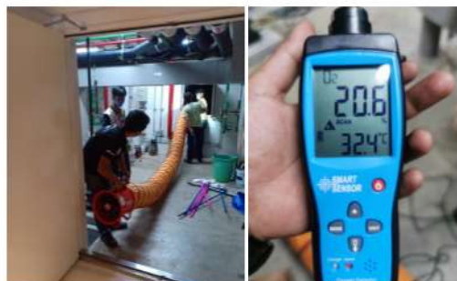
ภาพที่ 2-36 ล้างทำความสะอาดถังสำรองน้ำใช้