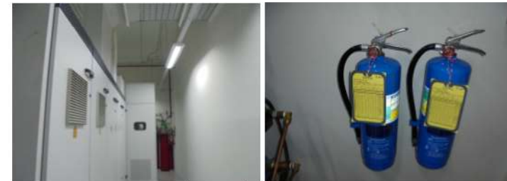
ภาพที่ 2-13 ห้องเครื่องไฟฟ้าและถังดับเพลิงเคมี