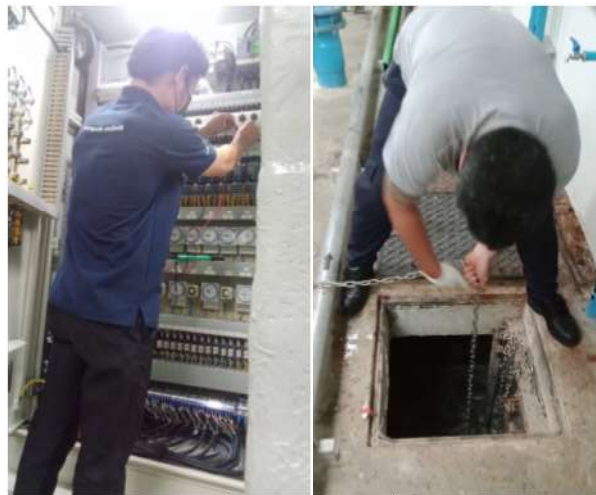
ภาพที่ 2-43 ตรวจสอบระบบน้ำดื่ม