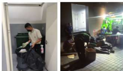
ภาพที่ 2-16 พนักงานคัดแยกมูลฝอยทุกถุง