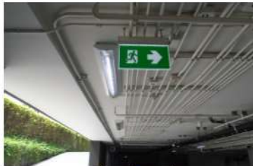
ภาพที่ 2-29 บัณฑิตทางหนีไฟ