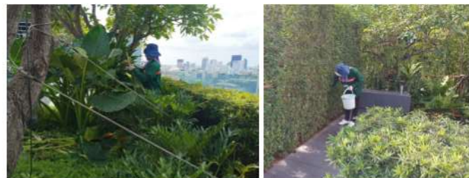
ภาพที่ 2-1 สภาพรั้วโปร่ง และมีกระเบื้องดินเผาตามแนวรั้วโครงการ