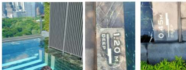
ภาพที่ 2-10 สระว่ายน้ำของโครงการ และป้ายบอกความลึกของสระว่ายน้ำ