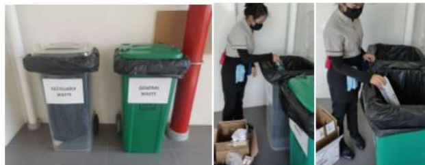
ภาพที่ 2-15 มีถังรองรับมูลฝอยขนาด 50 ลิตรตั้งไว้ตามจุดต่าง ๆ และแบ่งแยกมูลฝอย