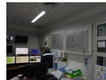
ภาพที่ 2-22 ห้องแมงควบคุมอุปกรณ์แจ้งเตือนเพลิงไหม้