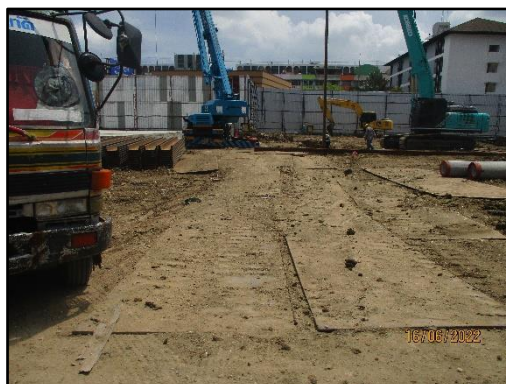
รูปที่ 1-5 สภาพปัจจุบันของโครงการ