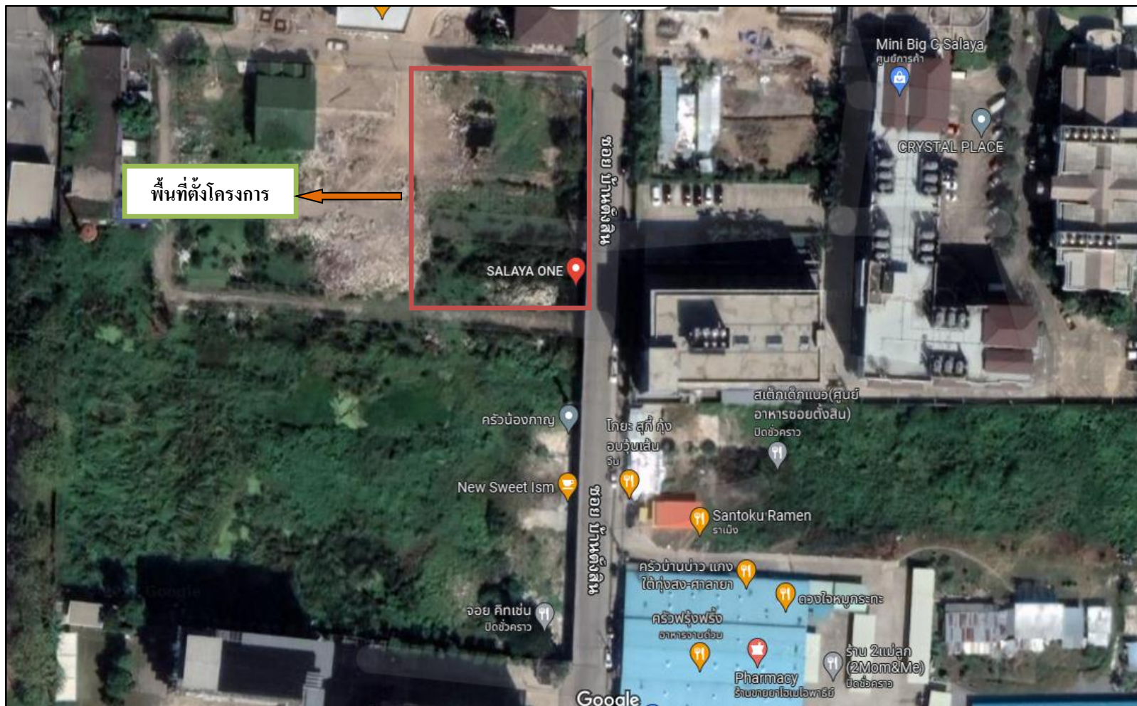
รูปที่ 1-1 พื้นที่ตั้งโครงการ