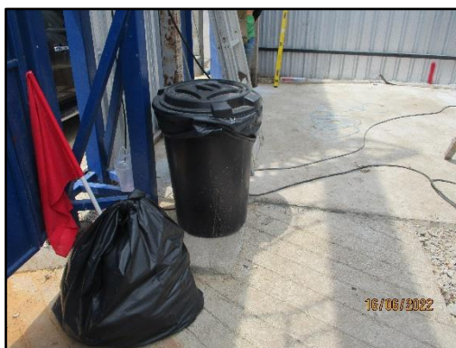
รูปที่ 1-4 ถังมูลฝอย วางโดยรอบบริเวณพื้นที่ก่อสร้าง