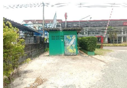
(7) จัดให้มีภาชนะรองรับมูลฝอยแต่ละประเภท ที่มีความทนทานและมีฝาปิดมิดชิด พร้อมทั้งจัดให้มีที่พักมูลฝอยรวม