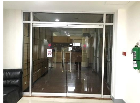
(12) จัดให้มีตู้ฉีดยาฆ่าเชื้อและถังดับเพลิงใกล้กับบริเวณก่อสร้าง/ตัดแปลง