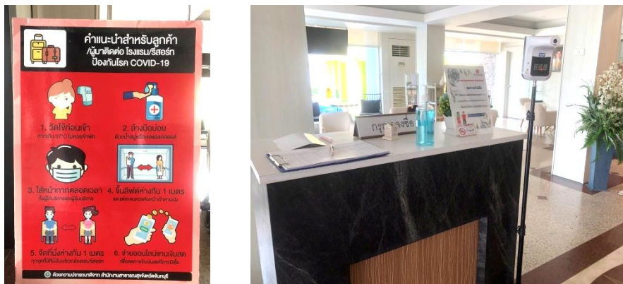
(10) จัดให้มีสื่อประชาสัมพันธ์ และจุดคัดกรองตามมาตรการป้องกันการเกิดโรคระบาด (Covid-19)