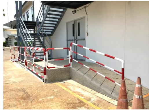
(11) การปรับปรุงบันไดหนีไฟและทางลาดของอาคารโครงการ ขนาด 6 ชั้น