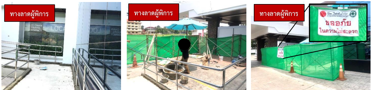
(3) โครงการทำการดัดแปลงที่ละอาคาร โดยอาคาร 6 ชั้น ได้ปรับปรุงภายในอาคารที่บริเวณชั้น 1 และปรับปรุงทางลาดสำหรับผู้พิการด้านหน้าอาคารโรงแรม