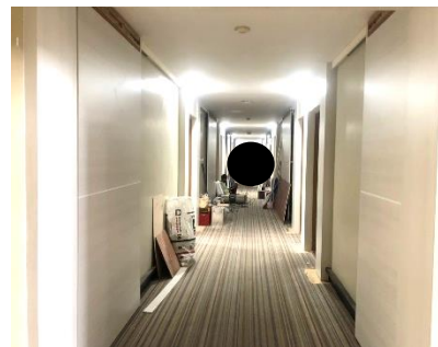
(4) จัดพื้นที่สำหรับทาสี เพื่อความเป็นระเบียบเรียบร้อย