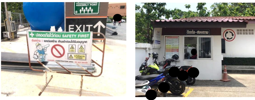
(9) จัดให้มีป้ายห้ามเข้าพื้นที่ก่อสร้าง และมีเจ้าหน้าที่รักษาความปลอดภัยคอยอำนวยความสะดวกด้านการจราจร