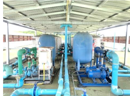
(5) ถังเก็บน้ำใช้ของโครงการ