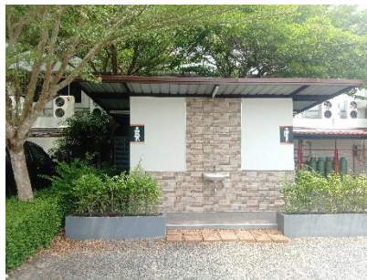
(6) กำหนดให้คนงานใช้ห้องน้ำห้องส้วมภายในโครงการ