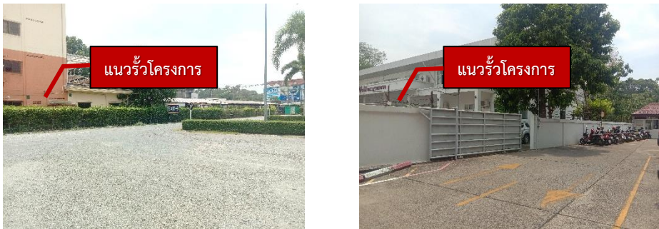
(2) มีการดูแลสภาพรั้วที่ล้อมรอบแนวเขตที่ดินโครงการทุกด้านให้มีสภาพดีอยู่เสมอ