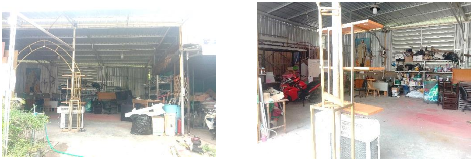
(1) จัดให้มีบริเวณจัดเก็บวัสดุก่อสร้าง/ตัดแปลงอาคาร