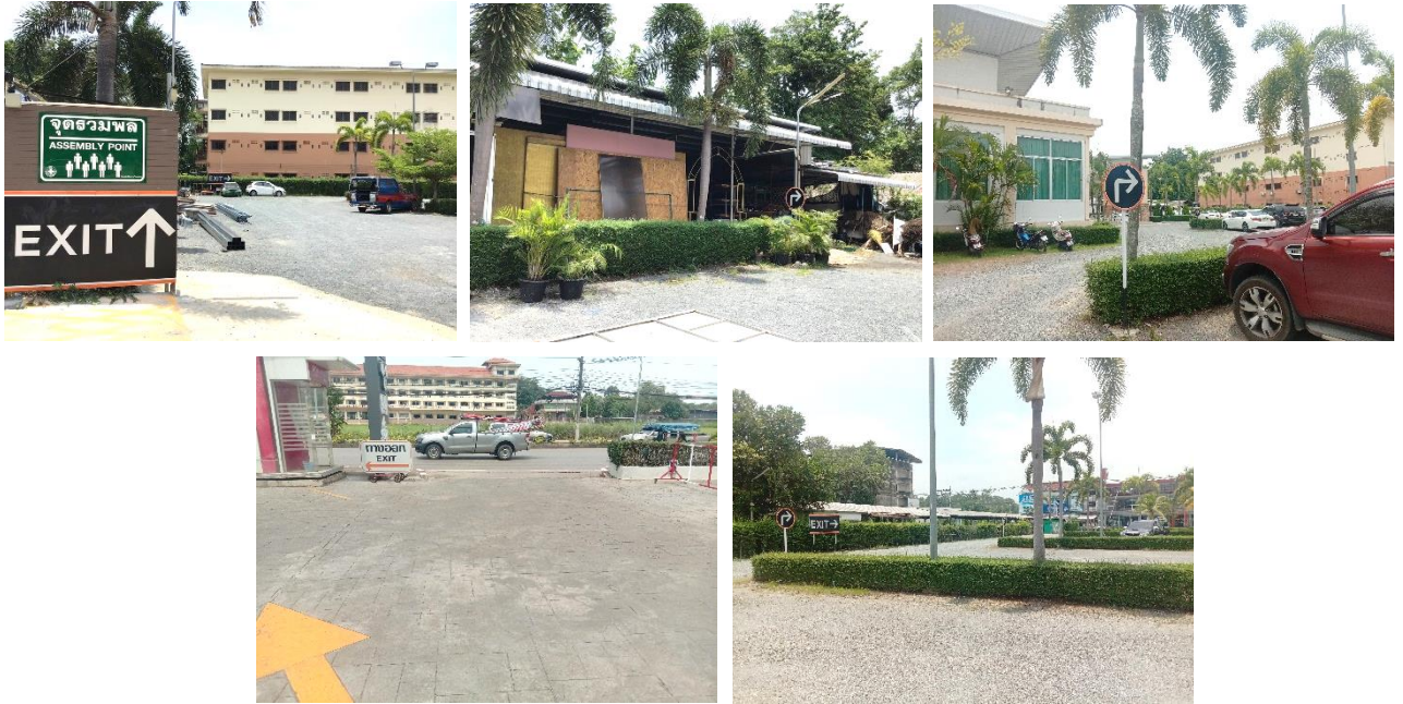
(8) จัดให้มีป้ายบอกทิศทางเข้า-ออก โครงการ