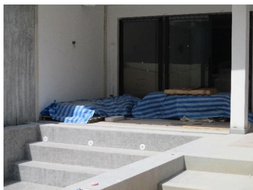
รูปที่ 8 ผ้าใบปิดคลุมวัสดุก่อสร้าง