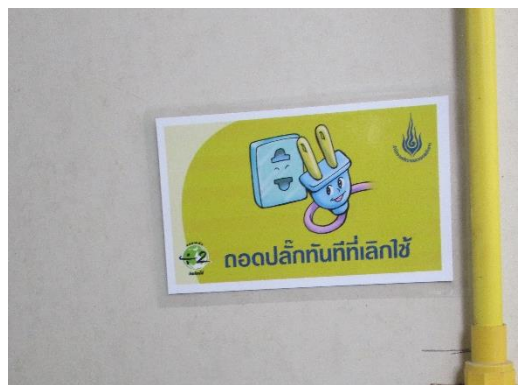
รูปที่ 16 ป้ายรณรงค์ประหยัดไฟ