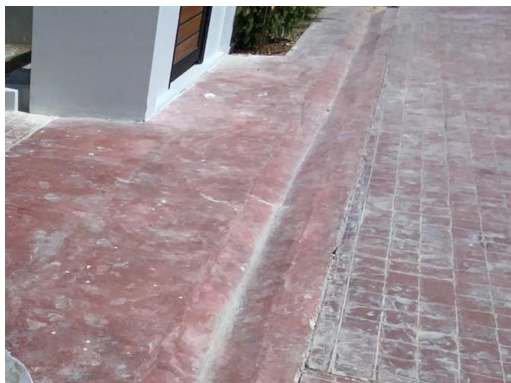
รูปที่ 6 รางระบายน้ำ