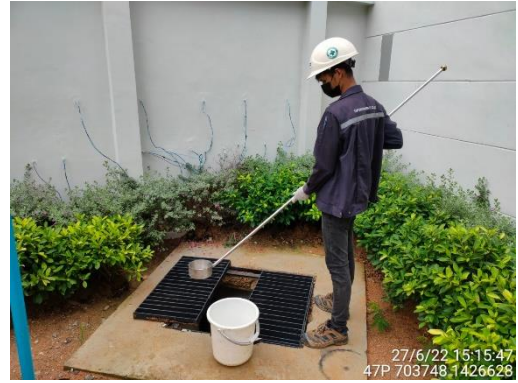
รูปที่ 12 เจ้าหน้าที่ตรวจวัดคุณภาพน้ำ