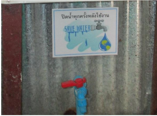
รูปที่ 11 ป้ายรณรงค์ประหยัดน้ำ