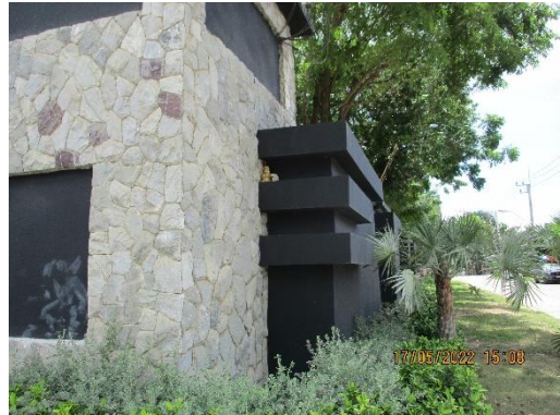
รูปที่ 1 รั้วรอบคอนกรีตรอบพื้นที่โครงการ