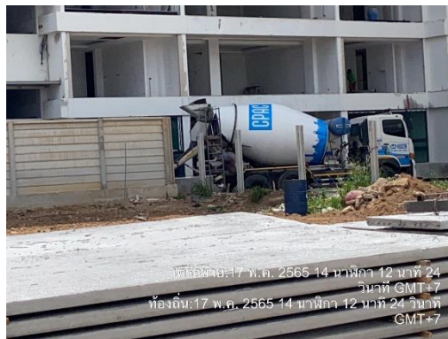
รูปที่ 7 รถผสมปูนสำเร็จรูป