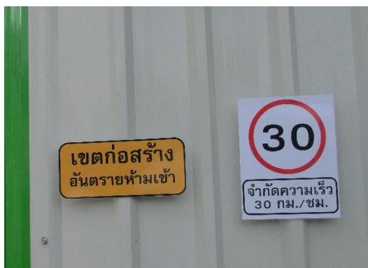
รูปที่ 9 ป้ายจำกัดความเร็ว 30 กม./ชม.