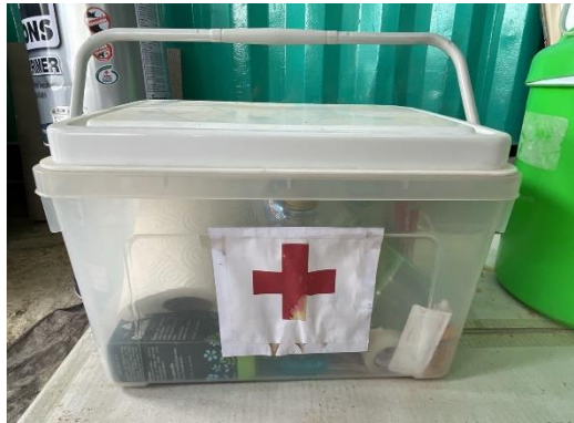
รูปที่ 22 กล่องปฐมพยาบาลเบื้องต้น