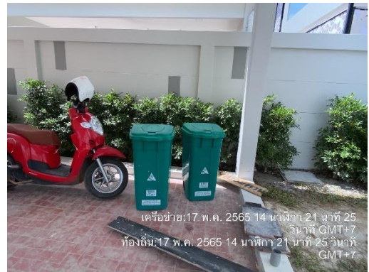
รูปที่ 14 ถังรองรับมูลฝอย