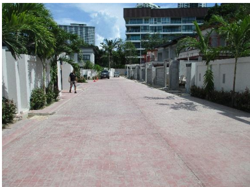
รูปที่ 4 ถนนทางเดินรถ