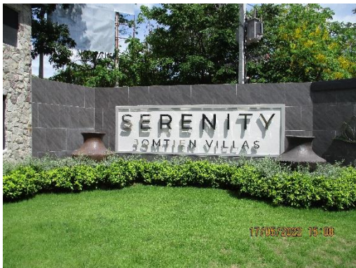
รูปที่ 2 ป้ายชื่อโครงการ