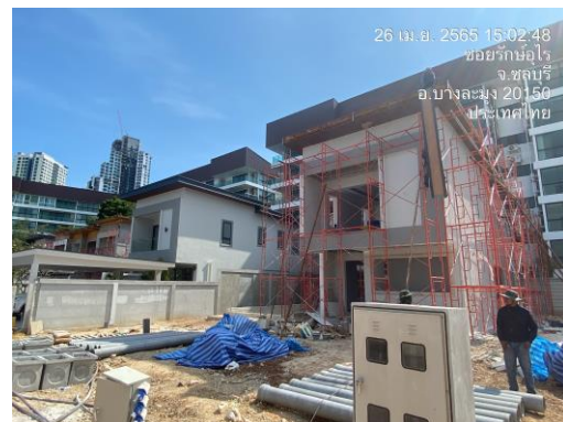
รูปที่ 23 สภาพปัจจุบันของโครงการ