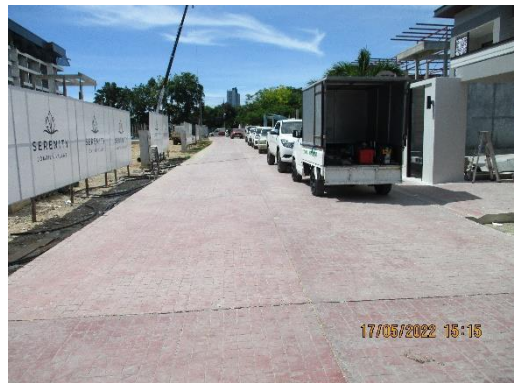
รูปที่ 3 พื้นที่จอดรถ