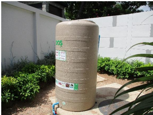
รูปที่ 13 ถังสำรองน้ำ