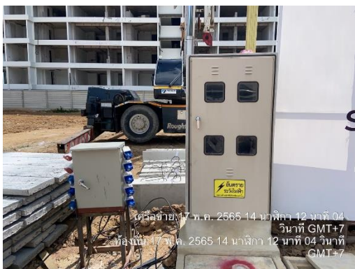
รูปที่ 15 หม้อแปลงไฟฟ้า