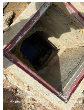
รูปที่ 5 บ่อดักตะกอน