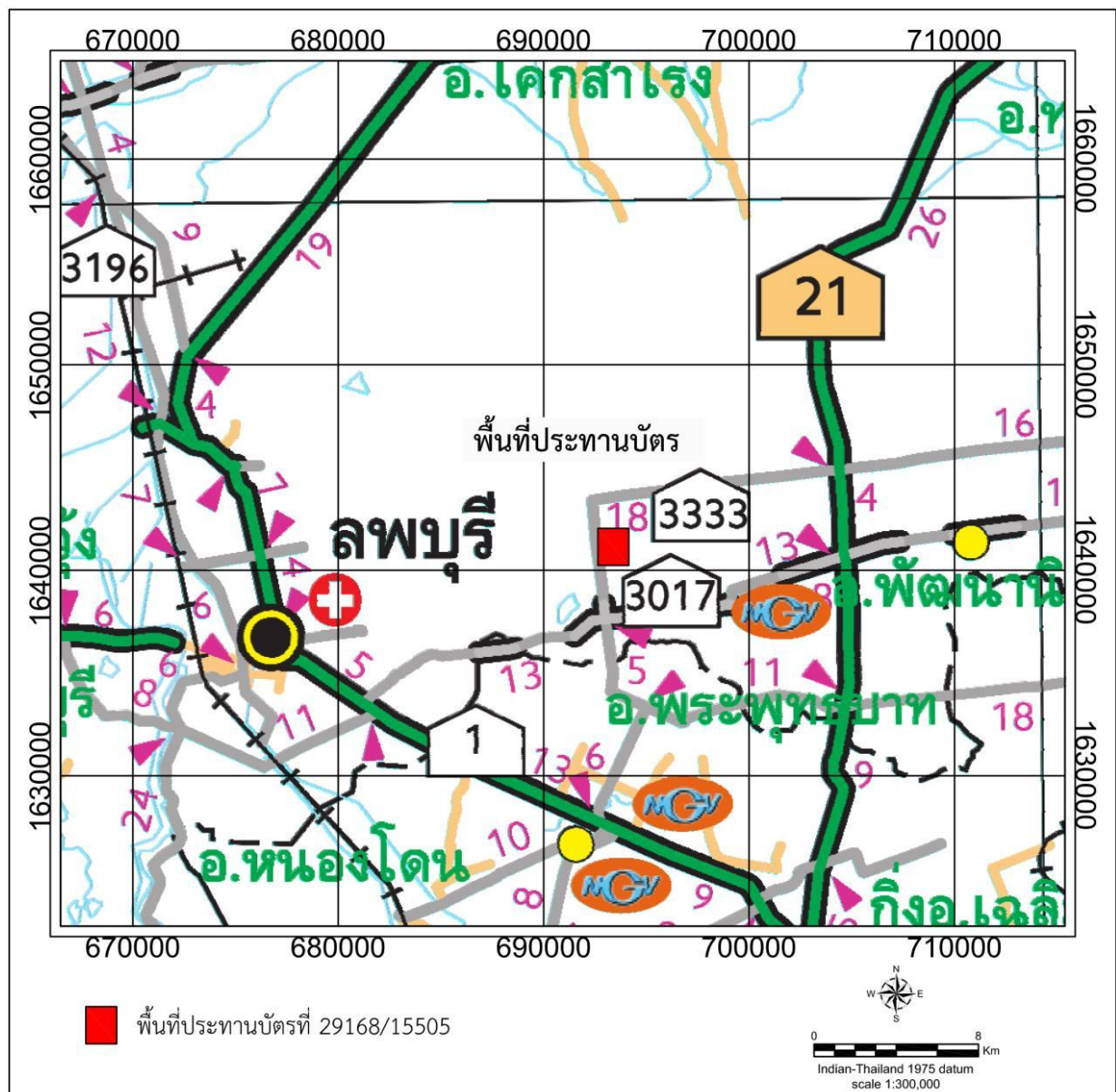
รูปที่ 1-3 แผนที่การคมนาคมเข้าสู่พื้นที่โครงการ

การเดินทางไปยังจุดที่ตั้งแปลงประทานบัตร โดยทางรถยนต์จากจังหวัดสระบุรี ไปทางจังหวัดลพบุรี ตามทางหลวงหมายเลข 1 ผ่านอำเภอพระพุทธบาทประมาณ 29 กิโลเมตร แล้วเลี้ยวขวาที่บ้านสามแยกนิคมลพบุรี ไปอำเภอพัฒนานิคม ตามทางหลวงหมายเลข 3302 จนถึงวงเวียนโคกตูมประมาณ 10 กิโลเมตร จากนั้นไปบ้านมะนาวหวาน ตามทางหลวงหมายเลข 3333 อีกประมาณ 2.7 กิโลเมตร แปลงประทานบัตรตั้งอยู่ทางซ้ายมือติดสี่แยก ถนนชอยศูนย์ - สาย 2 ซ้าย รวมระยะทางทั้งสิ้นประมาณ 42.7 กิโลเมตร (รูปที่ 1-3)