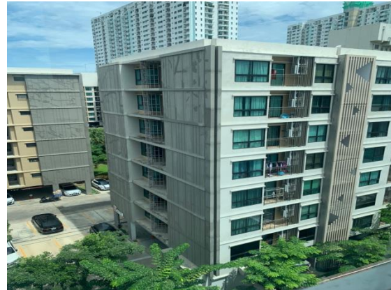
ทิศตะวันตก ติดกับ คอนโด สุภาลัย คิวท์ รัชโยธิน-พหลโยธิน 34