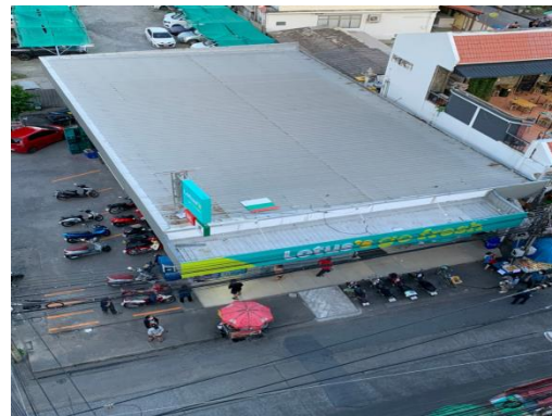
ทิศตะวันออก ติดกับ อาคารพาณิชย์ ขนาดความสูง 3 ชั้น จำนวน 4 คูหา และ LOTUS'S GO FRESH