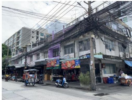
ทิศใต้ ติดกับ อาคารพาณิชย์ ขนาดความสูง 3 ชั้น