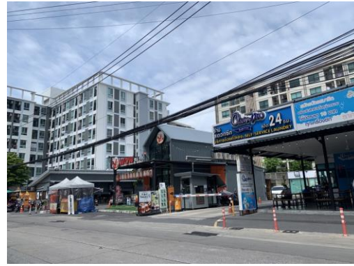
ทิศเหนือ ติดกับ โครงการ Block space พหลโยธิน 34