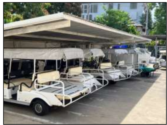
ภาพถ่าย 3-2 รถกอล์ฟ