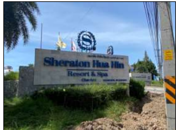
ภาพถ่าย 3-14 ป้ายชื่อโครงการ