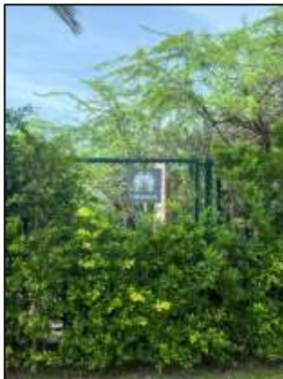
ภาพถ่าย 3-13 จุดรวมพล