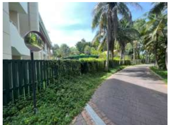
ภาพถ่าย 3-4 พื้นที่สีเขียว

ภาพถ่ายแสดงการปฏิบัติตามมาตรการฯ โรงแรมเชรატัน หัวหินรีสอร์ทแอนด์สปา ระหว่างเดือนมกราคม – มิถุนายน พ.ศ.2565 (ต่อ)