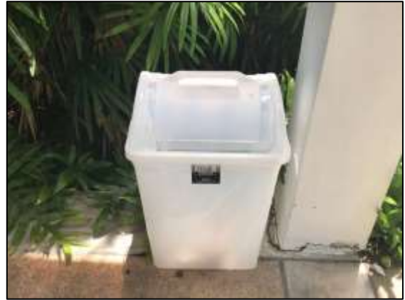
ภาพถ่าย 3-8 ถึงขยะ