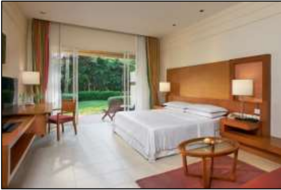
ภาพถ่าย 3-16 การตกแต่งห้องด้วยสีโทนอ่อน