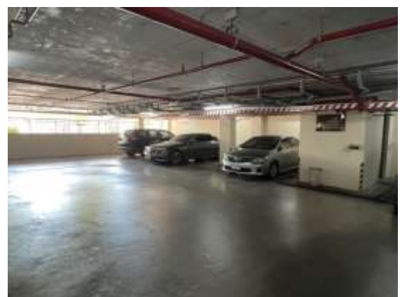
ภาพถ่าย 3-15 ที่จอดรถ

ภาพถ่ายแสดงการปฏิบัติตามมาตรการฯ โรงแรมเชรატัน หัวหินรีสอร์ทแอนด์สปา ระหว่างเดือนมกราคม – มิถุนายน พ.ศ.2565 (ต่อ)