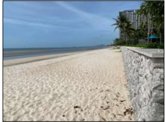
ภาพถ่าย 3-17 ขาดหาดด้านหลังโครงการ

ภาพถ่ายแสดงการปฏิบัติตามมาตรการฯ โรงแรมเชรატัน หัวหินรีสอร์ทแอนด์สปา ระหว่างเดือนมกราคม – มิถุนายน พ.ศ.2565 (ต่อ)