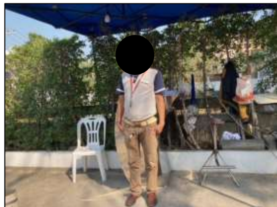
ภาพถ่าย 3-3 เจ้าหน้าที่รักษาความปลอดภัย

ภาพถ่ายแสดงการปฏิบัติตามมาตรการฯ โรงแรมเชรატัน หัวหินรีสอร์ทแอนด์สปา ระหว่างเดือนมกราคม – มิถุนายน พ.ศ.2565