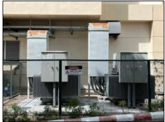
ภาพถ่าย 3-11 หม้อแปลงชนิด Oil Type