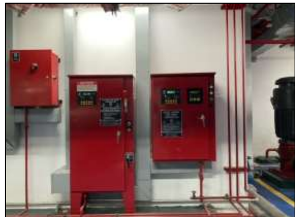
ภาพถ่าย 3-12 ระบบป้องกันและเตือนอัคคีภัย

ภาพถ่ายแสดงการปฏิบัติตามมาตรการฯ โรงแรมเชรატัน หัวหินรีสอร์ทแอนด์สปา ระหว่างเดือนมกราคม – มิถุนายน พ.ศ.2565 (ต่อ)