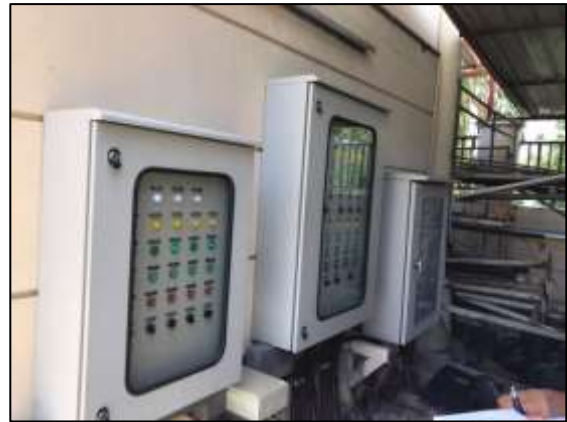
ภาพถ่าย 3-5 ระบบบำบัดน้ำเสียแบบ Activated Sludge