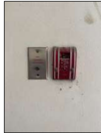
ภาพถ่าย 3-12 ระบบป้องกันและเตือนอัคคีภัย(ต่อ)