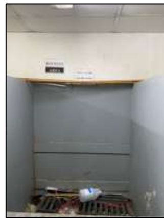
ภาพถ่าย 3-9 ห้องพักขยะ

ภาพถ่ายแสดงการปฏิบัติตามมาตรการฯ โรงแรมเชรატัน หัวหินรีสอร์ทแอนด์สปา ระหว่างเดือนมกราคม – มิถุนายน พ.ศ.2565 (ต่อ)