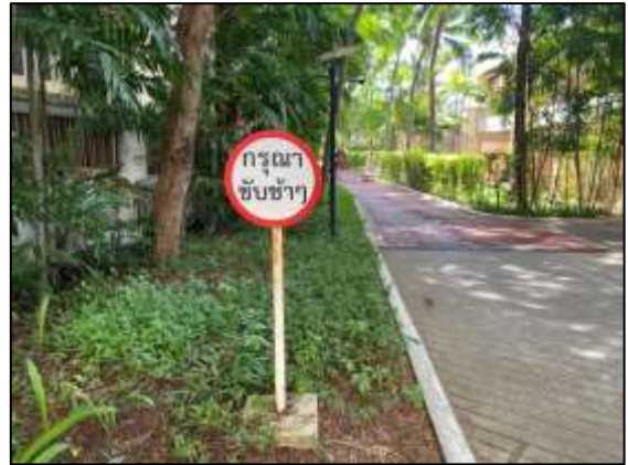
ภาพถ่าย 3-1 ป้ายสัญญาณจราจร