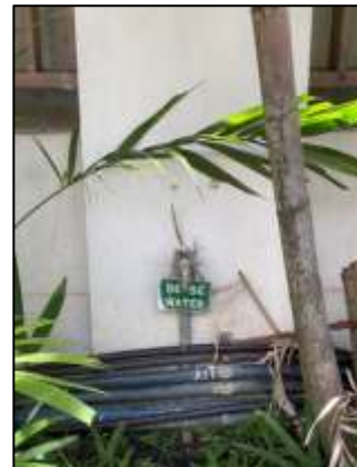
ภาพถ่าย 3-6 การนำน้ำที่ผ่านการบำบัดแล้วมาใช้ประโยชน์