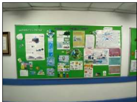
ภาพถ่าย 3-7 บอร์ดประชาสัมพันธ์

ภาพถ่ายแสดงการปฏิบัติตามมาตรการฯ โรงแรมเชรატัน หัวหินรีสอร์ทแอนด์สปา ระหว่างเดือนมกราคม – มิถุนายน พ.ศ.2565 (ต่อ)