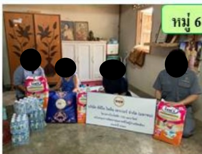
หมู่ 6 บ้านอ่างหิน