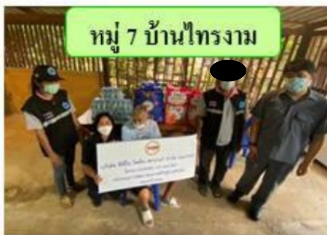
หมู่ 7 บ้านไทรงาม