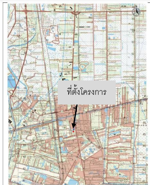
รูปที่ 1-1 ที่ตั้งโครงการ พหลโยธิน 89 เฟส 1