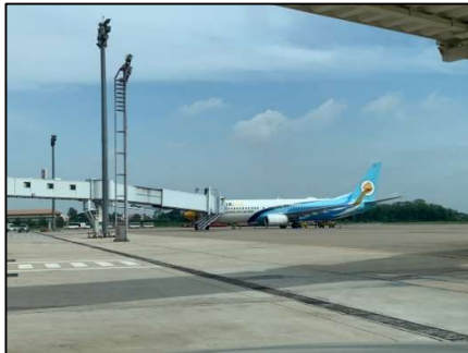
ลานจอดอากาศยาน (Apron)