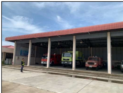
อาคารที่ทำการดับเพลิงและหน่วยกู้ภัย