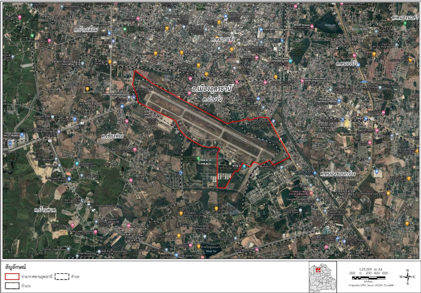
รูปที่ 3.1-1 อาณาเขตติดต่อโดยรอบท่าอากาศยานนานาชาติอุดรธานี