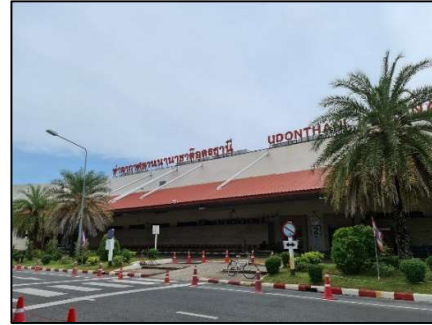
อาคารที่พักผู้โดยสาร