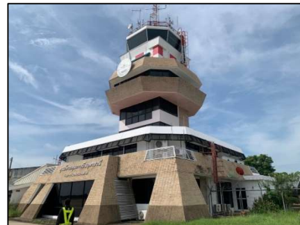
อาคารหอบังคับการบิน