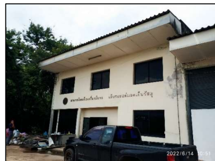
อาคารโรงเก็บเครื่องมือกล