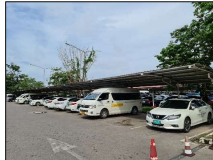
ลานจอดรถยนต์