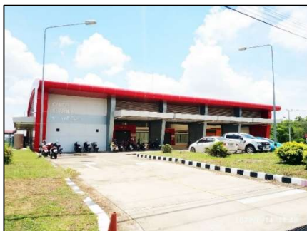
อาคารคลังสินค้า