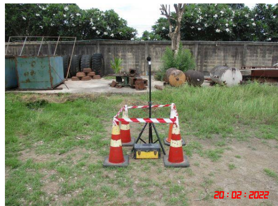
สำนักงานโรงโม่หินของโครงการ