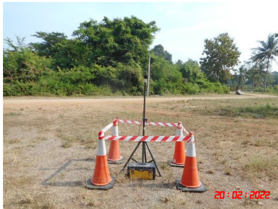
วัดถ้ำยอดทอง