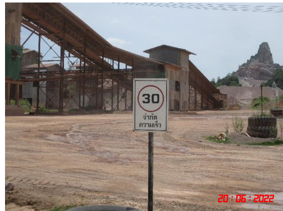
รูปที่ 2-8 การสวมใส่อุปกรณ์ป้องกันอันตรายส่วนบุคคลและป้ายเตือนความปลอดภัย