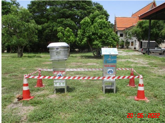
บ้านเขากูป (จุดที่ 2)