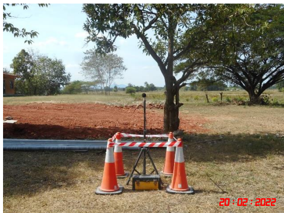
บ้านเขากูป (จุดที่ 2)