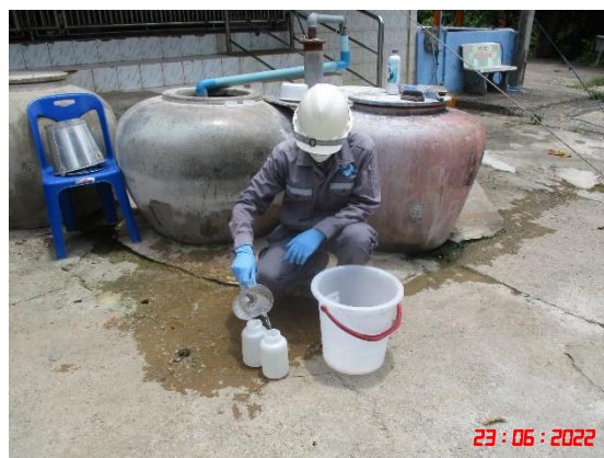
วันที่ 23 มิถุนายน 2565