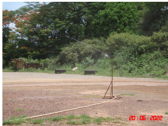
ระบบสเปรย์น้ำภายนอกอาคาร