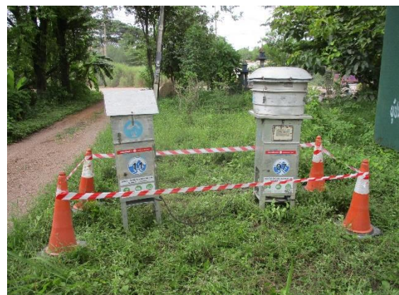
บ้านหนองรีน