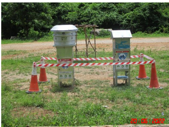
วัดถ้ายอดทอง