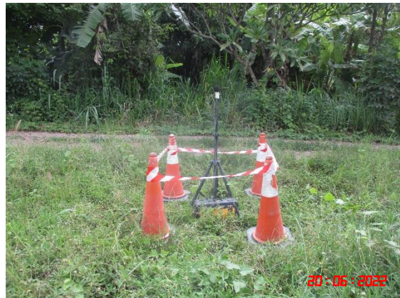
บ้านหนองรี