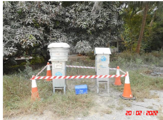
บ้านหนองรีน