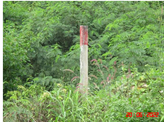
รูปที่ 2-5 ป้ายเตือนเวลาระเบิดหิน