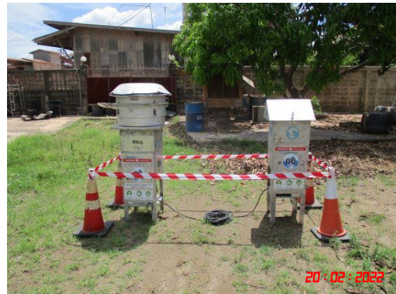
สำนักงานโรงโม่หินของโครงการ