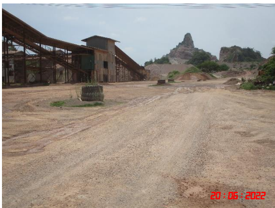
ถนนหินบดอัดแน่น