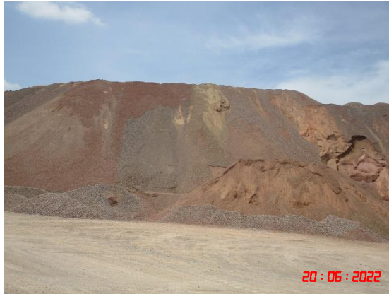
ลานเก็บกองหิน