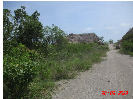
รูปที่ 2-3 บริเวณพื้นที่ที่ยังเดินทางเหมืองไม่ถึง