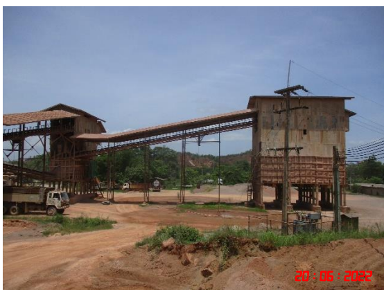
อาคารปิดคลุมโรงโม่หิน