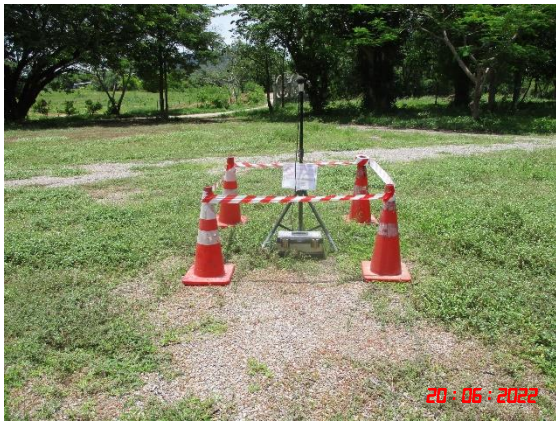
บ้านเขาภูบ (จุดที่ 2)