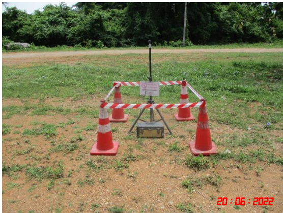
วัดถ้ำยอดทอง