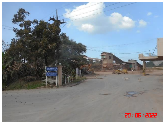
ถนนลาดยาง