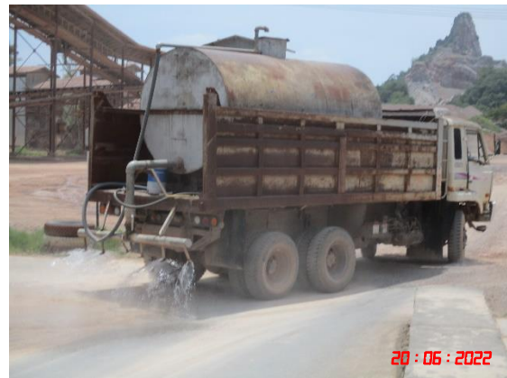
รูปที่ 2-13 ระบบป้องกันผลกระทบสิ่งแวดล้อมบริเวณโรงโม่หิน