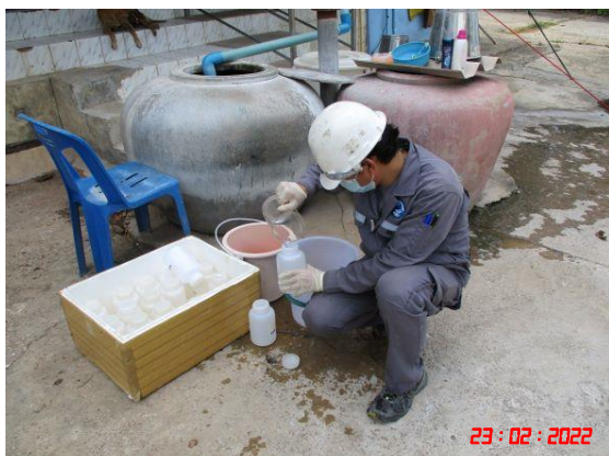
วันที่ 23 กุมภาพันธ์ 2565