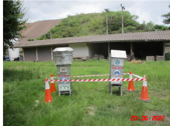
สำนักงานโรงโม่หินของโครงการ