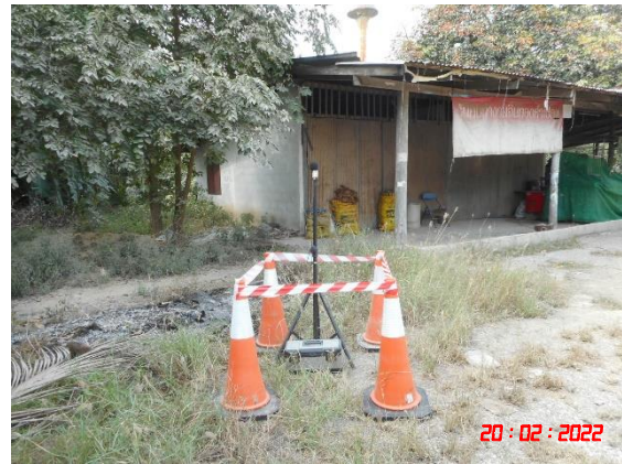
บ้านหนองริน