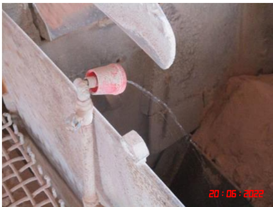
ระบบสเปรย์น้ำภายในอาคาร