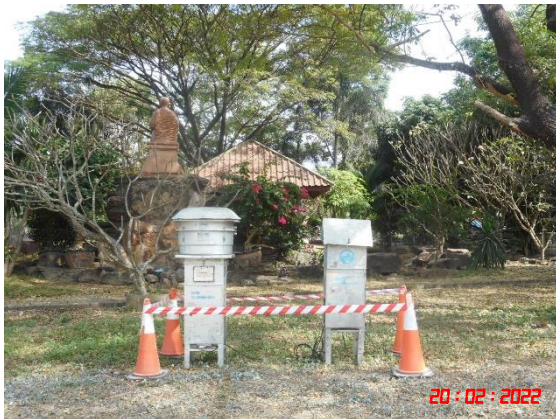
บ้านเขากูป (จุดที่ 2)