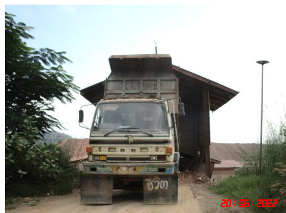
อาคารปิดคลุมยังรับหินใหญ่