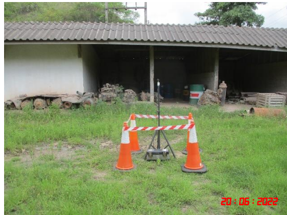
สำนักงานโรงไม้หินของโครงการ