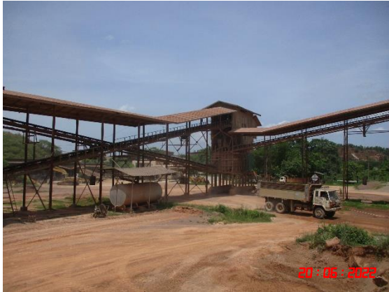
หลังคาปิดคลุมสายพานลำเลียง