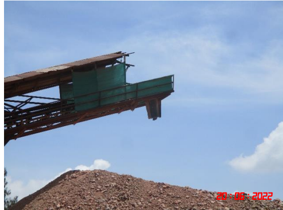
ถุงครอบปลายสายพาน