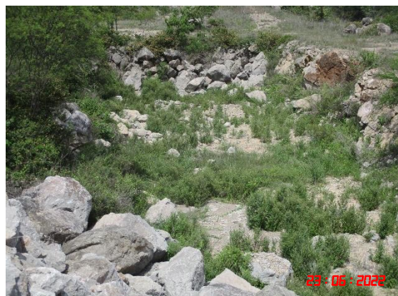
วันที่ 23 มิถุนายน 2565