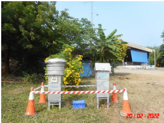
วัดถ้ายอดทอง