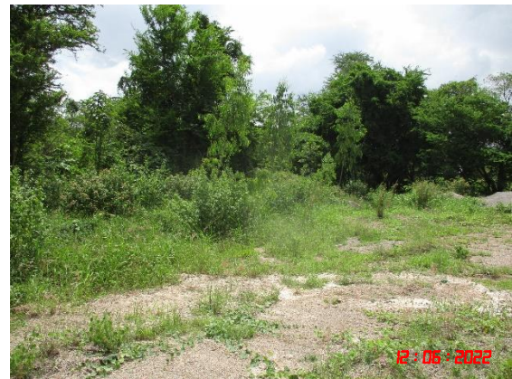
รูปที่ 2-3 หมุดหลักเขตพื้นที่ประทานบัตร