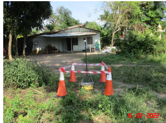
บ้านเขาถ้ำกฤษ