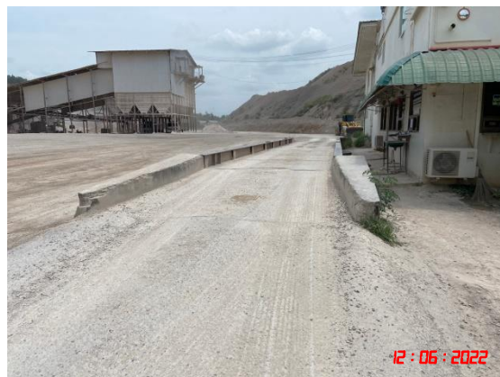
รูปที่ 2-17 ทางหลวงชนบทบ้านห้วยไผ่-บ้านเขาถ้ำกู่จรถึงทางหลวงหมายเลข 3208