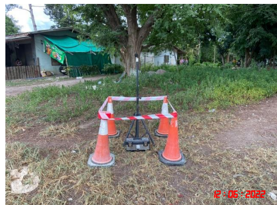
บ้านเขาถ้ำกฤษ