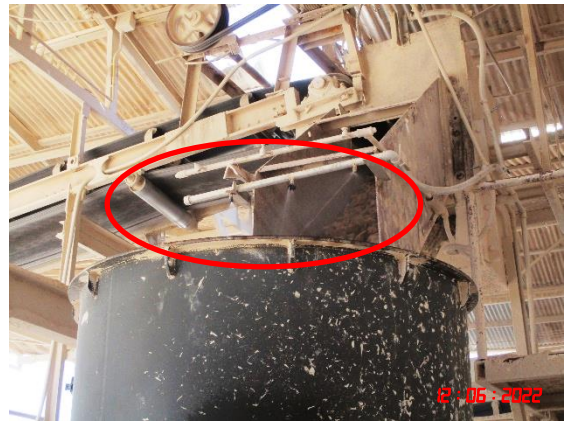
ระบบสเปรย์น้ำ