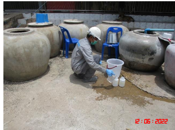
15 มิถุนายน 2565