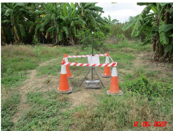
บ้านหนองหญ้าดอก