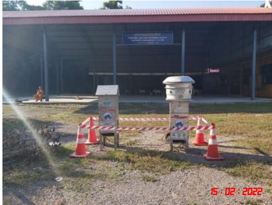
บ้านเขาภูบ