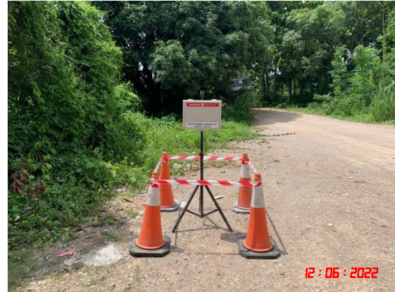
สำนักงานโรงโม่หินอ่างศิลา