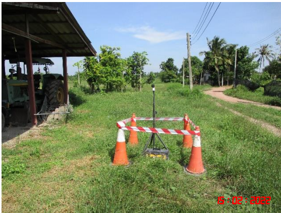
บ้านหนองหญ้าดอก