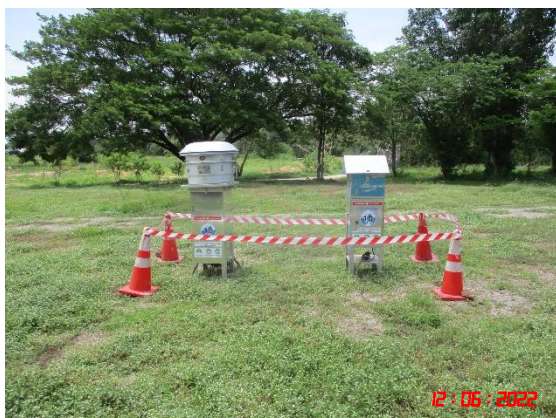
บ้านเขาภูบ