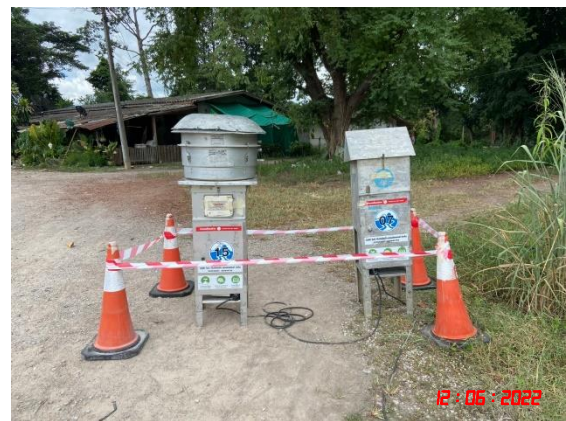
บ้านเขาถ้ำกฤษ