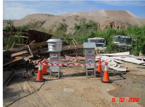
สำนักงานโรงโม่หินอ่างศิลา