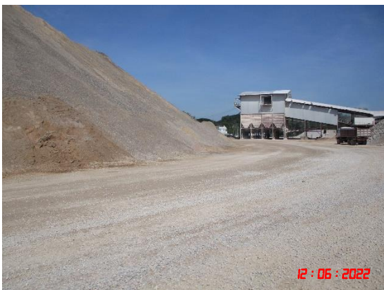
ถนนหินบดอัดแน่นบริเวณโรงโม่หิน