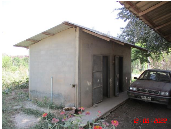
รูปที่ 2-22 บ้านพักพนักงาน