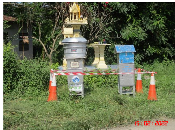
บ้านเขาถ้ำกุ่ม