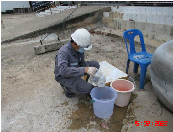
วันที่ 18 กุมภาพันธ์ 2565