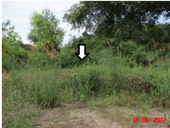
รูปที่ 2-8 ลักษณะหน้าเหมืองของโครงการในปัจจุบัน