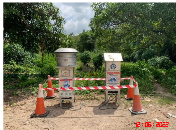
สำนักงานโรงโม่หินอ่างศิลา