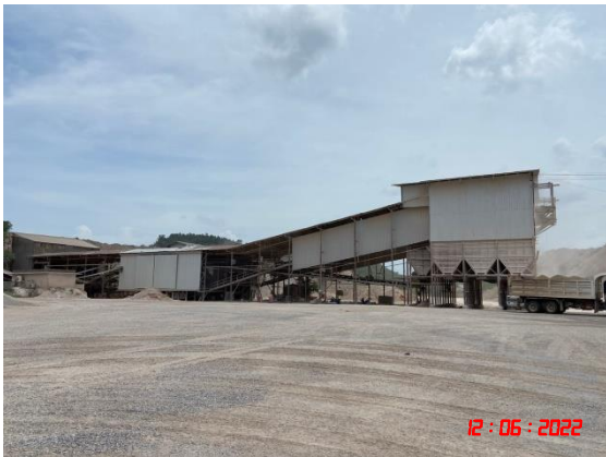
อาคารปิดคลุมโรงโม่หิน