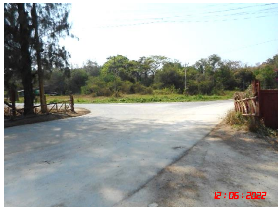
ถนนลาดยางก่อนออกสู่ถนนลาดยางสาธารณะ