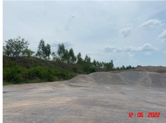
ลานเก็บกองหินที่ทำการไม่บดแล้ว