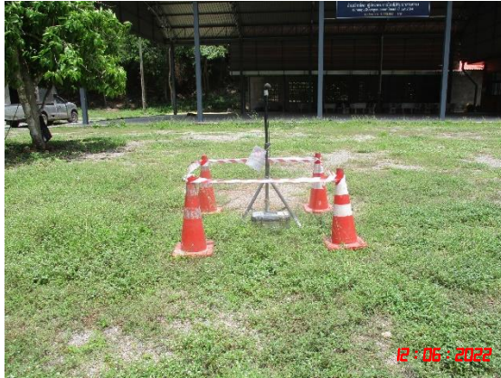
บ้านเขาภูบ