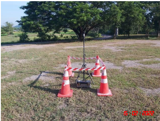
บ้านเขาภูบ