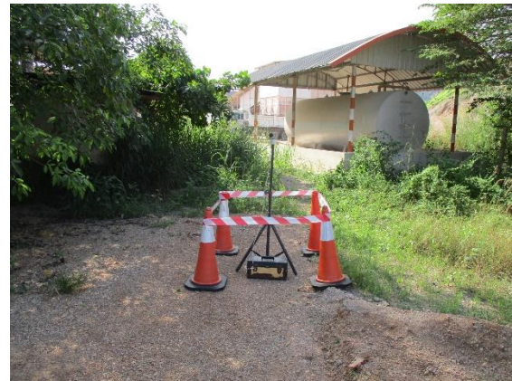
สำนักงานโรงโม่หินอ่างศิลา