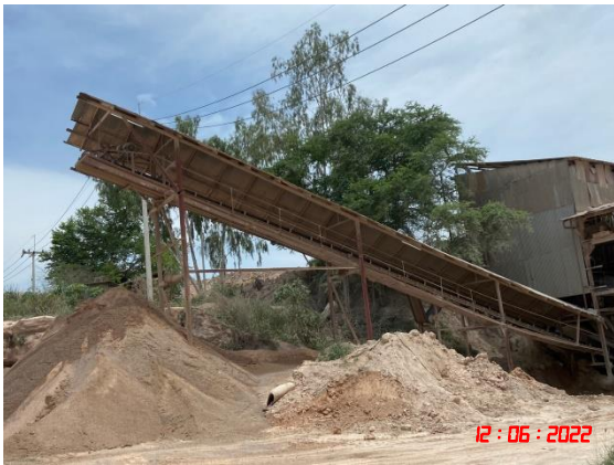
หลังคาปิดคลุมสายพานลำเลียง