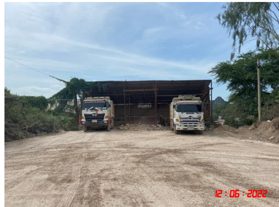
อาคารปิดคลุมยังรับหินใหญ่