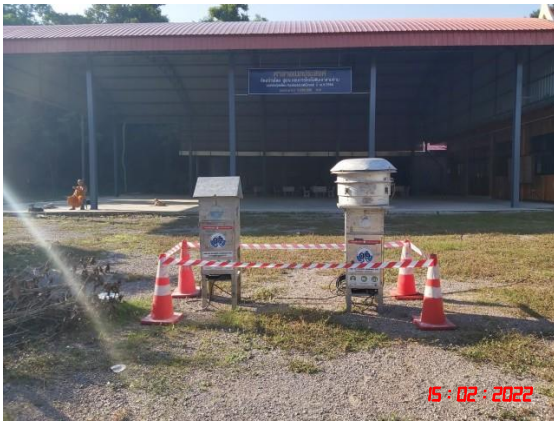
บ้านเขากูป