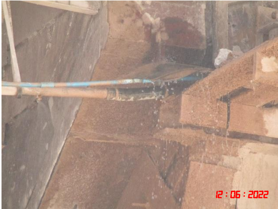
ระบบประปาภายในอาคาร