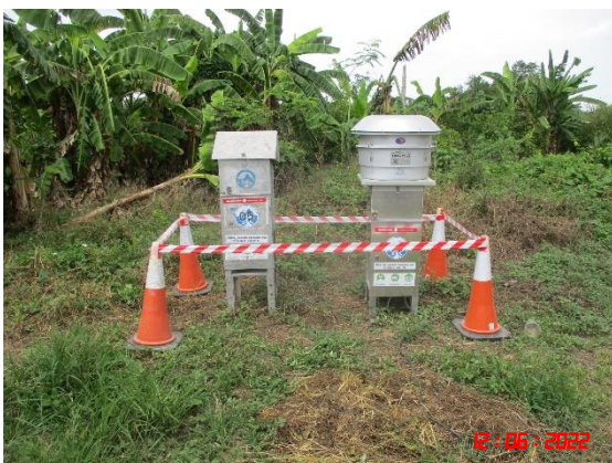
บ้านหนองหว้าดอก