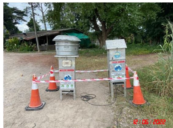
บ้านเขากล้ากฤษ