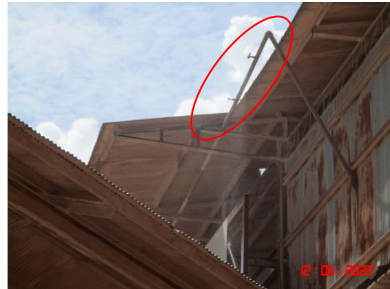
ระบบประปาภายนอกอาคาร