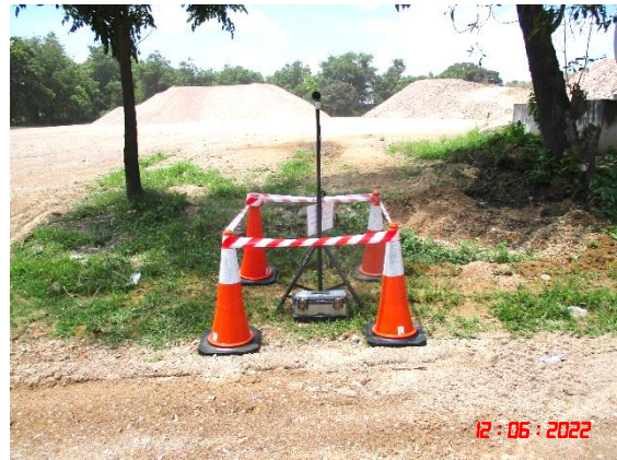
สำนักงานโรงโม่หินศิลาเขางู