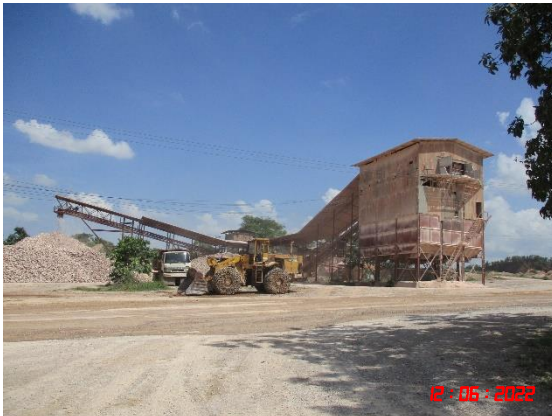
อาคารปิดคลุมโรงโม่หิน