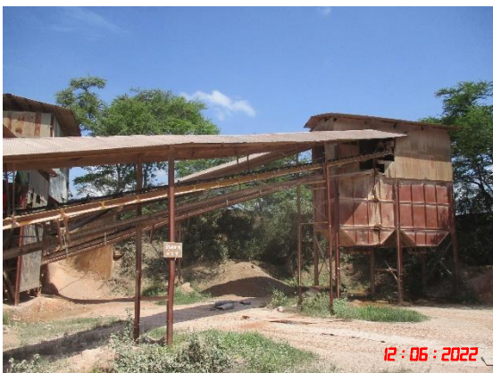
หลังคาปิดคลุมสายพานลำเลียง