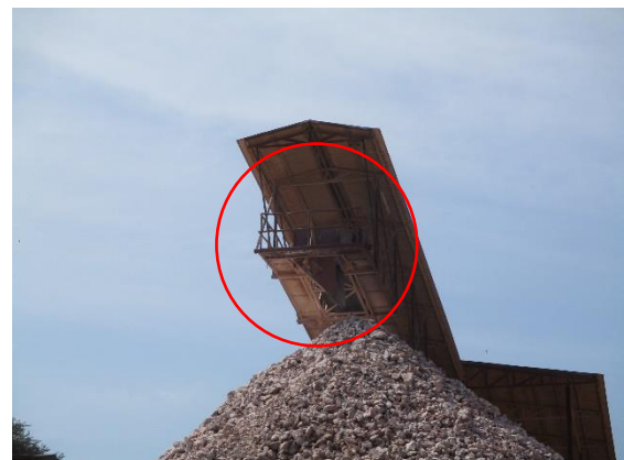
ถุงครอบปลายสายพานลำเลียง