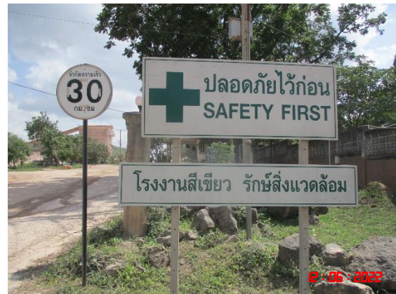
รูปที่ 2-8 ลักษณะหน้าเหมืองของโครงการในปัจจุบัน