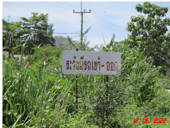
รูปที่ 2-7 การสวมใส่อุปกรณ์ป้องกันอันตรายส่วนบุคคล และป้ายเตือนด้านความปลอดภัย