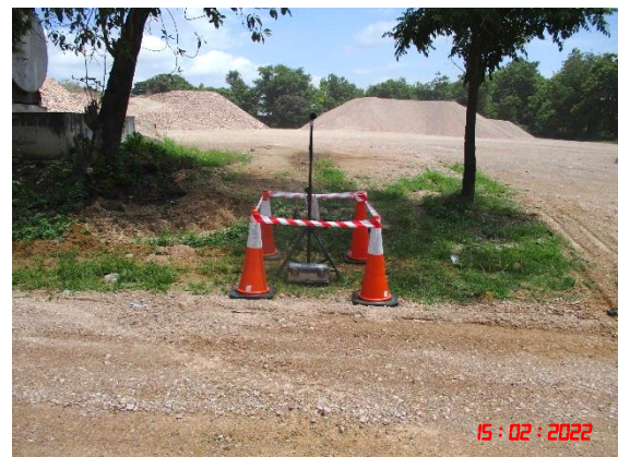
สำนักงานโรงโม่หินศิลาเขางู