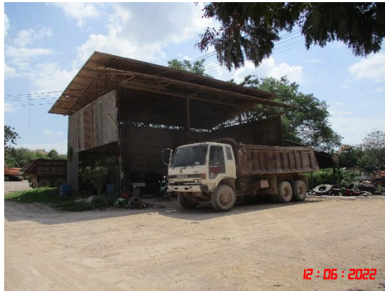
รูปที่ 2-17 จุดซังน้ำหนักรถบรรทุก