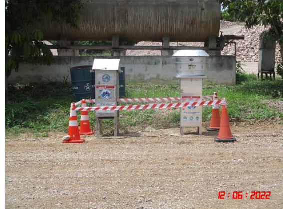
สำนักงานโรงโม่หินศิลาเขางู