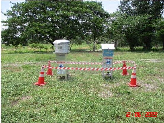
บ้านเขาภูบ