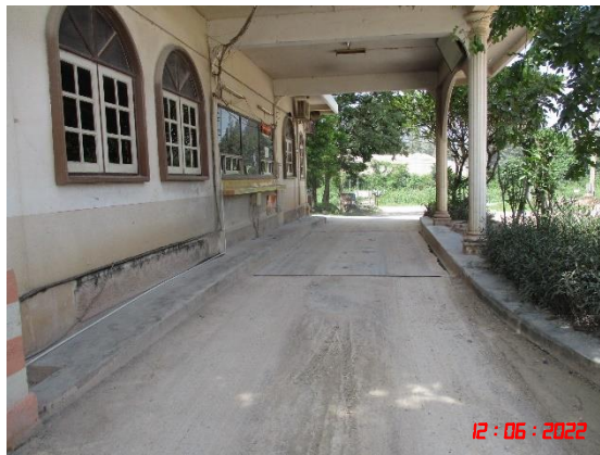
รูปที่ 2-18 ทางหลวงชนบทบ้านห้วยไผ่-บ้านเขาถ้ำกู่จรถึงทางหลวงหมายเลข 3208