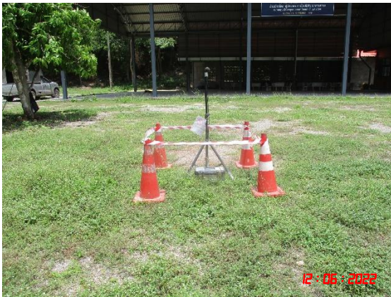
บ้านเขาภู