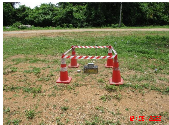
วันที่ 12 มิถุนายน 2565