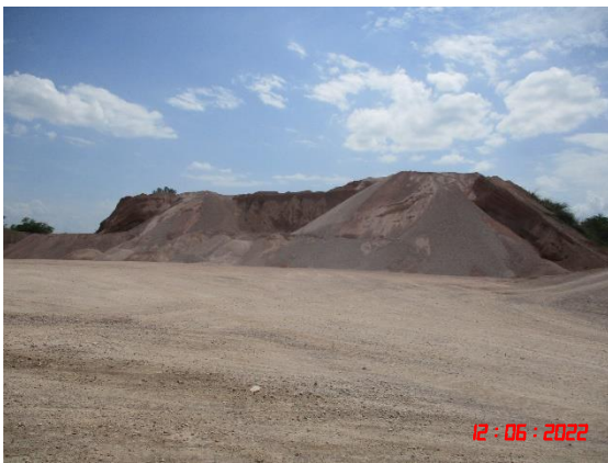
ลานเก็บกองแร่ที่ทำการไม่บดแล้ว