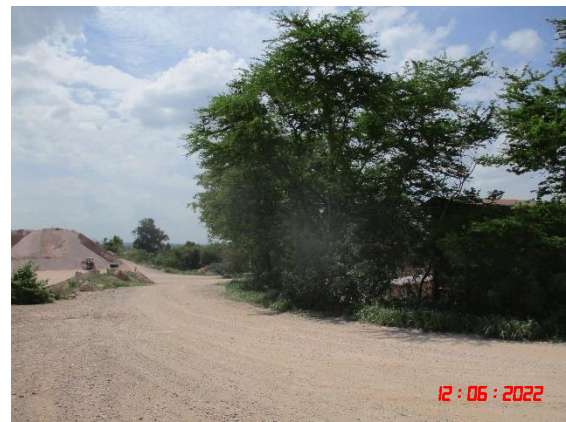
เส้นทางลำเลียงแร่บริเวณโรงโม่หิน