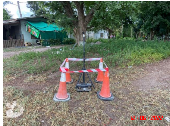
บ้านเขาถ้ำกฤษ