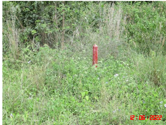
รูปที่ 2-4 ป้ายแสดงแนวเขตและข้อมูลโครงการ