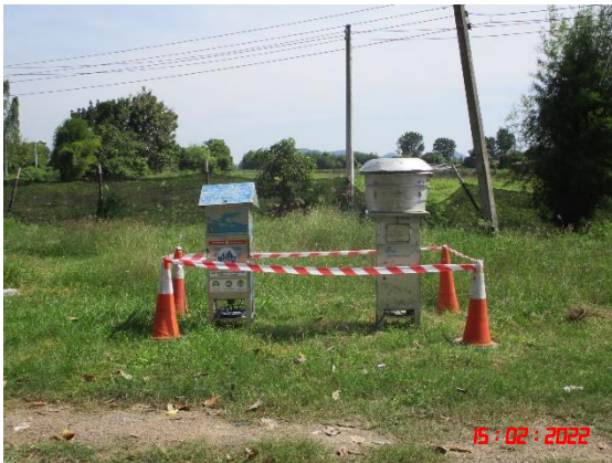
บ้านหนองหว้าดอก