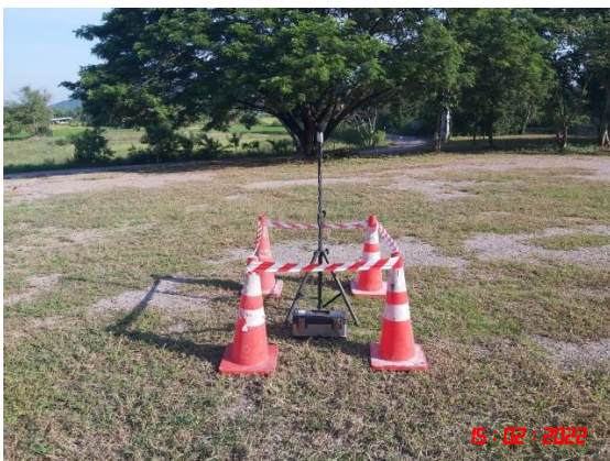
บ้านเขาภูบ