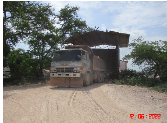
อาคารปิดคลุมย้งรับหินใหญ่