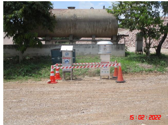
สำนักงานโรงโมหินศิลาเขง