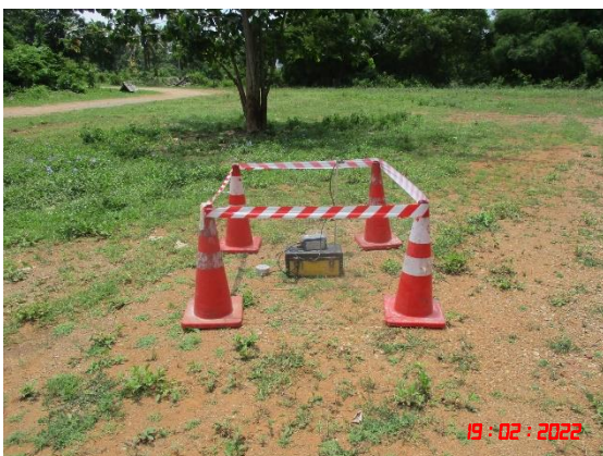
วันที่ 19 กุมภาพันธ์ 2565