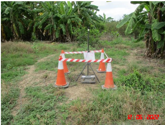
บ้านหนองหญ้าดอก