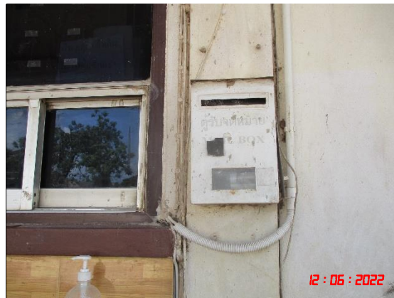
รูปที่ 2-2 บริเวณแนวเวนพื้นที่ทำเหมือง