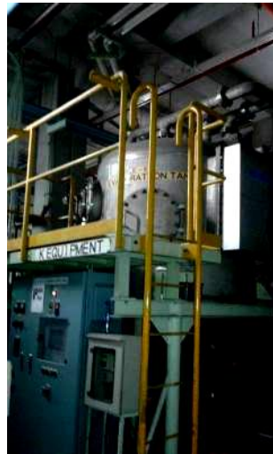
รูปที่ 17 ระบบการนำน้ำนิกเกิลที่ใช้แล้วกลับมาใช้ใหม่ (Recycle Ni)