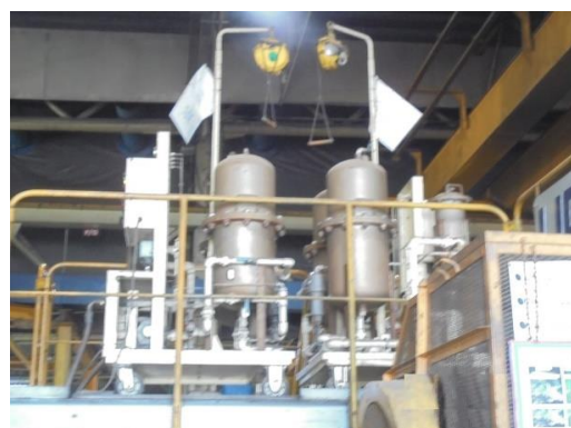
รูปที่ 16 การนำน้ำมันไฮดรอลิกที่ใช้แล้วนำกลับมาใช้ใหม่ (ใส่เครื่องจักร)