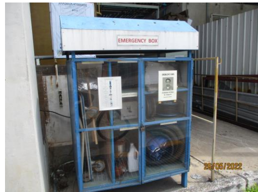
รูปที่ 26 พื้นที่กักเก็บสารเคมีและอุปกรณ์ป้องกันเหตุฉุกเฉิน เช่น ฝักบัวฉุกเฉิน และที่ล้างตาฉุกเฉิน