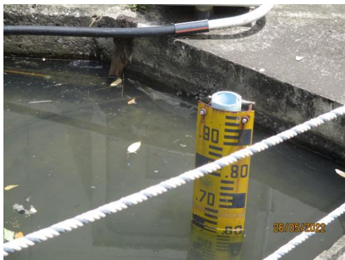
รูปที่ 28 (ต่อ) ระบบป้องกันและระงับอัคคีภัยของโครงการ