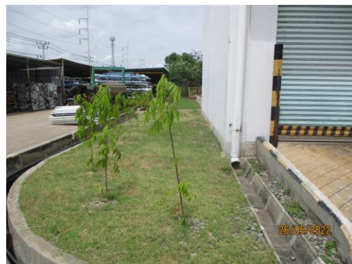
รูปที่ 30 พื้นที่สีเขียวของโครงการ