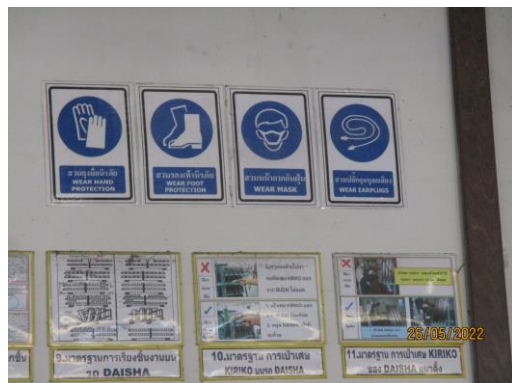
รูปที่ 7 ป้ายเตือนบริเวณที่มีเสียงดังและป้ายแสดงการจัดทำโครงการอนุรักษ์การได้ยิน