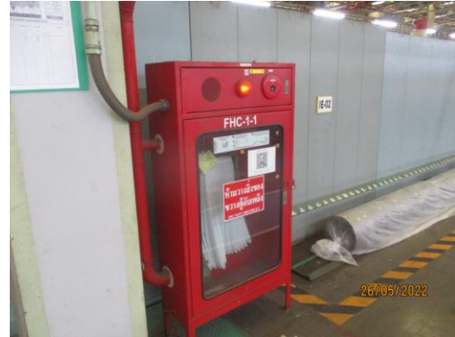
ตู้เก็บสายฉีดน้ำดับเพลิง