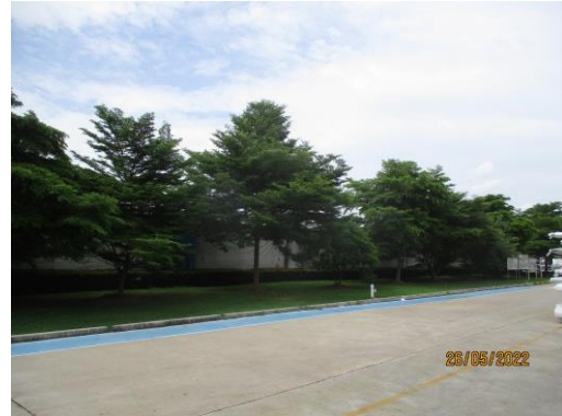
รูปที่ 30 (ต่อ) พื้นที่สีเขียวของโครงการ