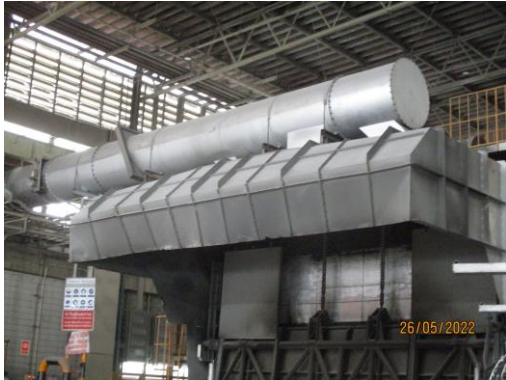
Hood ดูดอากาศบริเวณหน้าเตาหลอม