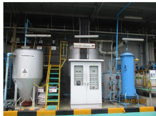
รูปที่ 11 ระบบบำบัดน้ำเสียของโครงการ