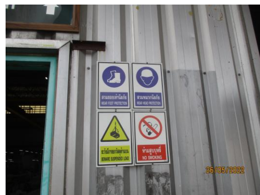
รูปที่ 24 ป้ายเตือนด้านความปลอดภัยต่างๆ ในพื้นที่ปฏิบัติงาน