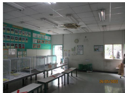
รูปที่ 27 ป้ายเตือนบริเวณแหล่งกำเนิดความร้อน การจัดเตรียมห้องพักและน้ำดื่ม