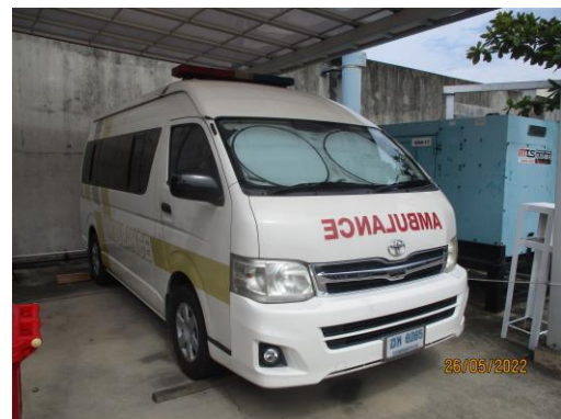
รูปที่ 25 ห้องพยาบาลและรถพยาบาลรับ-ส่งผู้ป่วยของโครงการ