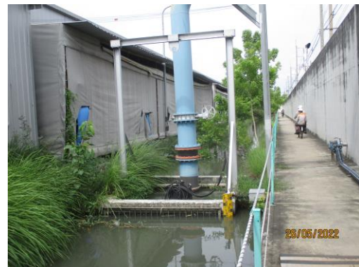
รูปที่ 29 ป้ายแสดงระดับน้ำบ่งชี้การป้องกันน้ำท่วม