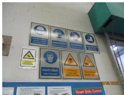
รูปที่ 24 (ต่อ) ป้ายเตือนด้านความปลอดภัยต่างๆ ในพื้นที่ปฏิบัติงาน