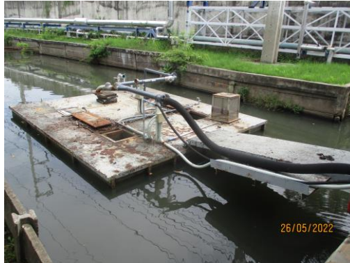
บ่อน้ำดับเพลิงสำรองฉุกเฉิน