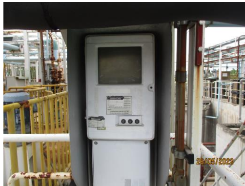
รูปที่ 13 การติดตั้ง COD Online บริเวณระบบบำบัดน้ำเสีย