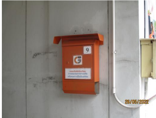
รูปที่ 23 ตู้รับเรื่องร้องเรียนของโครงการ