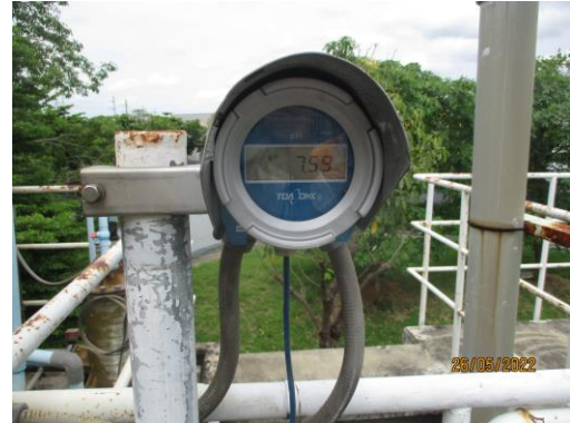
รูปที่ 12 การติดตั้ง pH Online บริเวณระบบบำบัดน้ำเสีย