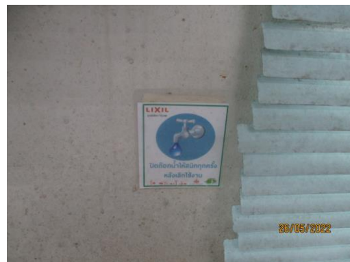
รูปที่ 18 การรณรงค์การประหยัดพลังงานของโครงการ