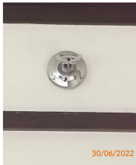
หัวกระจายน้ำดับเพลิงในห้องพัก