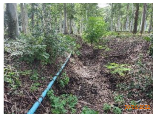
รูปที่ 2-9 รางระบายน้ำฝน