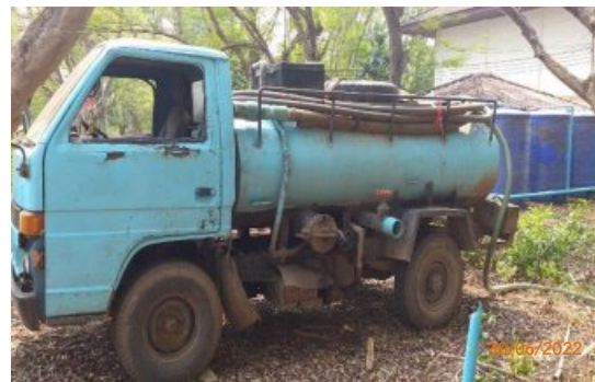
รูปที่ 2-7 การฉีดพ่นน้ำจากบ่อดักไขมัน