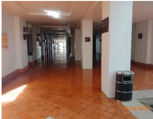
รูปที่ 2-4 ถังขยะในพื้นที่โครงการ