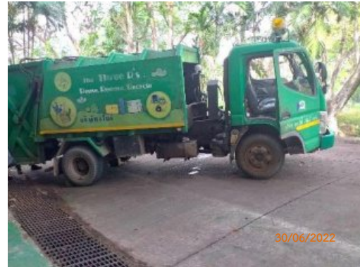
รูปที่ 2-5 รถรับขยะมูลฝอยไปกำจัด