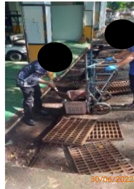
รูปที่ 2-10 การลอกท่อระบายน้ำ