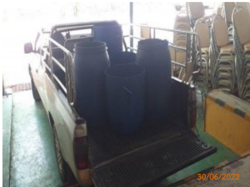
รูปที่ 2-6 เกษตรกรมารับมูลฝอยสด