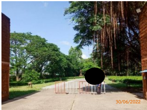
เจ้าหน้าที่รักษาความปลอดภัยด้านหน้าทางเข้าโครงการ