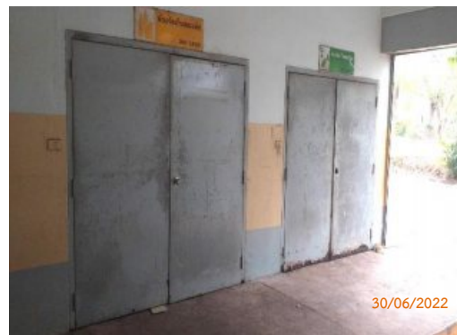
รูปที่ 2-3 ห้องพักขยะมูลฝอยรวม