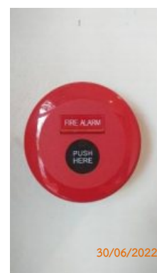
Manual Call Point