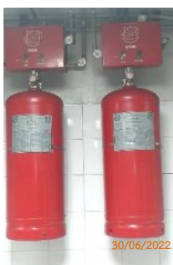
ถังดับเพลิงเคมี