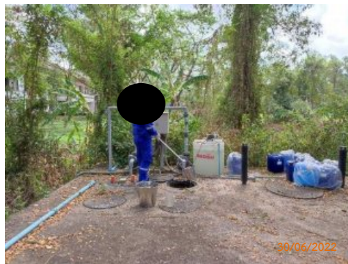
ระบบบำบัดน้ำเสียชุดที่ 3