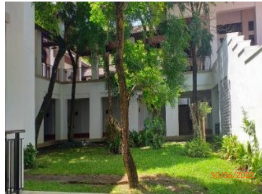
รูปที่ 2-15 (ต่อ) พื้นที่สีเขียว และสภาพแวดล้อมของโครงการ