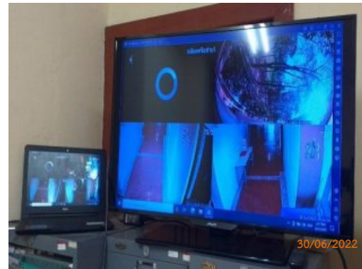
จอมอนิเตอร์กล้องวงจรปิด