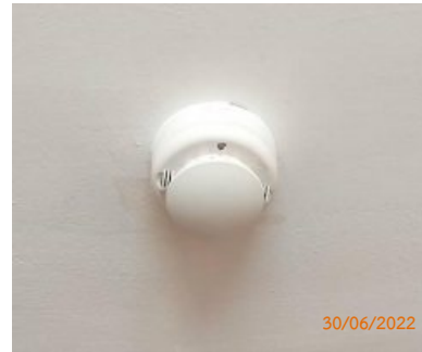
เครื่องตรวจจับควัน (Smoke Detector)