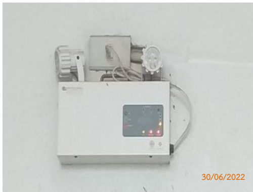
ไฟส่องสว่างฉุกเฉิน