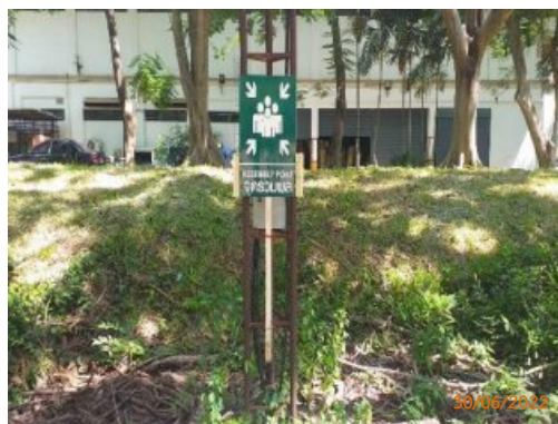
รูปที่ 2-12 จุดรวมพลของโครงการ