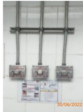
เครื่องตรวจจับแก๊ส (Gas Leak Detector)