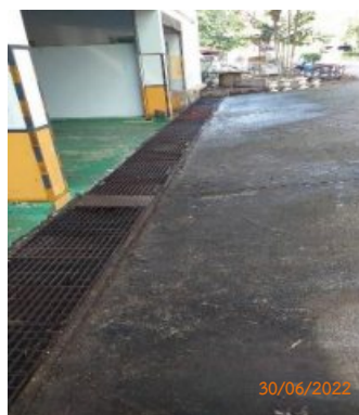
รูปที่ 2-8 ตะแกรงดักมูลฝอย บริเวณจุดระบายน้ำ เข้าสู่ท่อระบายของโครงการ