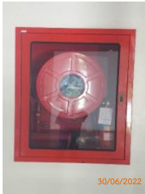
ตู้ดับเพลิง