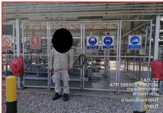
ภายในสถานีควบคุมความดันและวัดปริมาณก๊าซ