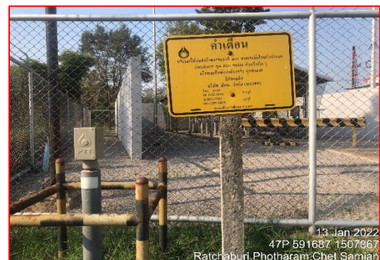
ป้ายเตือนแสดงแนวทอส่งก๊าซ

ภาพที่ 3.2-5 ภาพถ่ายระบบรักษาความปลอดภัยบริเวณสถานีก๊าซและโครงการทอส่งก๊าซธรรมชาติ ภายในนิคมอุตสาหกรรมราชบุรี (เฉพาะแนววางท่อไปยังบริษัท ไคฮาระ (ประเทศไทย) จำกัด)