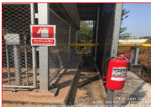
การติดตั้งถังดับเพลิงสถานีควบคุมก๊าซ