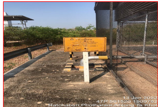
ป้ายเตือนแสดงแนวทอส่งก๊าซ