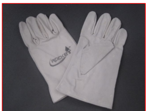
ภาพที่ 3.2-10 ภาพถ่ายอุปกรณ์ป้องกันอันตรายส่วนบุคคล ภายในส่วนปฏิบัติการระบบท่อเขต 5 (ปท.5)