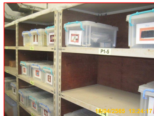
ภาพที่ 3.2-8 ภาพถ่ายการจัดเก็บเครื่องมือ/อุปกรณ์ภายในส่วนปฏิบัติการระบบท่อเขต 5 (ปท.5)