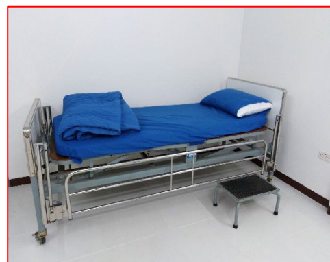
ภาพที่ 3.2-9 ภาพถ่ายอุปกรณ์ปฐมพยาบาลภายในส่วนปฏิบัติการระบบทอเขต 5 (ปท.5)