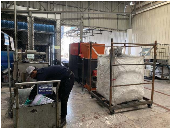
ภาพที่ 25 การนำของเสียจากการผลิตกลับมาใช้ใหม่