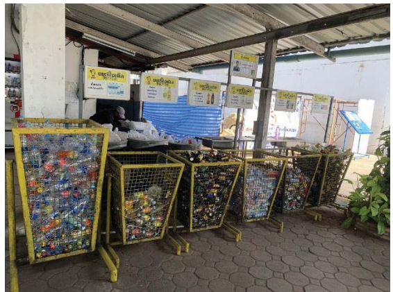
ภาพที่ 22 โครงการรีไซเคิลขยะ