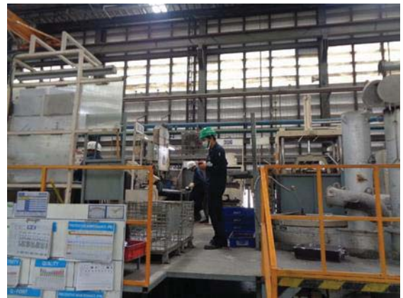
ภพที่ 51 หัพน้งำนคุมภยในส่วภกรผลึต