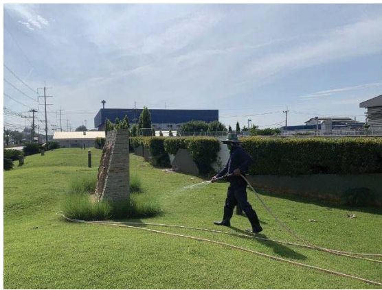
ภาพที่ 15 การนำน้ำ Reject จากระบบ RO ไปรดน้ำต้นไม้หรือล้างพื้น