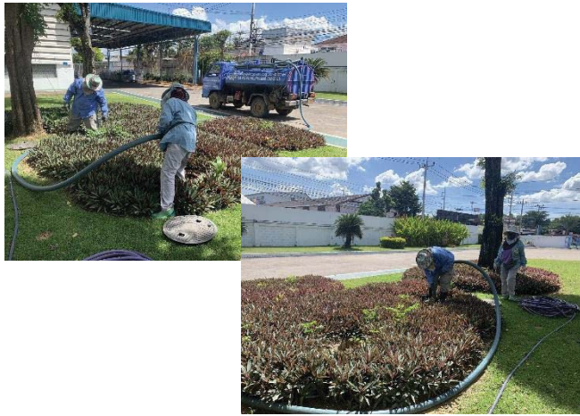
ภาพที่ 13 การดูแลทำความสะอาด ถังบำบัดน้ำเสียสำเร็จรูป