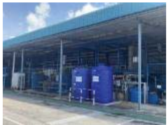
ภาพที่ 12 ระบบบำบัดน้ำเสีย