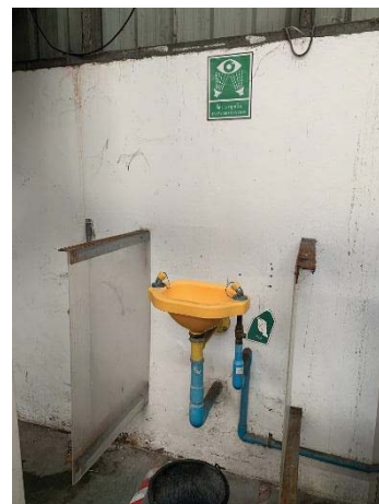
ภาพที่ 36 ฝักบัวและอ่างล้างตา