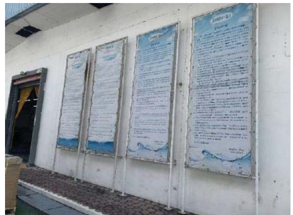
ภาพที่ 28 นโยบายด้านความปลอดภัยและสิ่งแวดล้อม