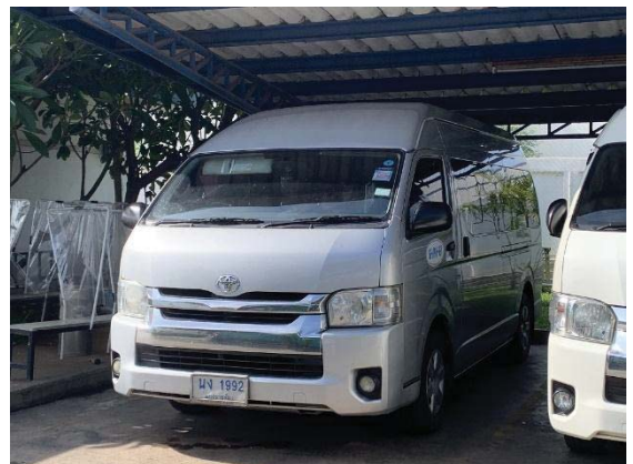
ภาพที่ 58 รถฉุกเฉิน