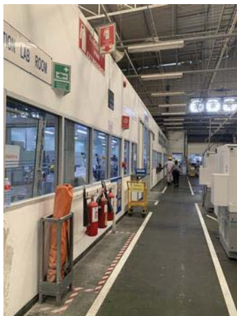
ภาพที่ 35 อุปกรณ์ฉุกเฉินในอาคารส่วนการผลิต