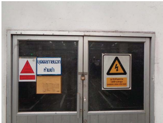
ภพที่ 48 ป่ยเตอนอณรยภคไฟฟ้