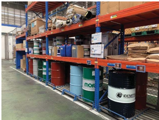
ภพที่ 50 ภกรเกบแภภสธรเคมึ