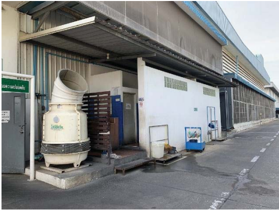
ภาพที่ 31 ห้องสุขา