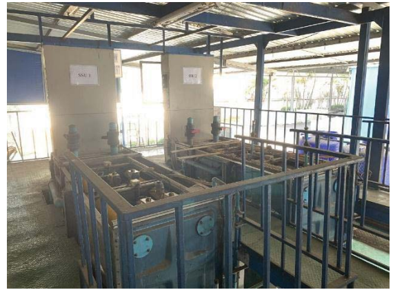
ภาพที่ 8 ระบบบำบัดน้ำเสียทางเคมี