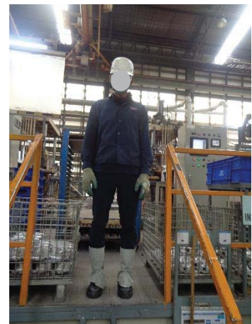
ภาพที่ 45 ชุดทำงานของพนักงานในแต่ละพื้นที่ เพื่อป้องกันอันตรายต่อผิวหนัง