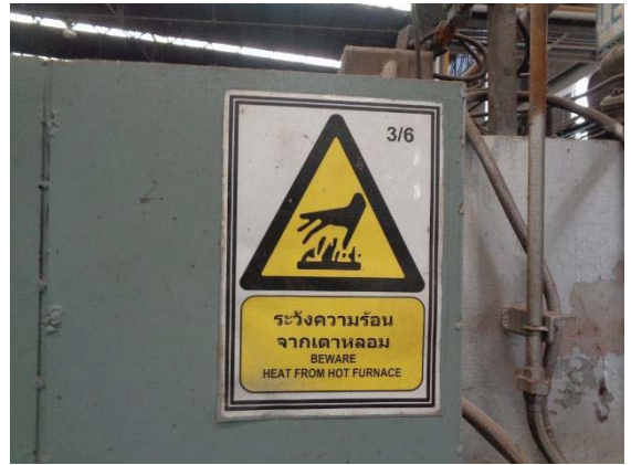
ภาพที่ 38 ป้ายเตือนพื้นที่ความร้อนสูง