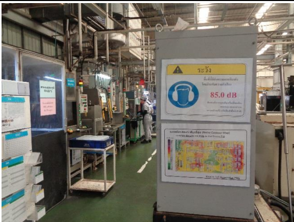
ภาพที่ 5 ป้ายเตือนพื้นที่/เครื่องจักรที่มีเสียงดัง