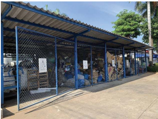
ภาพที่ 23 พื้นที่เก็บของเสีย