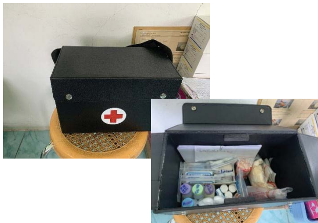
ภาพที่ 57 อุปกรณ์ปฐมพยาบาลเบื้องต้น