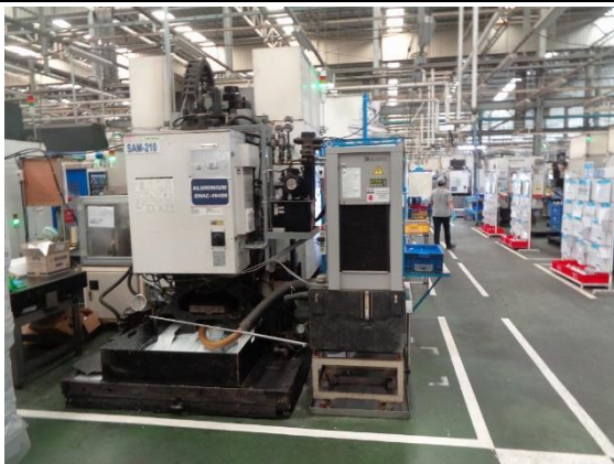
ภาพที่ 3 เครื่องจักร/อุปกรณ์ที่เสียงดังที่ติดตั้งในโรงงาน