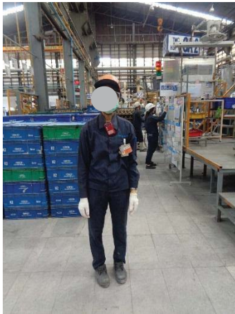
ภาพที่ 43 พนักงานสวมใส่อุปกรณ์ป้องกันฝุ่น