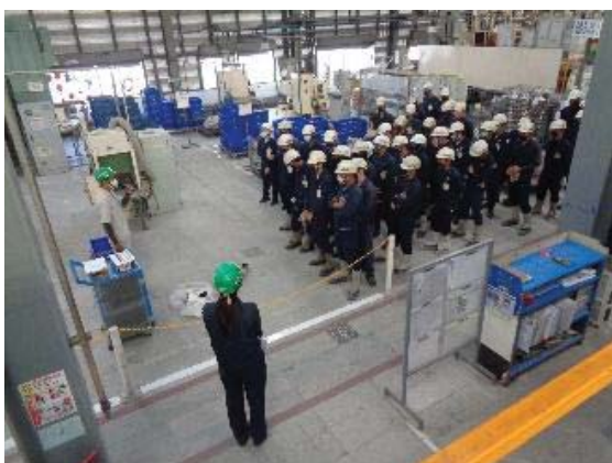
ภาพที่ 29 การฝึกอบรมในการใช้เครื่องมือ ปฏิบัติงานอย่างถูกต้อง