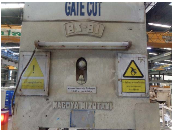
ภาพที่ 33 ป้ายเตือนบริเวณที่เสี่ยงอันตราย