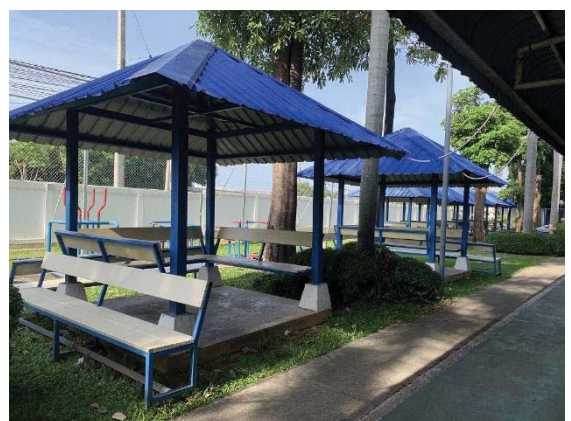
ภาพที่ 30 พื้นที่พักผ่อนของพนักงาน