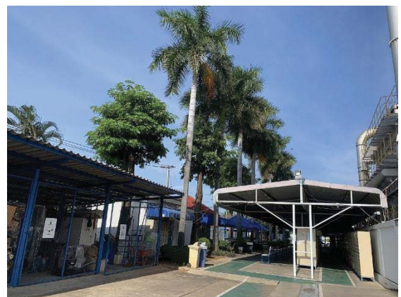
ภพที่ 53 ฟ้นที่สึเชยว