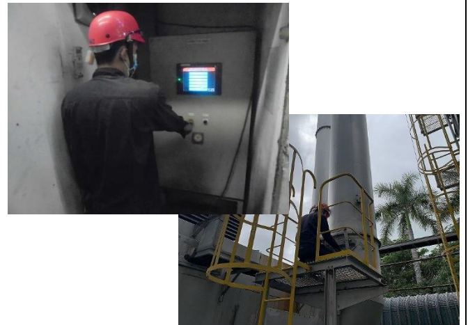
ภาพที่ 2 การจัดเตรียมอุปกรณ์และ อะไหล่ของระบบบำบัดมลพิษทางอากาศ