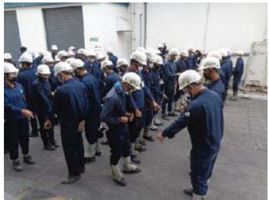
ภาพที่ 32 การตรวจสอบความปลอดภัยประจำวัน