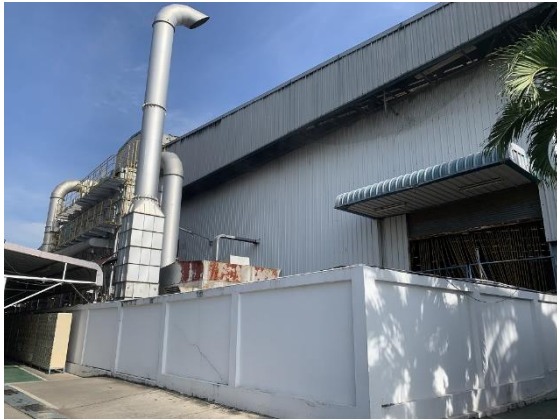
ภาพที่ 1 ระบบดักฝุ่นแบบถุงกรองฝุ่น (Bag house Stack)