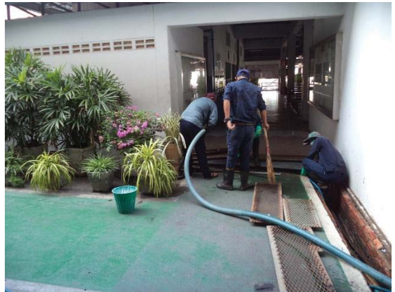
ภาพที่ 20 เจ้าหน้าที่ตรวจสอบและดูแลระบบระบายน้ำฝน