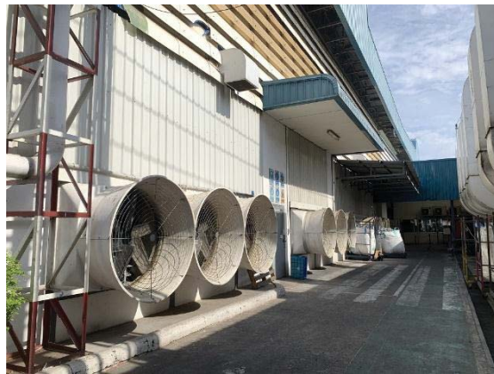
ภาพที่ 39 ระบบระบายอากาศในอาคารผลิต