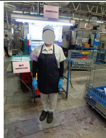
ภาพที่ 6 พนักงานสวมใส่อุปกรณ์ป้องกัน อันตรายส่วนบุคคล