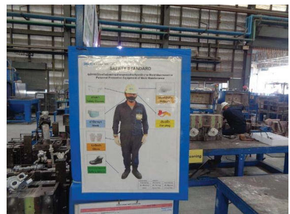
ภาพที่ 42 ป้ายข้อบังคับสวมใส่อุปกรณ์ป้องกันอันตรายส่วนบุคคล