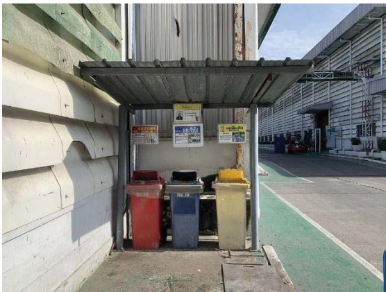
ภาพที่ 21 ถังขยะแต่ละประเภท