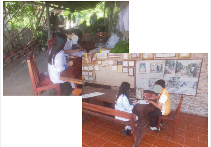
ภาพที่ 26 การประชาสัมพันธ์โครงการให้ประชาชนทราบ