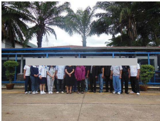
ภาพที่ 27 เจ้าหน้าที่/คณะกรรมการ ที่ตรวจสอบและแก้ไขปัญหาร้องเรียน