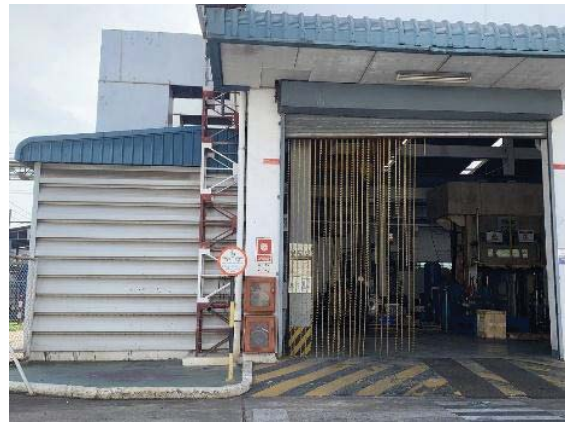
ภาพที่ 54 อุปกรณ์ป้องกันอัคคีภัยภายนอกอาคาร