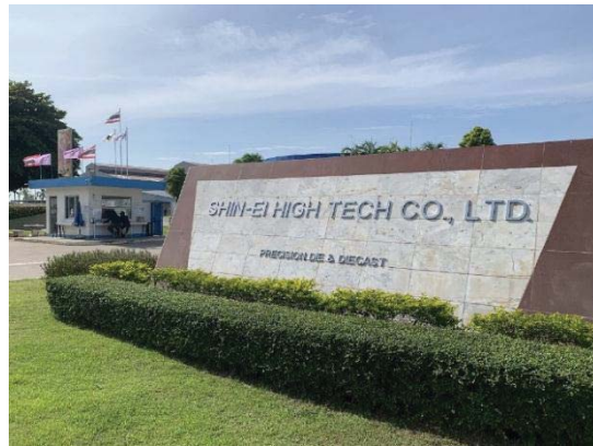
2.ภาพถ่ายป้ายชื่อโรงงาน