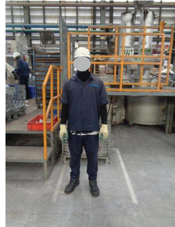
ภาพที่ 44 การสวมใส่ถุงมือและปกแขนป้องกันความร้อน