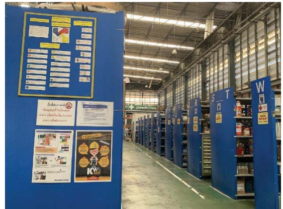
ภพที่ 49 ป่ยเตอนอณรยภคสธรเคมึ