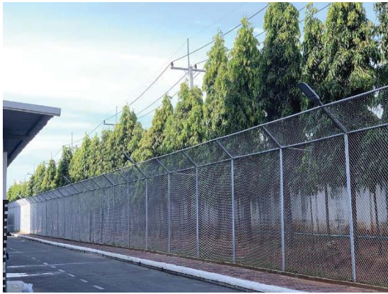
ภาพที่ 7 ต้นไม้ที่เป็นแนวกันเสียงรอบโครงการ