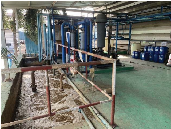
ภาพที่ 9 ระบบบำบัดน้ำเสียทางชีวภาพแบบตะกอนเร่ง