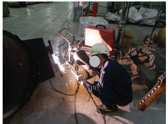
ภาพที่ 40 พนักงานสวมใส่แว่นตาหรือ กระบังหน้าลดแสงหรือรังสีความร้อน