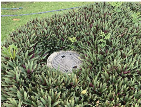
ภาพที่ 11 ถังบำบัดน้ำเสียสำเร็จรูป