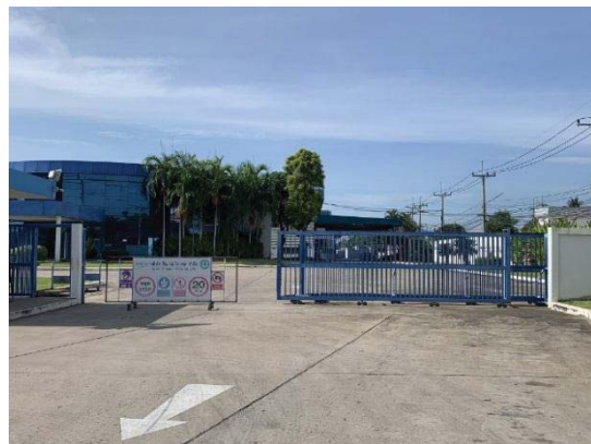
3.ทางเข้า-ออก ด้านหน้าโรงงาน