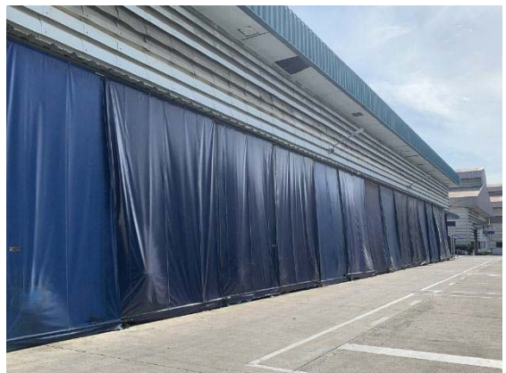
ภาพที่ 24 พื้นที่เก็บกากอลูมิเนียมที่มีหลังคาปิด