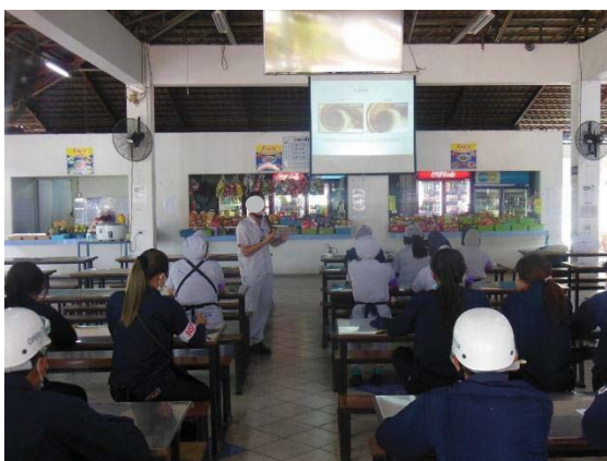
ภาพที่ 41 การฝึกอบรมการเกี่ยวกับอันตรายจากเสียง