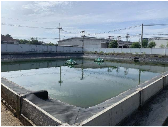
ภาพที่ 19 บ่อหนองน้ำ