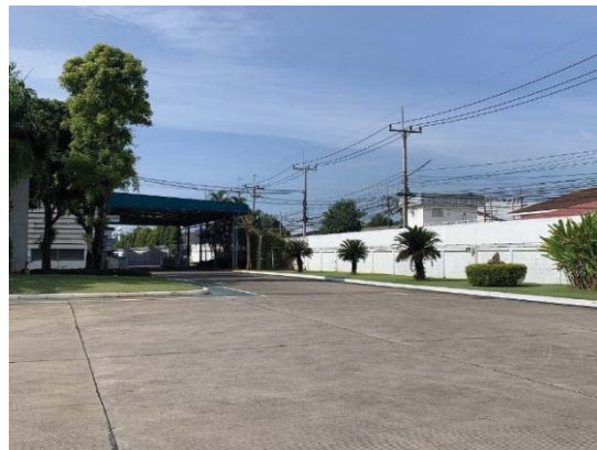
1.ภาพถ่ายพื้นที่โรงงาน