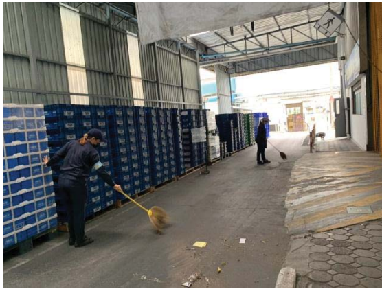
ภาพที่ 37 การทำความสะอาดพื้นที่ปฏิบัติงานก่อนเริ่มงาน