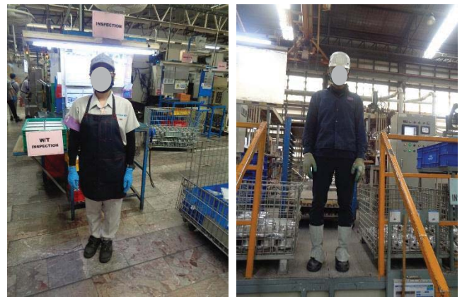
ภาพที่ 34 อุปกรณ์ป้องกันอันตรายส่วนบุคคล