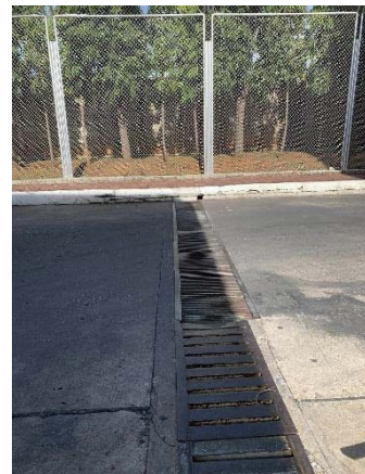
ภาพที่ 18 รางระบายน้ำฝน