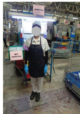
ภาพที่ 47 พนักงานสวมใส่อุปกรณ์ป้องกันวัสดุเข้าตา