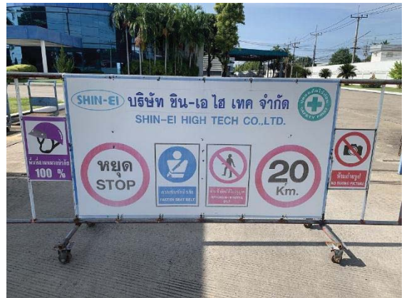
ภาพที่ 16 ป้ายจำกัดความเร็ว