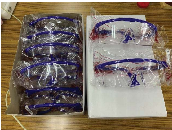
ภาพที่ 46 ที่ป้องกันเศษวัสดุกระเด็นเข้าตา