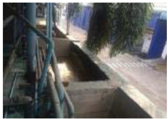
ภาพที่ 10 บ่อพักน้ำทิ้ง