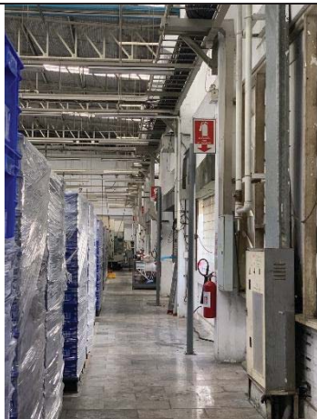
ภพที่ 52 อุปกรณ์ป้องกันอค์ภยภยในอศกร