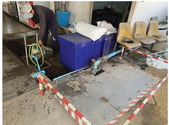
ภาพที่ 14 ถังดักไขมัน