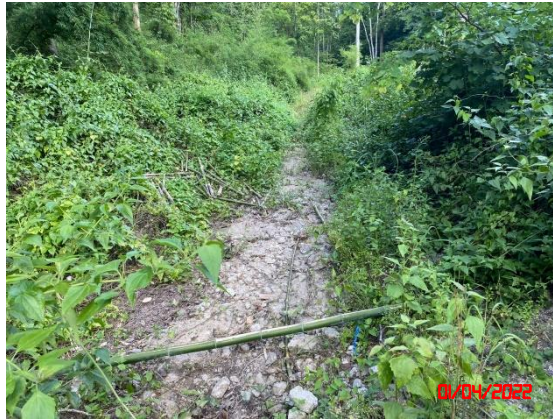
น้ำสาขาห้วยแม่กระบาล (หลังจากผ่านพื้นที่โครงการไปแล้ว)