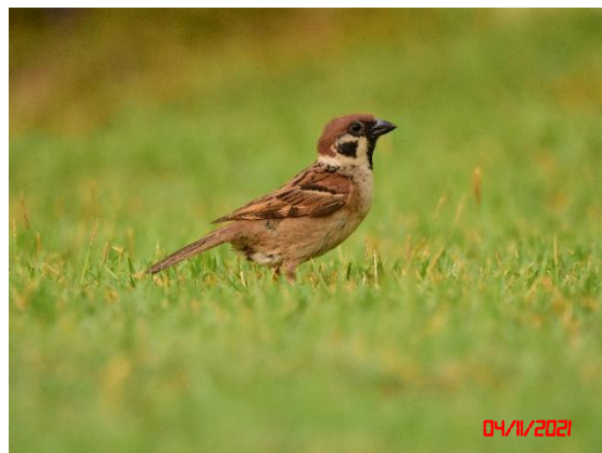
นกกระจอกบ้าน ( Passer montanus )