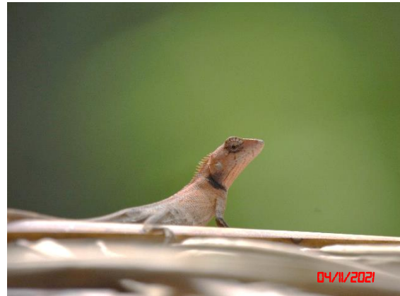
กิ้งก่าแก้ว ( Calotes emma )