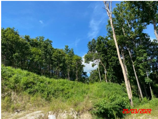
รูปที่ 2-1 แนวต้นไม้บริเวณพื้นที่เวนไม่ทำเหมือง