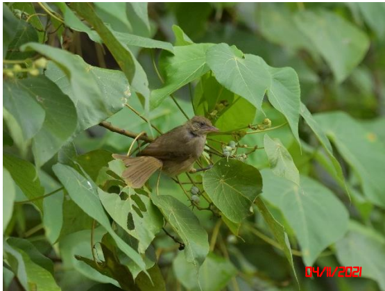
นกปรอดสวน ( Pycnonotus blanfordi )