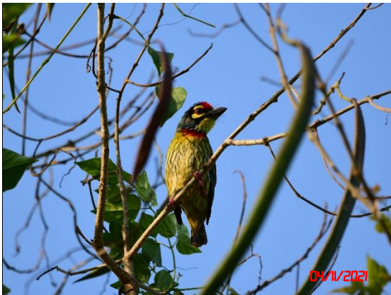
นกตีทอง ( Megalaima haemacephala )