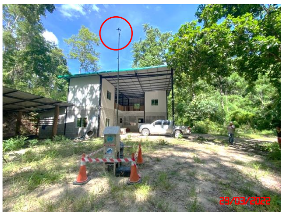
รูปที่ 2-13 การตรวจวัดทิศทางและความเร็วลม ระหว่างวันที่ 29 มีนาคม – 1 เมษายน 2565