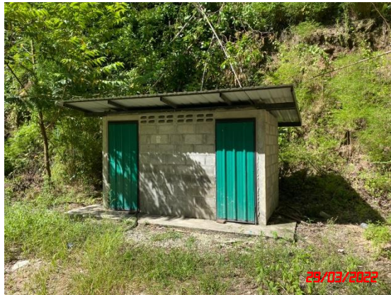
รูปที่ 2-12 การตรวจวัดคุณภาพอากาศ ระหว่างวันที่ 29 มีนาคม – 1 เมษายน 2565