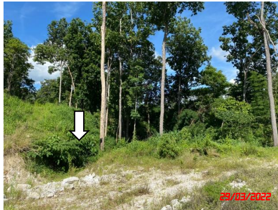
รูปที่ 2-4 บ่อดักตะกอน