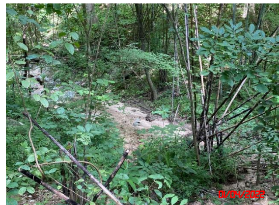
น้ำสาขาห้วยแม่กระบาล (ในเขตพื้นที่โครงการช่วงก่อนไหลผ่านออกจากพื้นที่โครงการ)