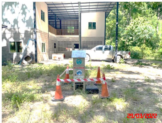
สำนักงานโครงการ