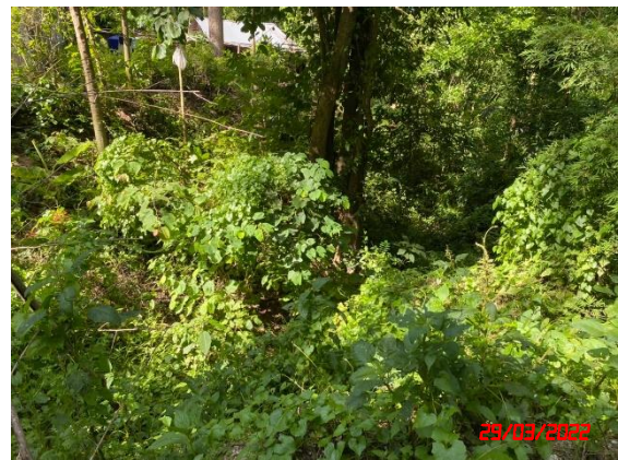
รูปที่ 2-2 คั่นทำนบดิน