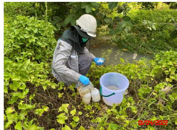
บ่อกักเก็บน้ำใสที่บริเวณพื้นที่เก็บกองเปลือกดินเศษหินของโครงการ “บ4”