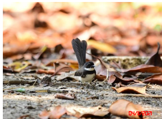
นกอีแพรดแถบอกดำ ( Rhipidura javanica )