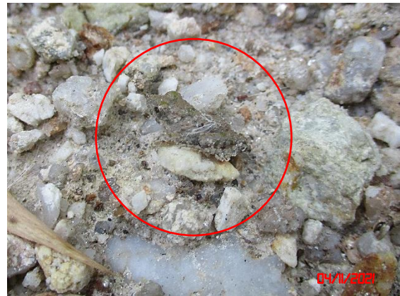
กบหนอง ( Rana limnocharis )