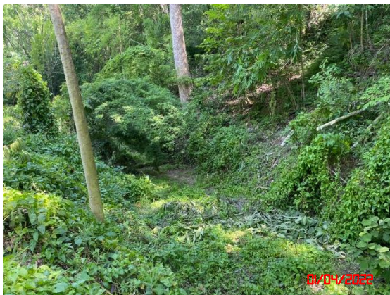
บ่อกักเก็บน้ำใสที่บริเวณโรงแต่งแร่ของโครงการ “บ2”