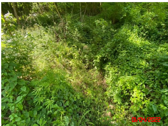
น้ำสาขาห้วยแม่กระบาล (ก่อนไหลผ่านพื้นที่โครงการ)