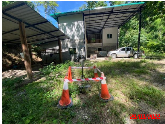
สำนักงานโครงการ