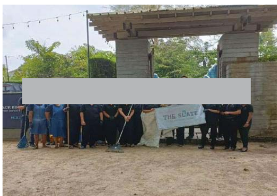
ภาพที่ 19 พนักงานร่วมกันเก็บขยะและคัดแยกขยะมูลฝอยบริเวณพื้นที่โรงแรม