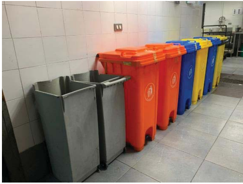
ภาพที่ 20 ถังขยะแยกประเภท