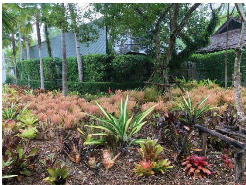
ภาพที่ 14 การจัดพื้นที่สีเขียวและสภาพภูมิทัศน์ภายในโรงแรม