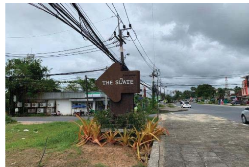
ภาพที่ 5 ป้ายชื่อโรงแรมบริเวณถนน 200 ปี วิรสตรี