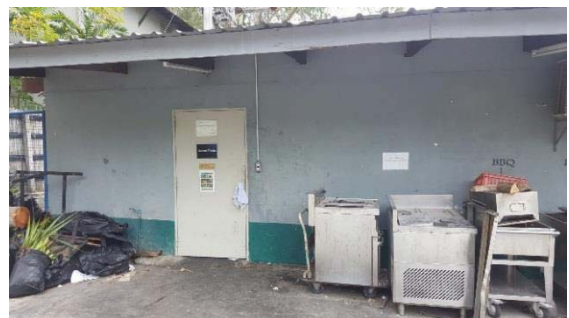
ภาพที่ 12 ห้องพักขยะรีไซเคิลของโครงการ