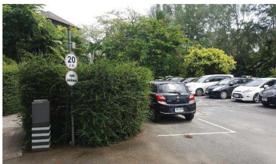
ภาพที่ 4 ป้ายจำกัดความเร็วในพื้นที่โครงการและ ป้ายรณรงค์ดับเครื่องยนต์