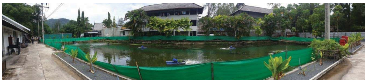
ภาพที่ 16 ระบบบำบัดน้ำเสียรวม