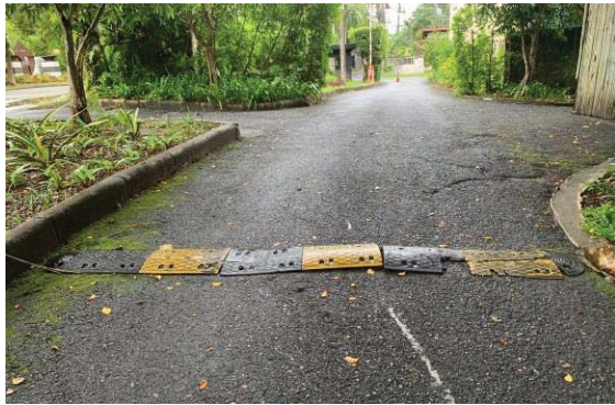
ภาพที่ 1 สันนุนยางชะลอความเร็วบริเวณ ทางไปสปา จุดที่ 1