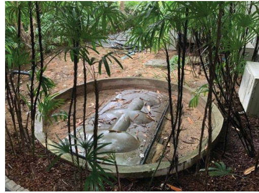
ภาพที่ 21 บ่อเกรอะ-กรองไร้อากาศเพื่อรองรับ น้ำเสียจากอาคารห้องพัก