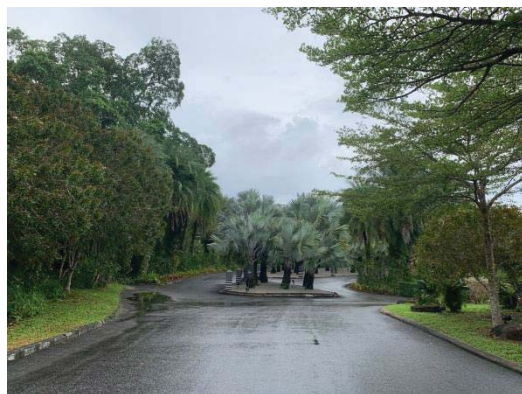
ภาพที่ 18 ถนนภายในพื้นที่โรงแรม