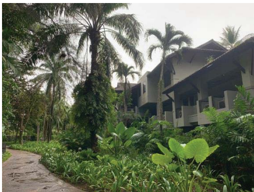
ภาพที่ 23 อาคารต่างๆ ของโครงการ