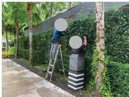
ภาพที่ 15 การดูแลพื้นที่สีเขียวและสภาพภูมิทัศน์ภายในโรงแรม