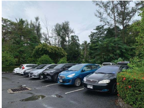
ภาพที่ 9 ที่จอดรถยนต์ของโครงการ