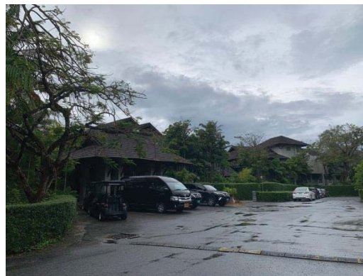
ภาพที่ 3 สันนุนยางชะลอความเร็วบริเวณทางเข้าลานจอดรถของโครงการ