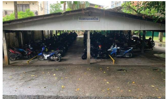
ภาพที่ 10 ที่จอดรถจักรยานยนต์ของโครงการ