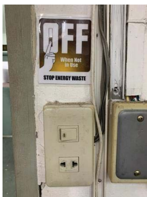
ภาพที่ 17 การรณรงค์ใช้ไฟฟ้าและพลังงานอย่างประหยัด