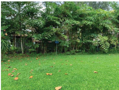
จุดรวมพลบริเวณลานโครีเซียม