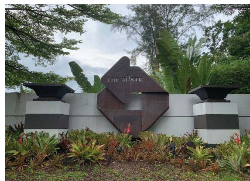
ภาพที่ 7 ป้ายชื่อโครงการบริเวณทางเข้า-ออก โครงการ