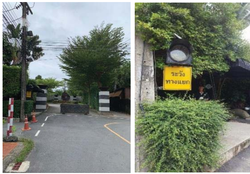
ภาพที่ 8 เครื่องควบคุมสัญญาณไฟเตือนบริเวณทางเข้า-ออกของโครงการ