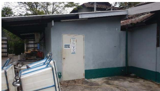
ภาพที่ 11 ห้องพักขยะเปียกของโครงการ