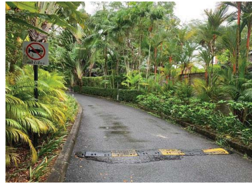
ภาพที่ 2 สันนุนยางชะลอความเร็วบริเวณ ทางไปสปา จุดที่ 2