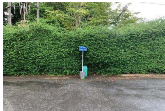
จุดรวมพลบริเวณลานจอดรถ