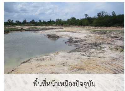
พื้นที่หน้าเหมืองปัจจุบัน