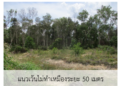
แนวเวนไม่ทำเหมืองระยะ 50 เมตร