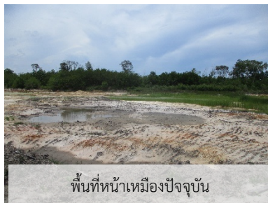
พื้นที่หน้าเหมืองปัจจุบัน