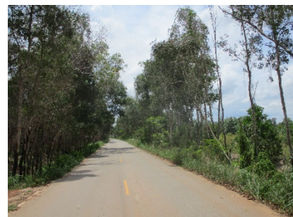
เส้นทางเข้าสู่พื้นที่โครงการ