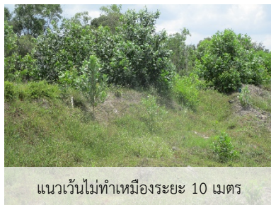
แนวเวนไม่ทำเหมืองระยะ 10 เมตร