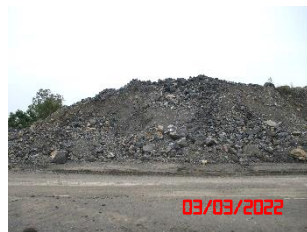
พื้นที่กองเปลือกดิน