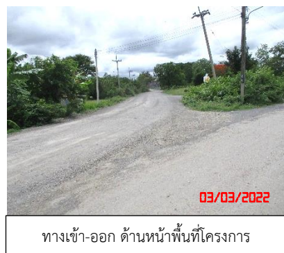
ทางเข้า-ออก ด้านหน้าพื้นที่โครงการ