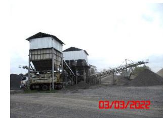
โรงโม่หินของโครงการ