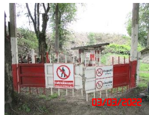
อาคารเก็บวัตถุระเบิด