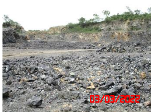
พื้นที่หน้าเหมืองของโครงการ