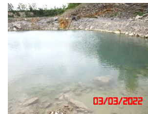
บ่อขุมเหมือง/บ่อตักตะกอน