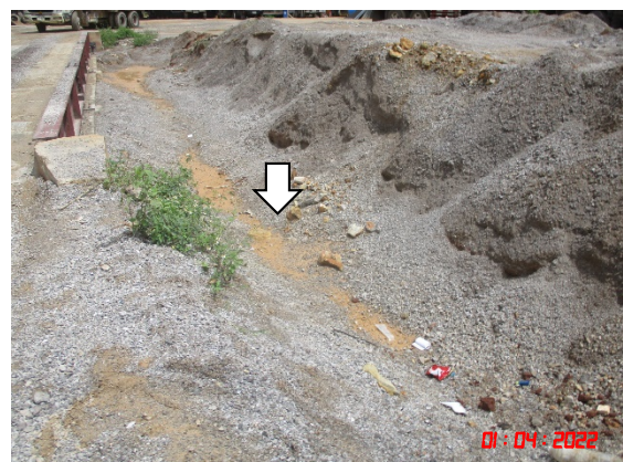
คูระบายน้ำ