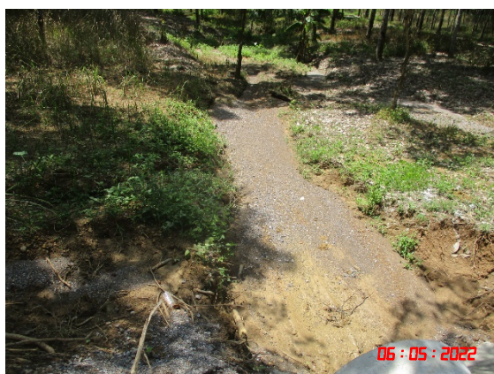
น้ำคลองยวน