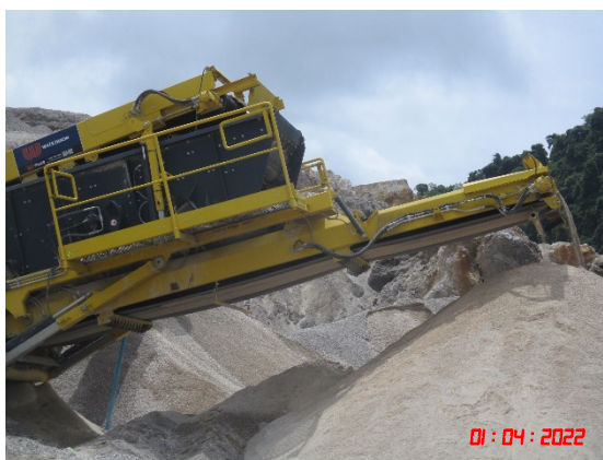
รูปที่ 2-26 ระบบสายพานน้ำบริเวณเครื่องจักรอุปกรณ์ในการบด ย่อยหินแบบเคลื่อนที่ได้