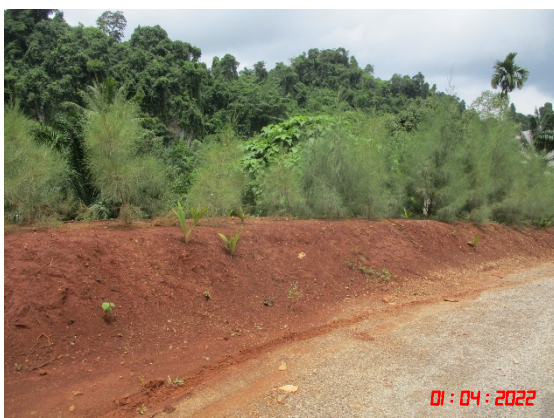
คั่นทำนบดิน