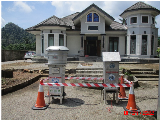
บ้านหน้าสวน (ทิศตะวันตกเฉียงเหนือ)