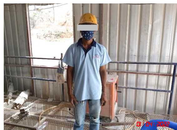
การสวมใส่อุปกรณ์ป้องกันอันตรายส่วนบุคคล