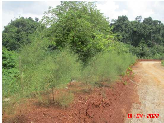
รูปที่ 2-5 บ่อดักตะกอน