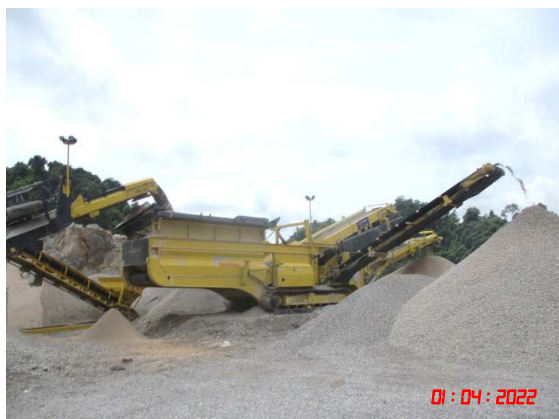
รูปที่ 2-25 เครื่องจักรอุปกรณ์ในการบด ย่อยหินแบบเคลื่อนที่ (Mobile Machine)