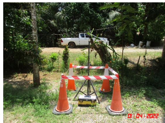
บ้านบางสวรรค์ (ทิศตะวันออกเฉียงใต้)