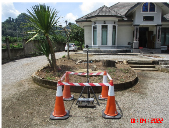
บ้านหน้าสวน (ทิศตะวันตกเฉียงเหนือ)