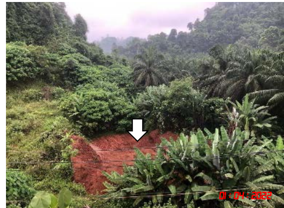
รูปที่ 2-6 เส้นทางขนส่งแร่