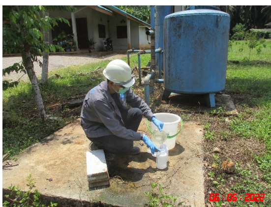
น้ำบาดาลบ้านบางสวรรค์ (ทิศตะวันออกเฉียงใต้)