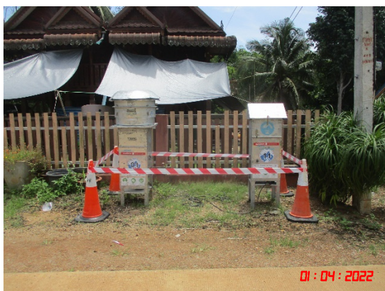
บ้านสระแก้ว (ทิศเหนือ)