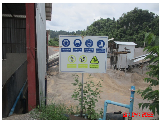
ป้ายเตือนการสวมใส่อุปกรณ์ป้องกันอันตรายส่วนบุคคล