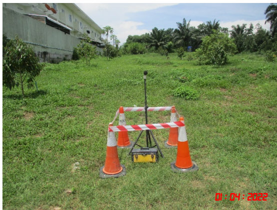
บ้านสระแก้ว (ทิศเหนือ)