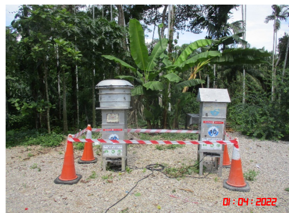
บ้านสระแก้ว (ทิศตะวันตก)