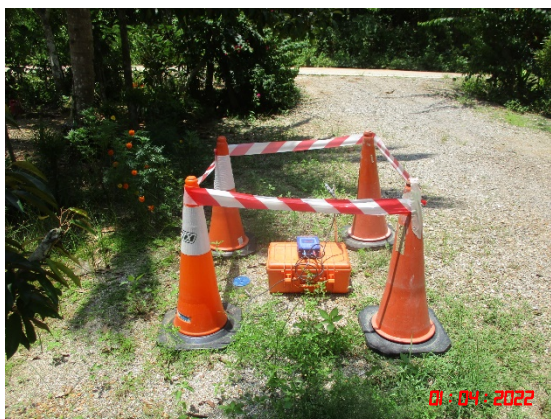
บ้านบางสวรรค์ (ทิศตะวันออกเฉียงใต้)