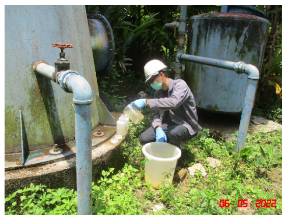
น้ำบาดาลบ้านสระแก้ว (ทิศตะวันตก)