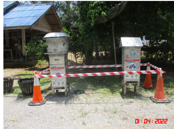
บ้านบางสวรรค์ (ทิศตะวันออกเฉียงใต้)