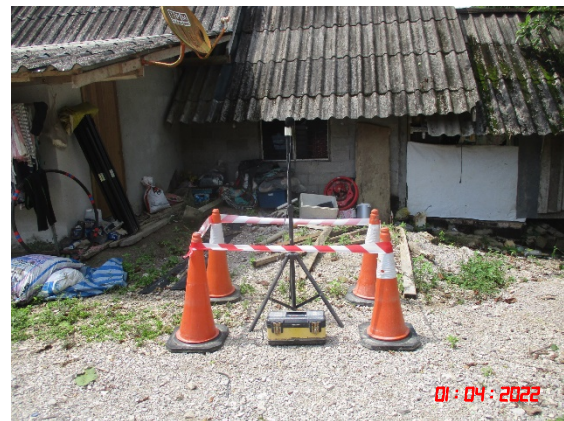
บ้านสระแก้ว (ทิศตะวันตก)