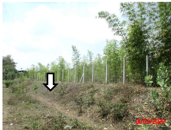
คูระบายน้ำ