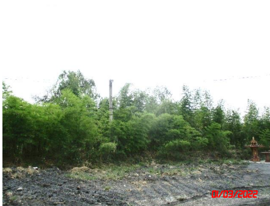
แนวต้นไม้บริเวณโรงโม่หิน