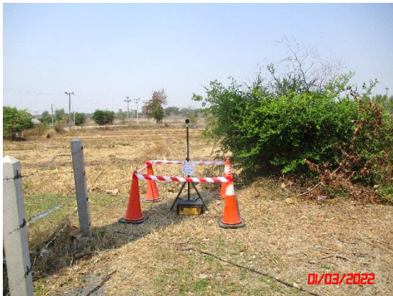
บ้านโคกกรวด