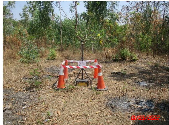
บ้านตะแบก