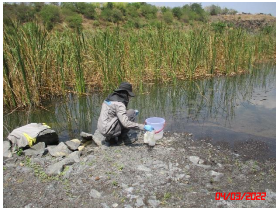
บ่อชุมชนเมืองของโครงการ