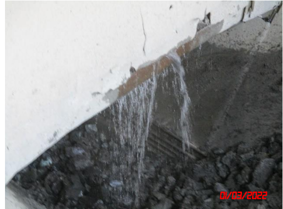
ระบบสเปรย์น้ำ