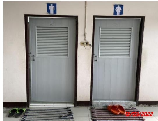
ห้องสุขา