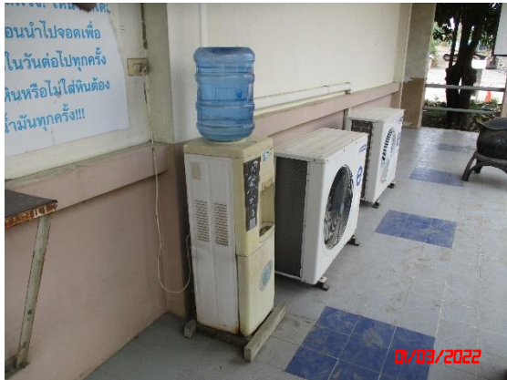
น้ำดื่มสะอาด