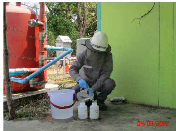
น้ำบาดาลบ้านโคกกรวด