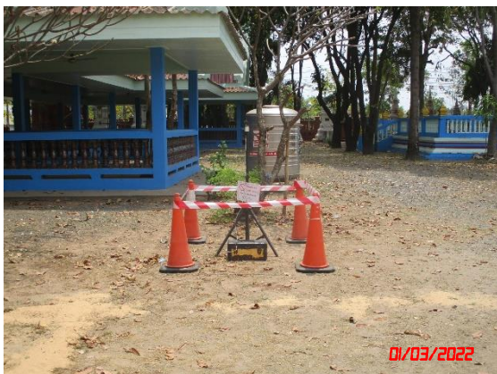
วัดกระหมวราราม