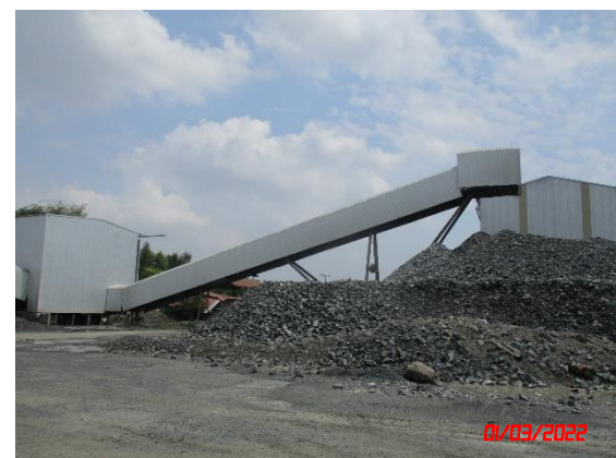
หลังคาปิดคลุมสายพานลำเลียง