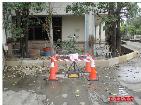
สำนักงานโรงโม่หินของโครงการ