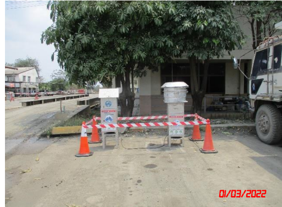
สำนักงานโรงโม่หินของโครงการ