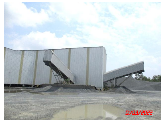
อาคารปิดคลุมโรงโม่หิน