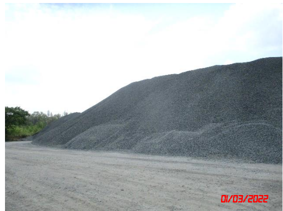
ลานเก็บกองแร่ที่ไม่บดแล้ว