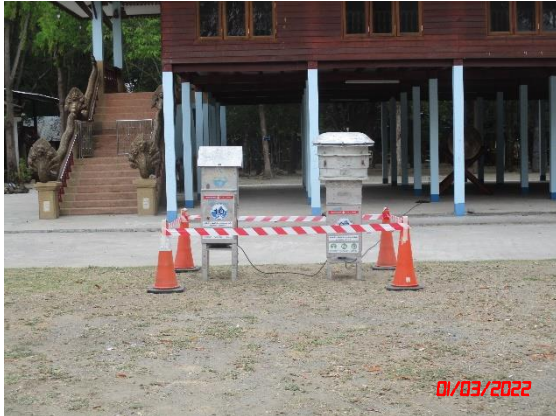
วัดกระหมวราราม