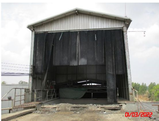
อาคารปิดคลุมยังรับหินใหญ่