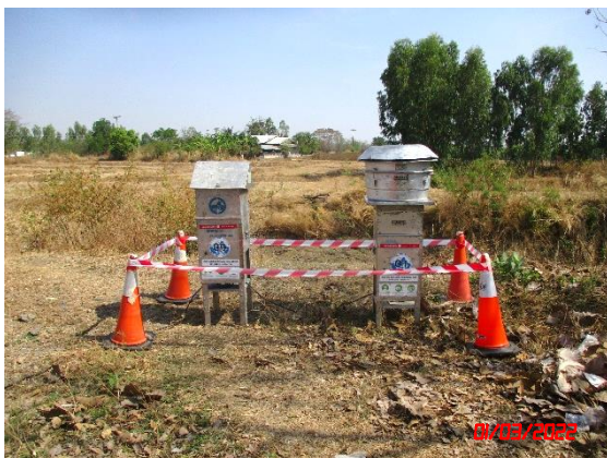
บ้านโคกกรวด