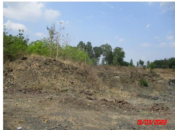
รูปที่ 2-3 แนวกันเขตไม้ทำเหมืองในระยะ 50 เมตร จากทางสาธารณประโยชน์