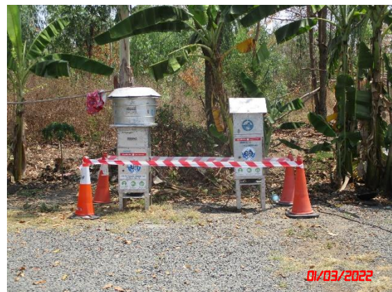
บ้านตะแบก