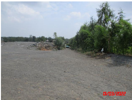
ถนนหินบดอัดแน่นบริเวณโรงโม่หิน