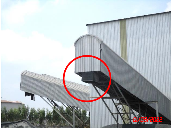
อุปกรณ์ปลายสายพานลำเลียง