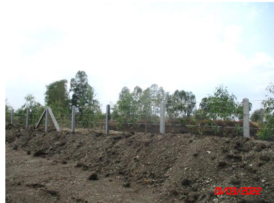
คันทำนบดิน