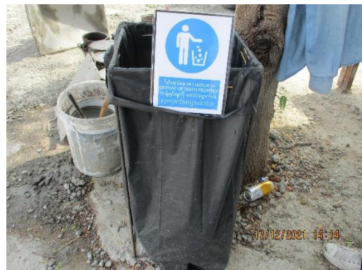
รูปที่ 16 ถังรองรับมูลฝอย