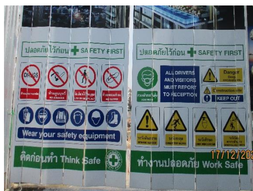
รูปที่ 19 ป้ายความปลอดภัย