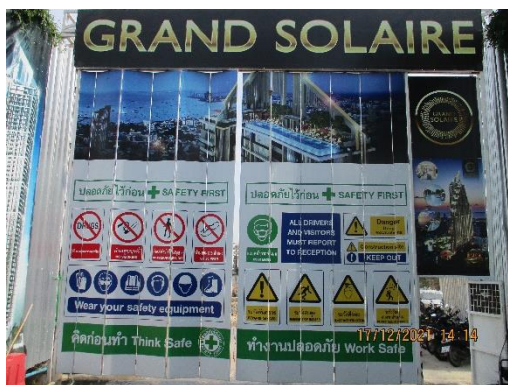
รูปที่ 2 ประตูทางเข้า-ออกโครงการปิดมิดชิด