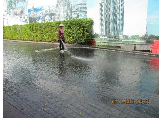
รูปที่ 13 คนงานฉีดพรมน้ำบริเวณด้านหน้าโครงการ