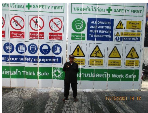
รูปที่ 3 เจ้าหน้าที่รักษาความปลอดภัย (รปภ.)