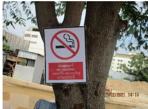
รูปที่ 15 ป้ายห้ามสูบบุหรี่