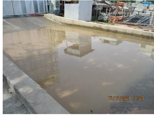
รูปที่ 5 พื้นที่ล้างล้อรถก่อนออกจากพื้นที่โครงการ