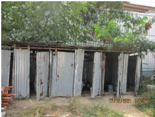
รูปที่ 6 ห้องน้ำ-ห้องส้วม