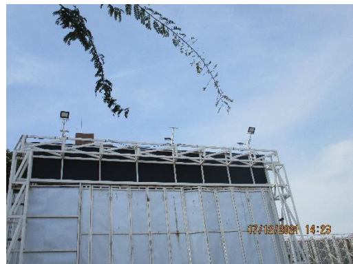
รูปที่ 8 ไฟส่องสว่างบริเวณพื้นที่โครงการ