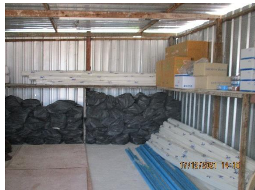
รูปที่ 12 ห้องสไตร