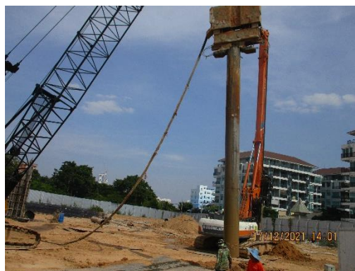
รูปที่ 18 เจาะเสาเข็ม