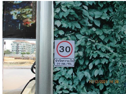
รูปที่ 11 ป้ายจำกัดความเร็วไม่เกิน 30 กม./ชม.