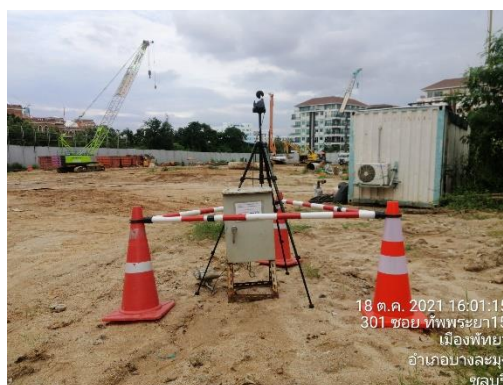
รูปที่ 21 ตั้งเครื่องตรวจวัดคุณภาพสิ่งแวดล้อม คุณภาพอากาศ ระดับเสียง เสียงรบกวน ความสั่นสะเทือน