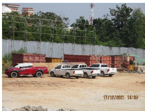
รูปที่ 4 พื้นที่จอดรถภายในโครงการ