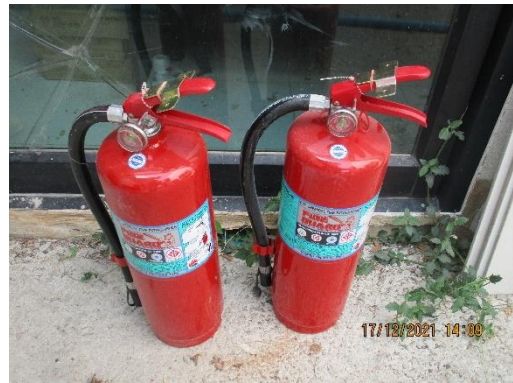
รูปที่ 7 ถังดับเพลิง