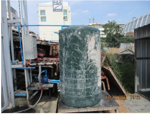
รูปที่ 9 ถังเก็บน้ำสำรอง