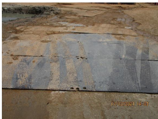
รูปที่ 17 แผ่นเหล็ก