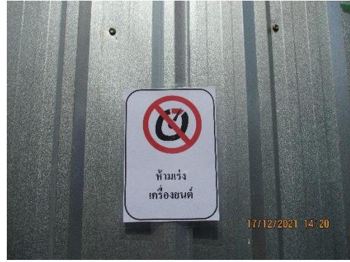
รูปที่ 10 ป้ายห้ามแรงเครื่อง