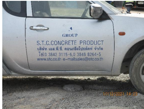
รูปที่ 22 ป้ายแสดงชื่อและหมายเลขโทรศัพท์ติดต่อ