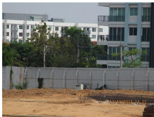
รูปที่ 1 รั้ว Metal Sheet รอบพื้นที่โครงการ