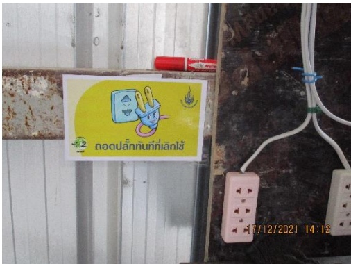
รูปที่ 14 ป้ายรณรงค์ประหยัดไฟ