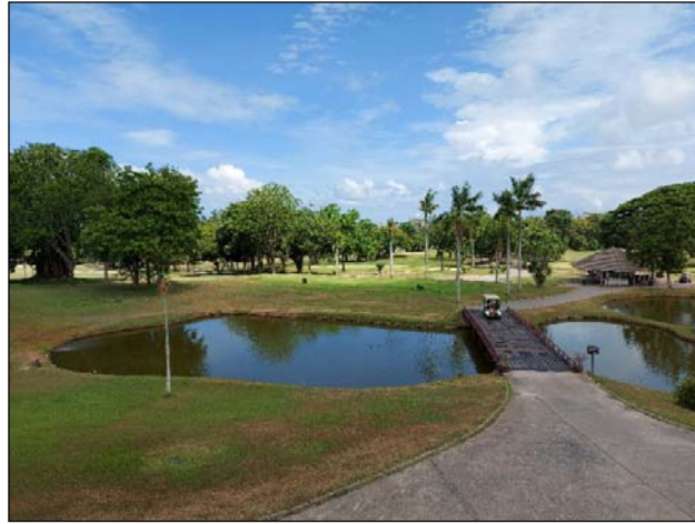
รูปที่ 3.4(1) ทศนิยมภาพและสุนทรียภาพ ถนนใน โครงการอยู่ในสภาพดี และสะอาดอยู่เสมอ