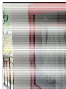
รูปที่ 3.2(4) ตู้สายฉีดน้ำดับเพลิง (Fire Hose Cabinet) ติดตั้งไว้ในอาคาร