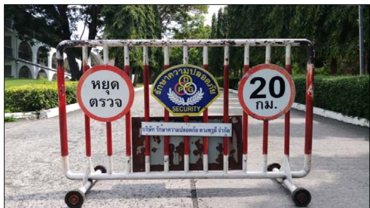
รูปที่ 1.4(1) มีการติดป้ายจำกัดความเร็ว