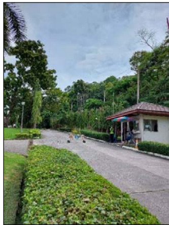
รูปที่ 3.1(1) เจ้าหน้าที่รักษาความปลอดภัย ดูแลทางเข้า-ออก ด้านหน้าโครงการ