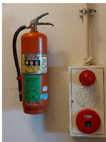
รูปที่ 3.2(3) จัดให้มีถังดับเพลิงชนิดมือถือ ชนิด Dry Chemical ขนาด 10 ปอนด์