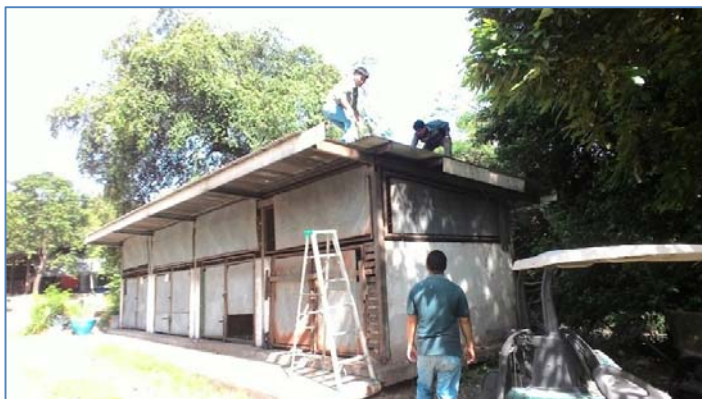
รูปที่ 2.3(1) จัดให้มีโรงพักขยะแยกประเภท