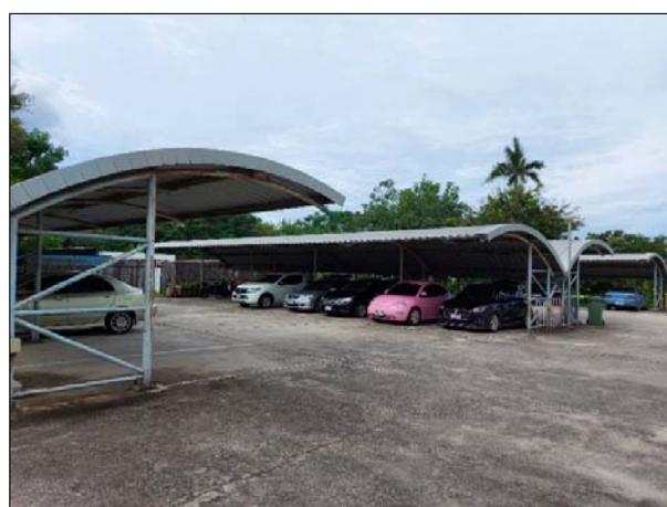
รูปที่ 2.5(2) ลานจอดรถ บริเวณหน้าอาคารโรงแรมส่วนขยาย