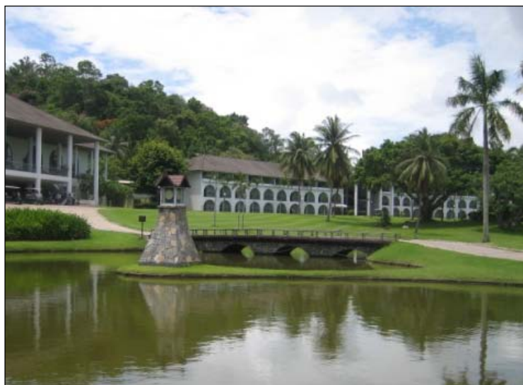
รูปที่ 3. 4(3) ทศนิยมภาพและสุนทรียภาพ อาคารของ โครงการฯ ได้มีการออกแบบตาม สภาพภูมิประเทศ