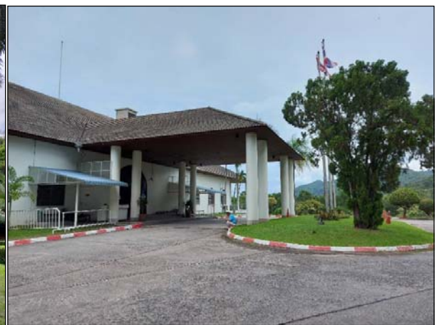
รูปที่ 1.2 (1) ถนนในโครงการอยู่ในสภาพดีและสะอาด