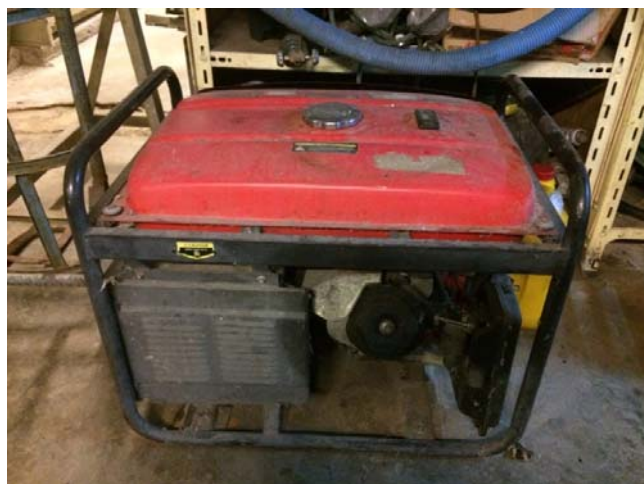
รูปที่ 3.2(5) เครื่องปั่นไฟขนาด 5KW