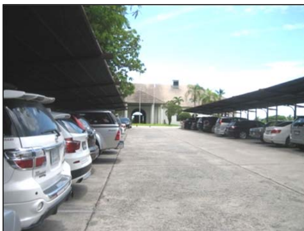
รูปที่ 2.5(1) ลานจอดรถ บริเวณหน้าอาคาร คลับเฮ้าส์