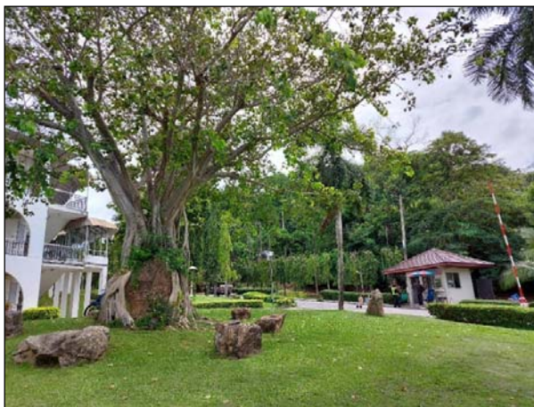
รูปที่ 1.1(2) จัดให้มีพื้นที่สีเขียว มีการปลูก ต้นไม้และหญ้าคลุมดินในบริเวณพื้นที่ว่าง