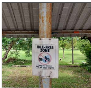
รูป 1.2 (2) ติดตั้งป้ายบริเวณลานจอดรถ “โปรดดับเครื่องยนต์ขณะจอดรถ”