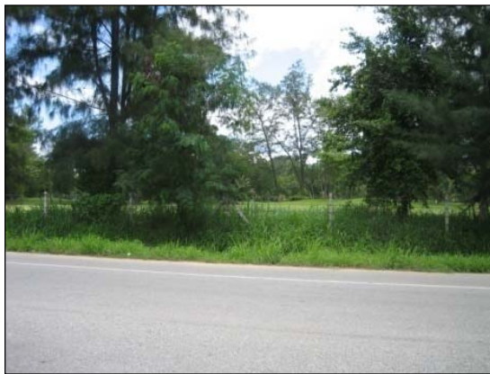
รูปที่ 1.1(1) จัดทำรั้วโดยรอบพื้นที่โครงการ