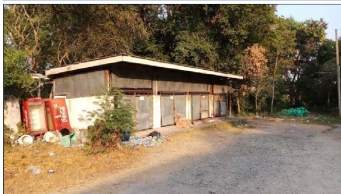
รูปที่ 2.3(2) รวมขยะภายในมีถังขยะปิดมิดชิด ขนาด 240 ลิตร ตั้งไว้ภายในเพื่อป้องกันการรั่วไหล