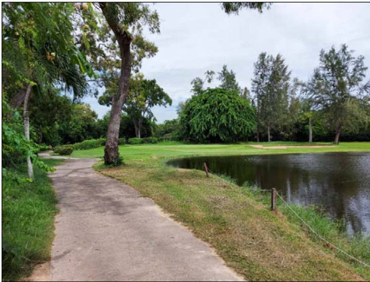
รูปที่ 3.4(2) ทศนิยมภาพและสุนทรียภาพ การจัด และตกแต่งพื้นที่สีเขียว