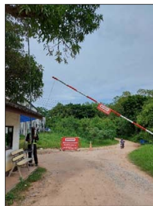
รูปที่ 3.1(2) เจ้าหน้าที่รักษาความปลอดภัย ดูแลทางเข้า-ออก หลังโครงการ (บริเวณบ้านพักคนงาน)