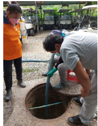
รูปที่ 1.6 (3) การสูบล้างตะกอนออกจากระบบบำบัดไปกำจัด