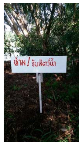
รูปที่ 1.6 (2) บ่อรับน้ำที่ 20 เพื่อนำมาใช้รดน้ำต้นไม้และสนามหญ้า และป้าย ห้ามจับสัตว์น้ำ