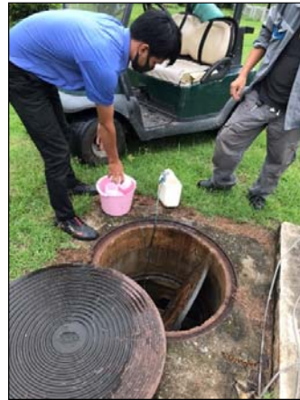
รูปที่ 3.3(3) มีการฆ่าเชื้อโรคด้วยคลอรีน ก่อนปล่อยสู่แหล่งรองรับน้ำทิ้ง