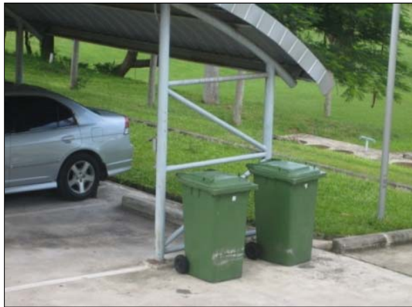
รูปที่ 3.3(2) จัดให้มีภาชนะรองรับขยะ ที่มีฝาปิด มิดชิด ตามจุดต่างๆ ของโครงการ