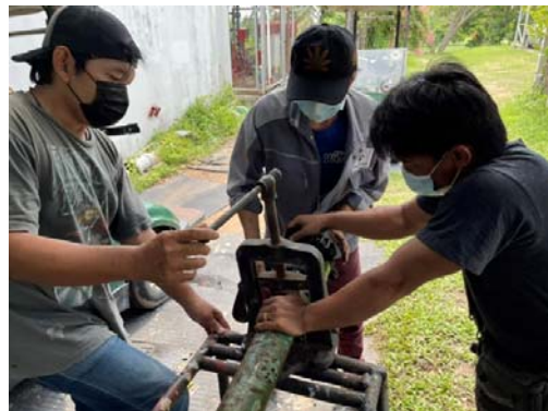
รูปที่ 2.1 ตรวจสอบรอยแตก/ชำรุดของระบบจ่ายน้ำ และระบบเส้นท่อประปาให้อยู่ในสภาพดีอยู่เสมอ