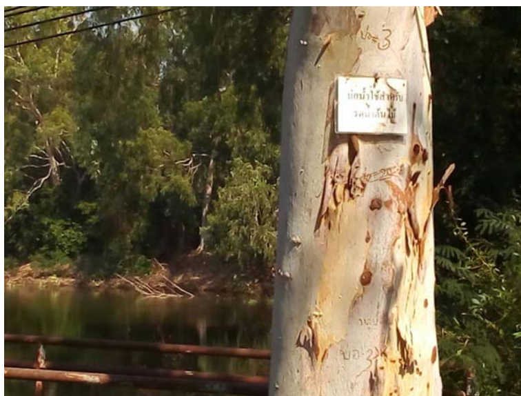
รูปที่ 1.6 (1) บ่อรับน้ำที่ 3 เพื่อนำมาใช้รดน้ำต้นไม้และสนามหญ้า