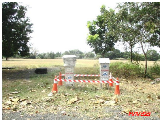
โรงเรียนบ้านเจริญสุข