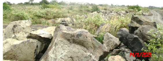
พื้นที่เว้นการทำเหมืองระยะ 50 เมตร