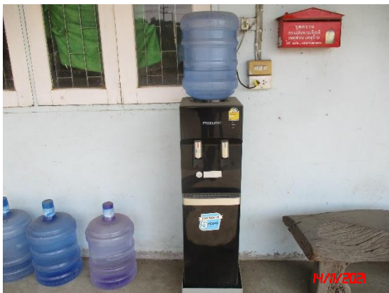
น้ำดื่มสะอาด