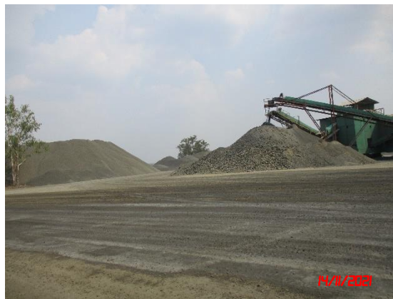
ลานเก็บกองแร่ที่ไม่บดแล้ว