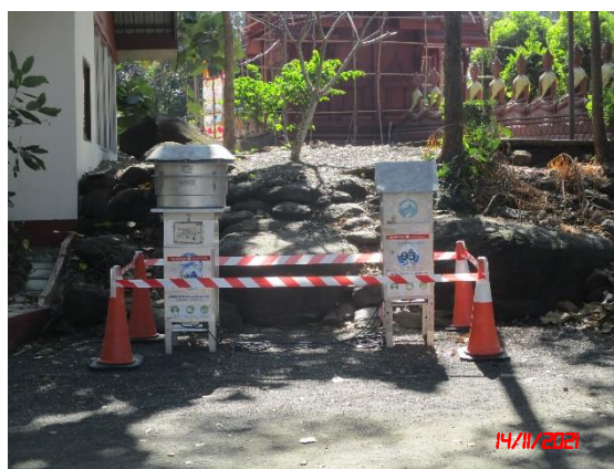
วัดพระอังคาร