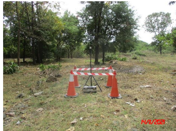
โรงเรียนบ้านเจริญสุข