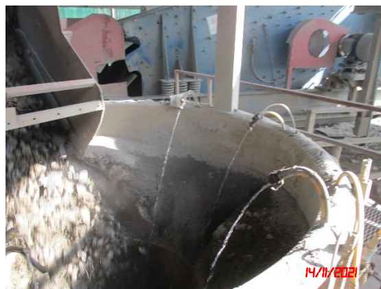
ระบบสเปรย์น้ำ