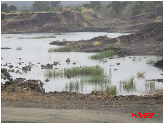
รูปที่ 2-11 บ่อเหมืองเก่าทางด้านทิศตะวันออกเฉียงใต้