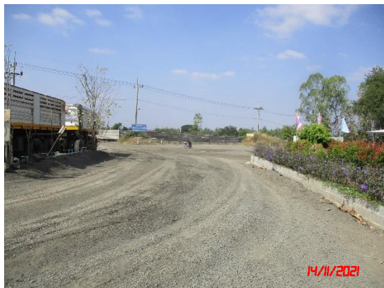
ถนนหินบดอัดแน่นบริเวณโรงโม่หิน