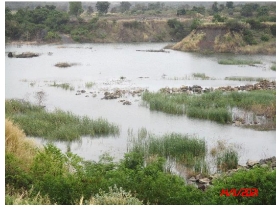
รูปที่ 2-12 บ่อรับน้ำ (Sump) บริเวณหน้าเหมือง