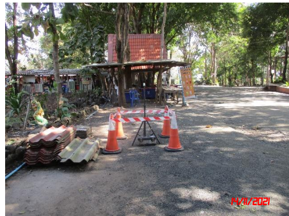
วัดพระอังคาร