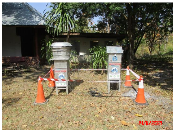
บ้านเรือนราษฎรใกล้เคียงด้านทิศตะวันออกเฉียงเหนือ