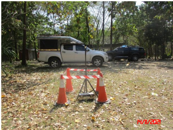
บ้านเรือนราษฎรใกล้เคียงด้านทิศตะวันออกเฉียงเหนือ