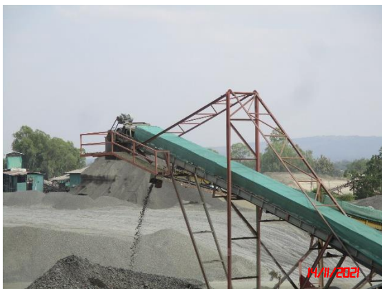
หลังคาปิดคลุมสายพานลำเลียง