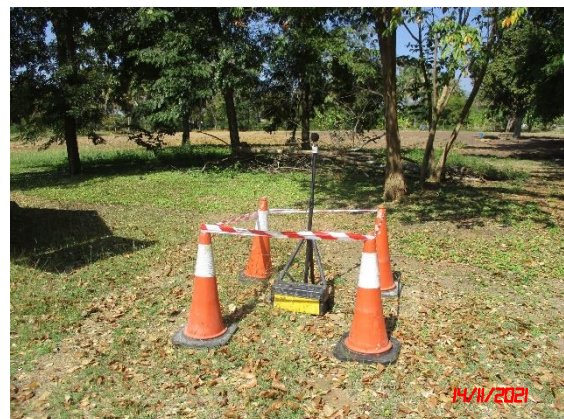
บ้านประรัง