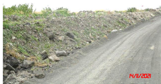
รูปที่ 2-5 เส้นทางลำเลียงแร่ของโครงการ