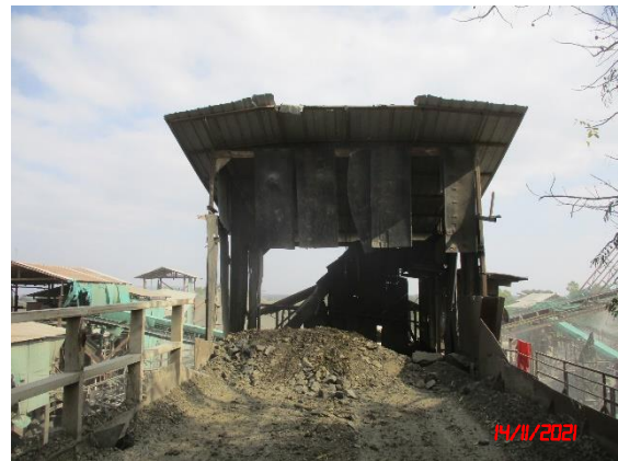
อาคารปิดคลุมยังรับหินใหญ่