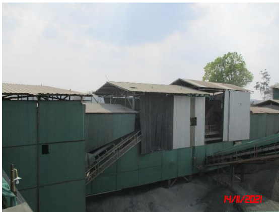
อาคารปิดคลุมโรงโม่หิน