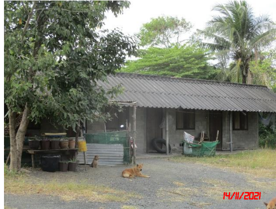
บ้านพักพนักงาน