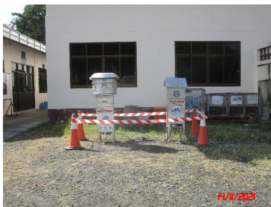
วัดบ้านเจริญสุข (วัดวิเศษสุขาราม)