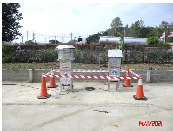
สำนักงานโรงโม่หินของโครงการ