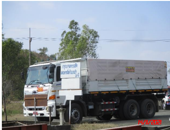
รูปที่ 2-15 ป้ายเตือนระวังมีรถบรรทุกเข้า-ออก