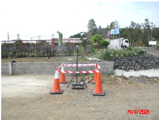
สำนักงานโรงโม่หินของโครงการ