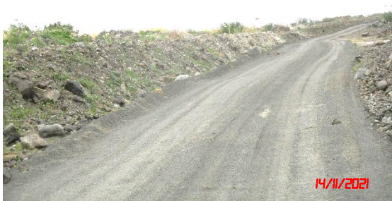
พื้นที่เว้นการทำเหมืองระยะ 10 เมตร