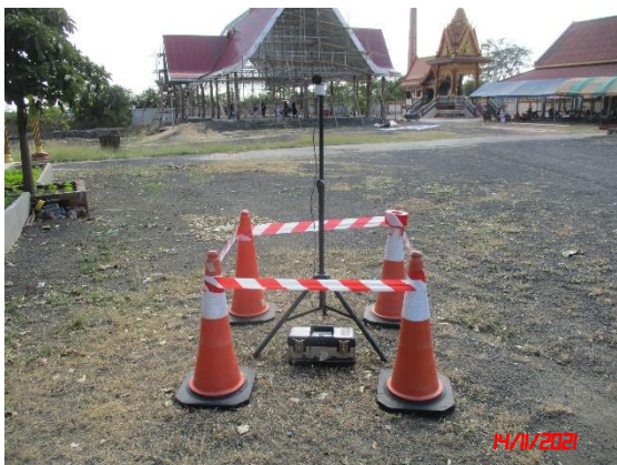
วัดบ้านเจริญสุข (วัดวิเศษสุขาราม)