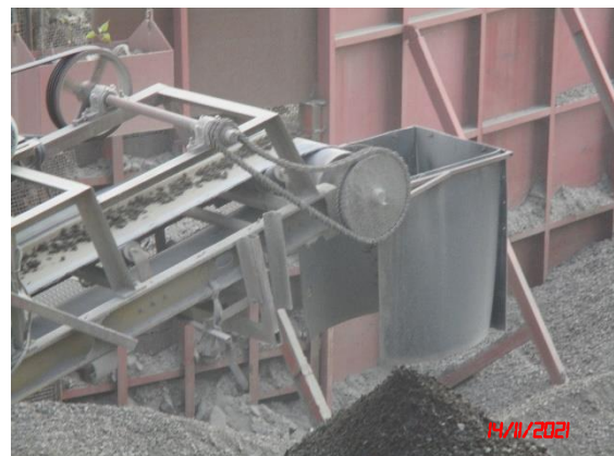
ถังครอบปลายสายพานลำเลียง