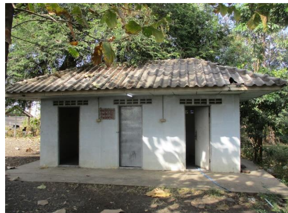
ห้องสุขา