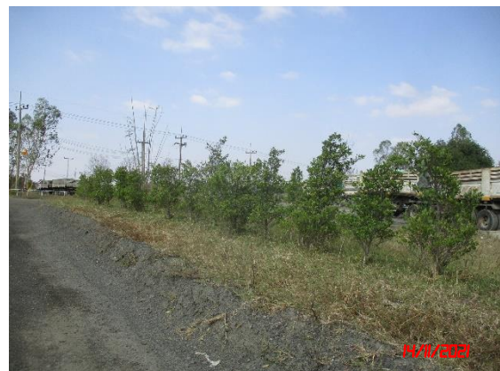
แนวต้นไม้บริเวณโรงโม่หิน