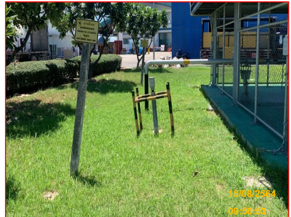
ป้ายเตือนแสดงแนวท่อก๊าซ