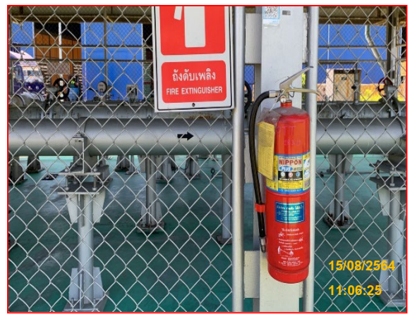
การติดตั้งถังดับเพลิงภายในสถานีควบคุมความดัน และวัดปริมาณก๊าซ

ภาพที่ 3.2-1 ภาพถ่ายระบบรักษาความปลอดภัยบริเวณสถานีก๊าซโครงการวางท่อก๊าซธรรมชาติ ไปยัง บริษัท ไอศกสภา จำกัด