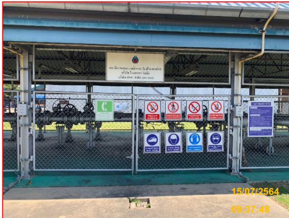
ภายในสถานีควบคุมความดันและวัดปริมาณก๊าซ