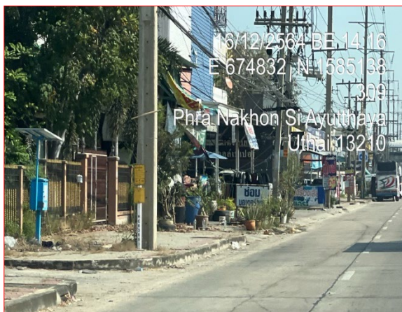
ป้ายเตือนแสดงแนวท่อก๊าซ