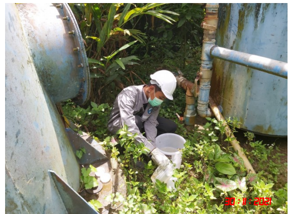
น้ำบาดาลบ้านสระแก้ว (ทิศตะวันตก)