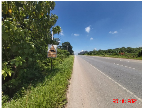
รูปที่ 2-15 ป้ายเตือนและการสวมใส่อุปกรณ์ป้องกันอันตรายส่วนบุคคล