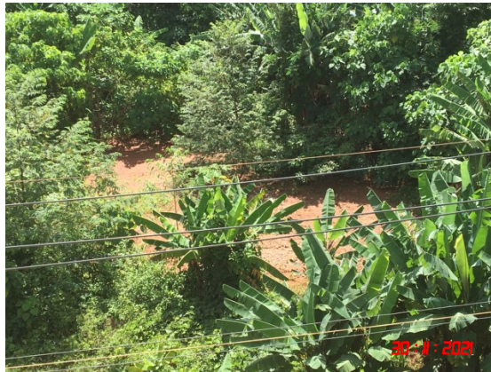
รูปที่ 2-6 เส้นทางขนส่งแร่