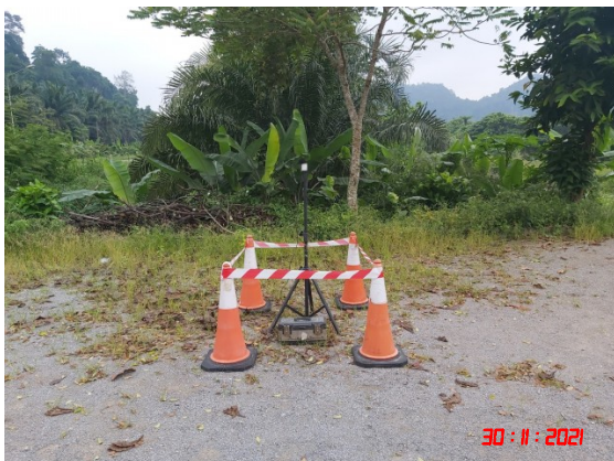
บ้านหน้าสวน (ทิศตะวันตกเฉียงเหนือ)