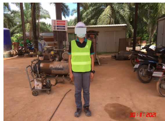
การสวมใส่อุปกรณ์ป้องกันอันตรายส่วนบุคคล