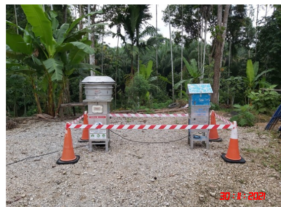
บ้านสระแก้ว (ทิศตะวันตก)