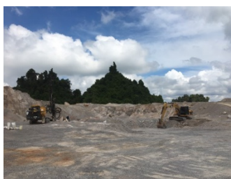
พื้นที่หน้าเหมืองปัจจุบัน

พื้นที่โครงการ ประทานบัตรที่ 30294/16161