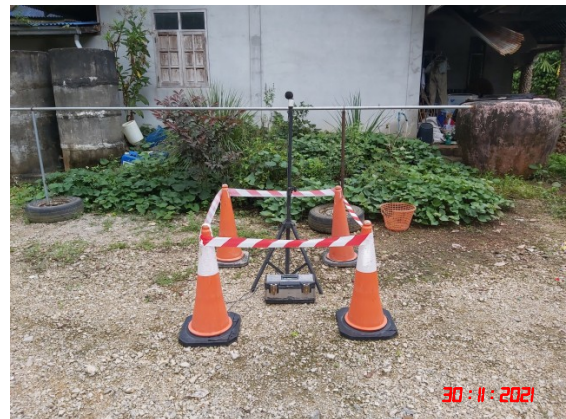
บ้านสระแก้ว (ทิศตะวันตก)