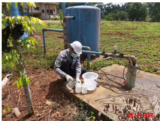
น้ำบาดาลบ้านบางสวรรค์ (ทิศตะวันออกเฉียงเหนือ)