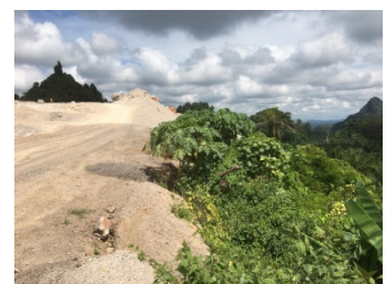
พื้นที่เว้นการทำเหมือง