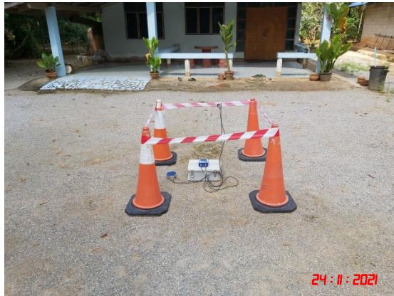
บ้านบางสวรรค์ (ทิศตะวันออกเฉียงใต้)