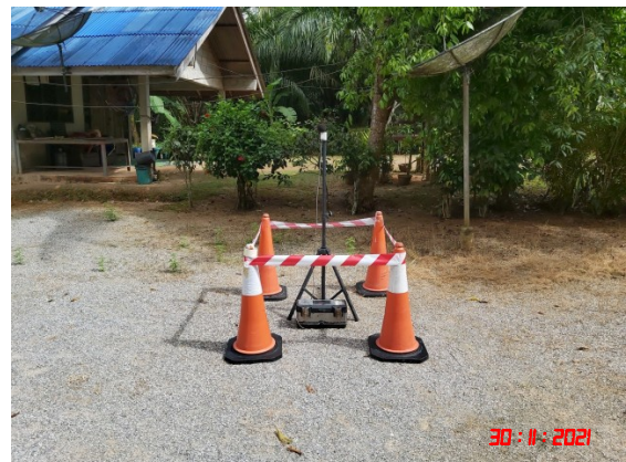
บ้านบางสวรรค์ (ทิศตะวันออกเฉียงใต้)