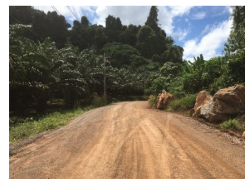
เส้นทางขนส่งแร่