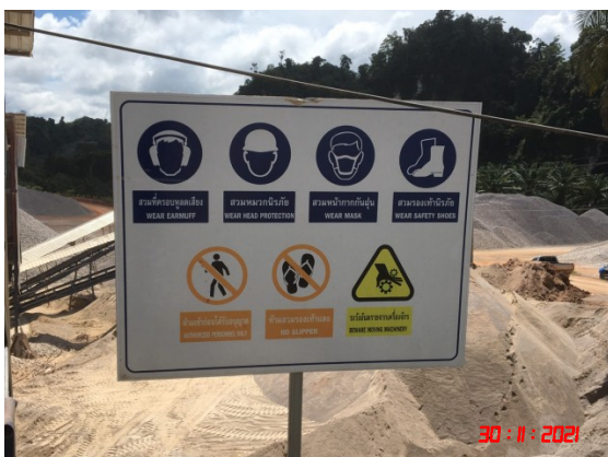
ป้ายเตือนการสวมใส่อุปกรณ์ป้องกันอันตรายส่วนบุคคล