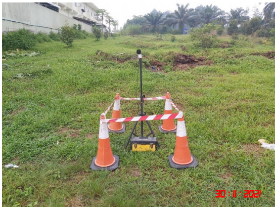
บ้านสระแก้ว (ทิศเหนือ)