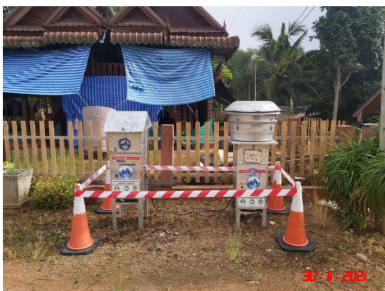
บ้านสระแก้ว (ทิศเหนือ)