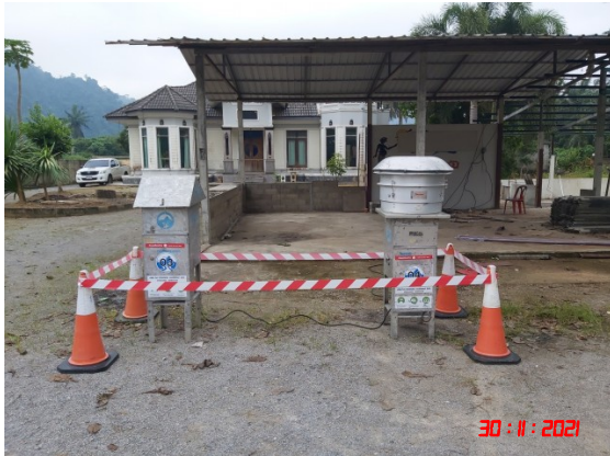
บ้านหน้าสวน (ทิศตะวันตกเฉียงเหนือ)