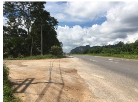
ทางหลวงหมายเลข 44