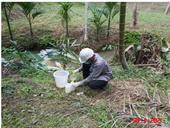
น้ำคลองยวน