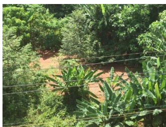
บ่อดักตะกอน