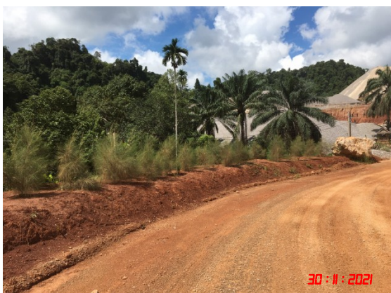
คั่นทำนบดิน