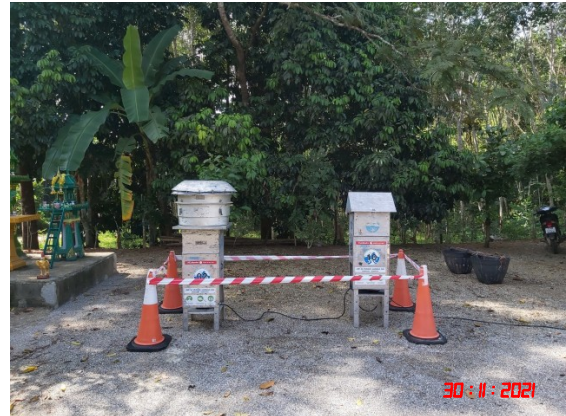
บ้านบางสวรรค์ (ทิศตะวันออกเฉียงใต้)