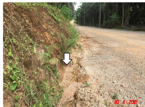
ระบายน้ำ