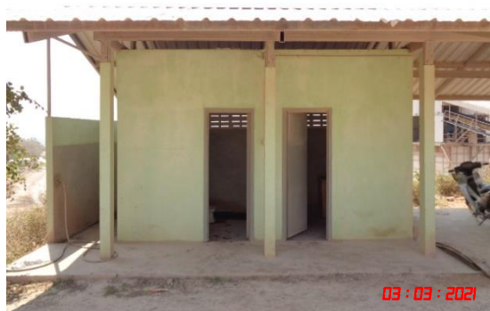
รูปที่ 2-20 การตรวจวัดคุณภาพอากาศ ระหว่างวันที่ 3-6 มีนาคม 2564