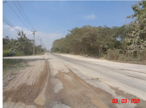
ถนนลาดยางส่วนบุคคลของกลุ่มโรงโม่