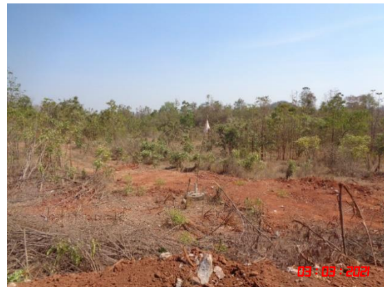
รูปที่ 2-3 ลักษณะหน้าเหมืองแบบขั้นบันได