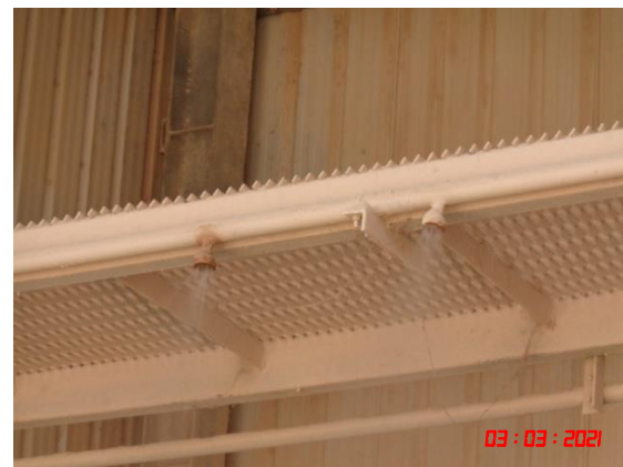
ระบบสเปรย์น้ำบริเวณโรงโม่หิน