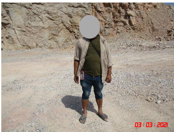
พนักงานที่ปฏิบัติงานบริเวณหน้าเหมืองคนที่ 1