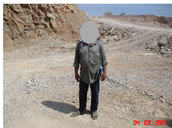
พนักงานที่ปฏิบัติงานบริเวณหน้าเหมืองคนที่ 2