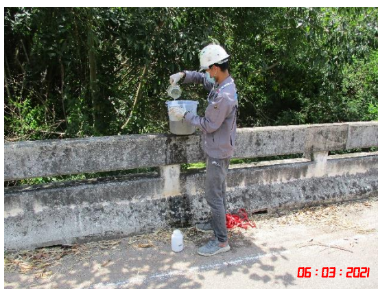
ห้วยอ่างทองหลังไหลผ่านออกใกล้โครงการ