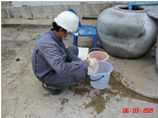
บ่อบาดาลวัดถ้ำยอดทอง