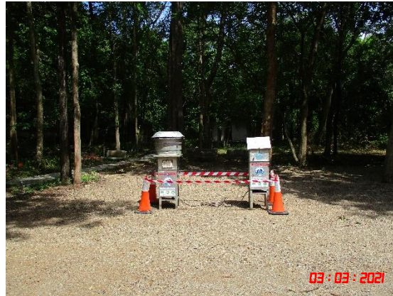
บ้านเขาพระเอก