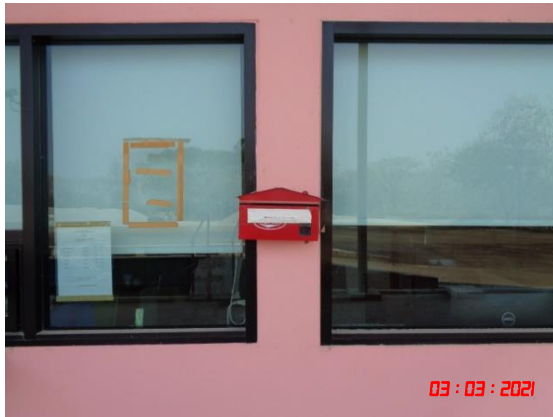
รูปที่ 2-1 กล่องรับเรื่องราวร้องทุกข์ของโครงการ