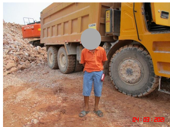
พนักงานที่ปฏิบัติงานบริเวณหน้าเหมืองคนที่ 2