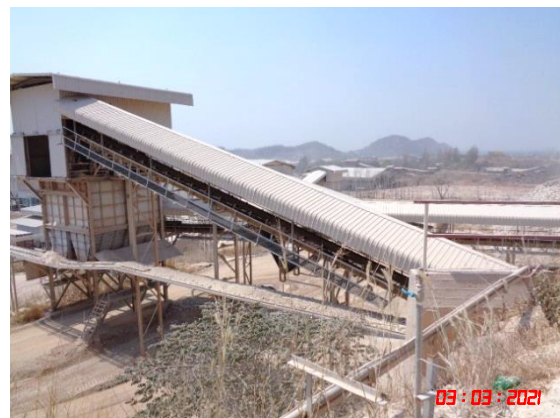
หลังคาปิดคลุมสายพานลำเลียง