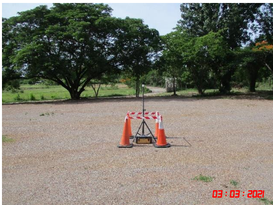
บ้านเขาภูบ