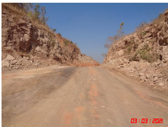
เส้นทางลำเลียงแร่บริเวณหน้าเหมือง