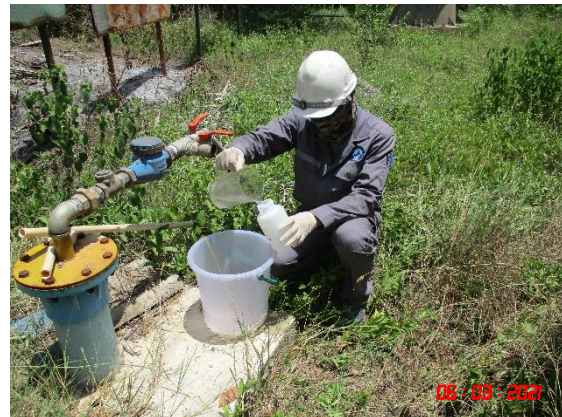
บ่อบาดาลบ้านหนองรีน