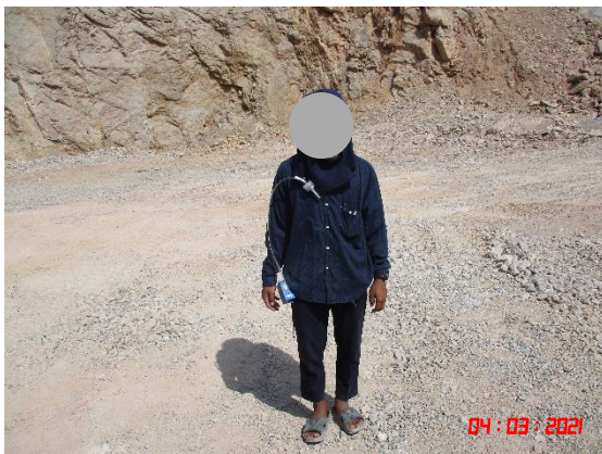
พนักงานที่ปฏิบัติงานบริเวณหน้าเหมืองคนที่ 1