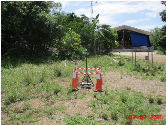
วัดถ้ำยอดทอง