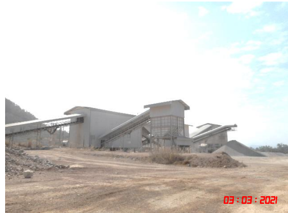
อาคารปิดคลุมโรงไม่หิน