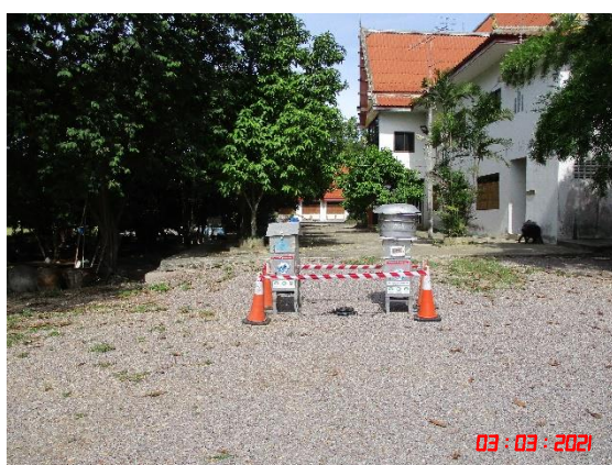
บ้านเขากูป