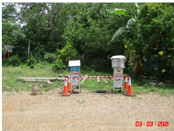
วัดถ้ำยอดทอง