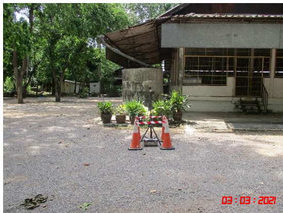
บ้านเขาพระเอก