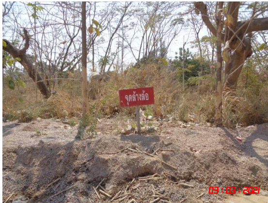
รูปที่ 2-9 ลานล้างล้อรถบรรทุก