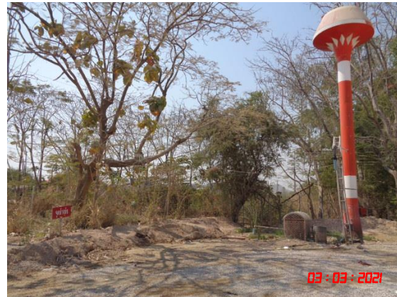
รูปที่ 2-10 ป้ายจำกัดความเร็ว