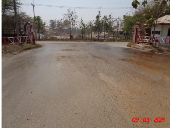
ถนนลาดยางบริเวณโรงโม่หิน