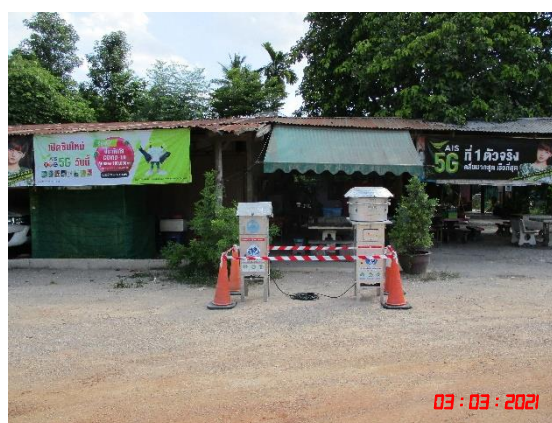
บ้านหนองรีน