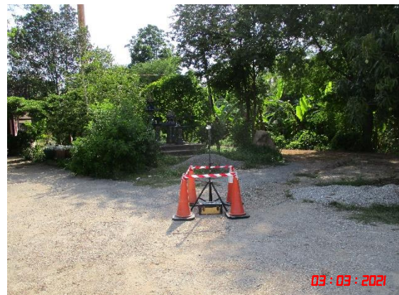
บ้านหนองรีน