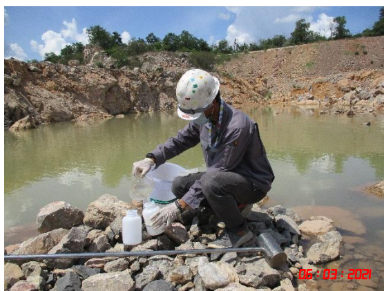
บ่อชุมเหืองของโครงการ