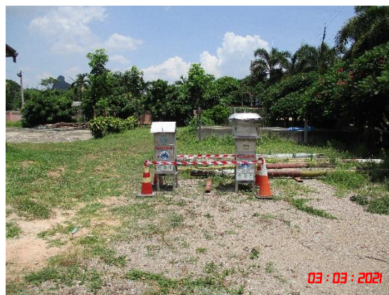
โรงเรียนวัดเขาถ้ำกฤษ