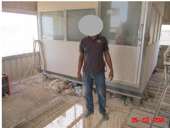
พนักงานที่ปฏิบัติงานบริเวณโรงโม่หินคนที่ 1