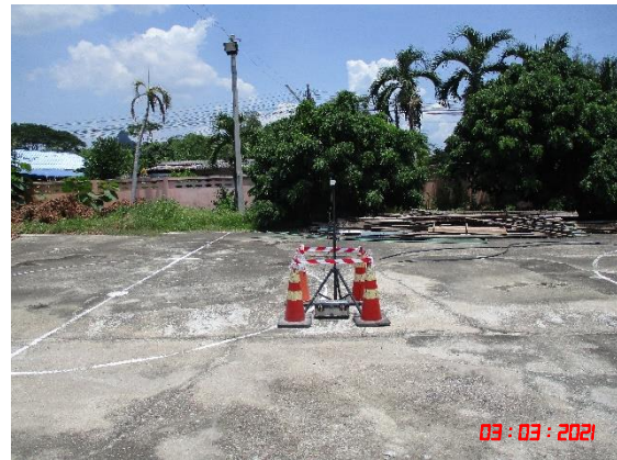
โรงเรียนวัดเขาถ้ำกฤษ