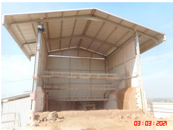
อาคารปิดคลุมยู่รับหินใหญ่