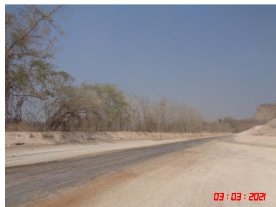
ถนนหินบดอัดแน่นบริเวณโรงม่หิน