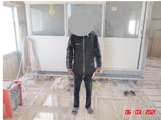
พนักงานที่ปฏิบัติงานบริเวณโรงโม่หินคนที่ 2