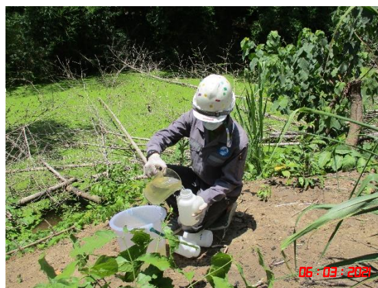
ห้วยอ่างทองก่อนไหลผ่านเข้าใกล้โครงการ