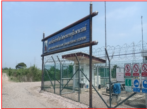
ภายในสถานีควบคุมความดันและวัดปริมาณก๊าซ จุด Test Post