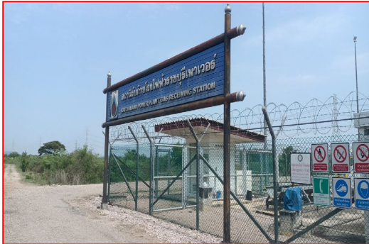
โครงการสถานีรับก๊าซ โรงไฟฟ้าราชบุรีเพาเวอร์