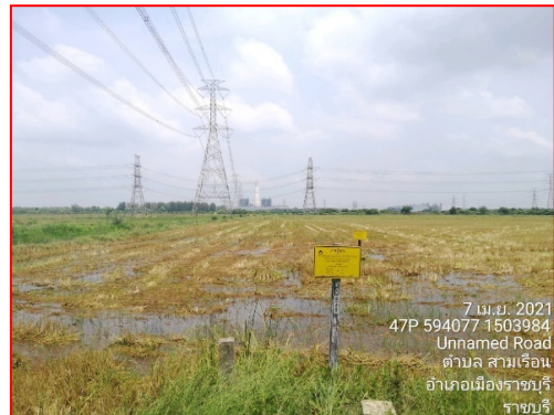
ป้ายเตือนแสดงแนวท่อส่งก๊าซ

ภาพที่ 3.2-3 ภาพถ่ายระบบรักษาความปลอดภัยบริเวณสถานีก๊าซและโครงการท่อส่งก๊าซธรรมชาติ ไปยังโครงการของบริษัท ราชบุรีเพาเวอร์ จำกัด