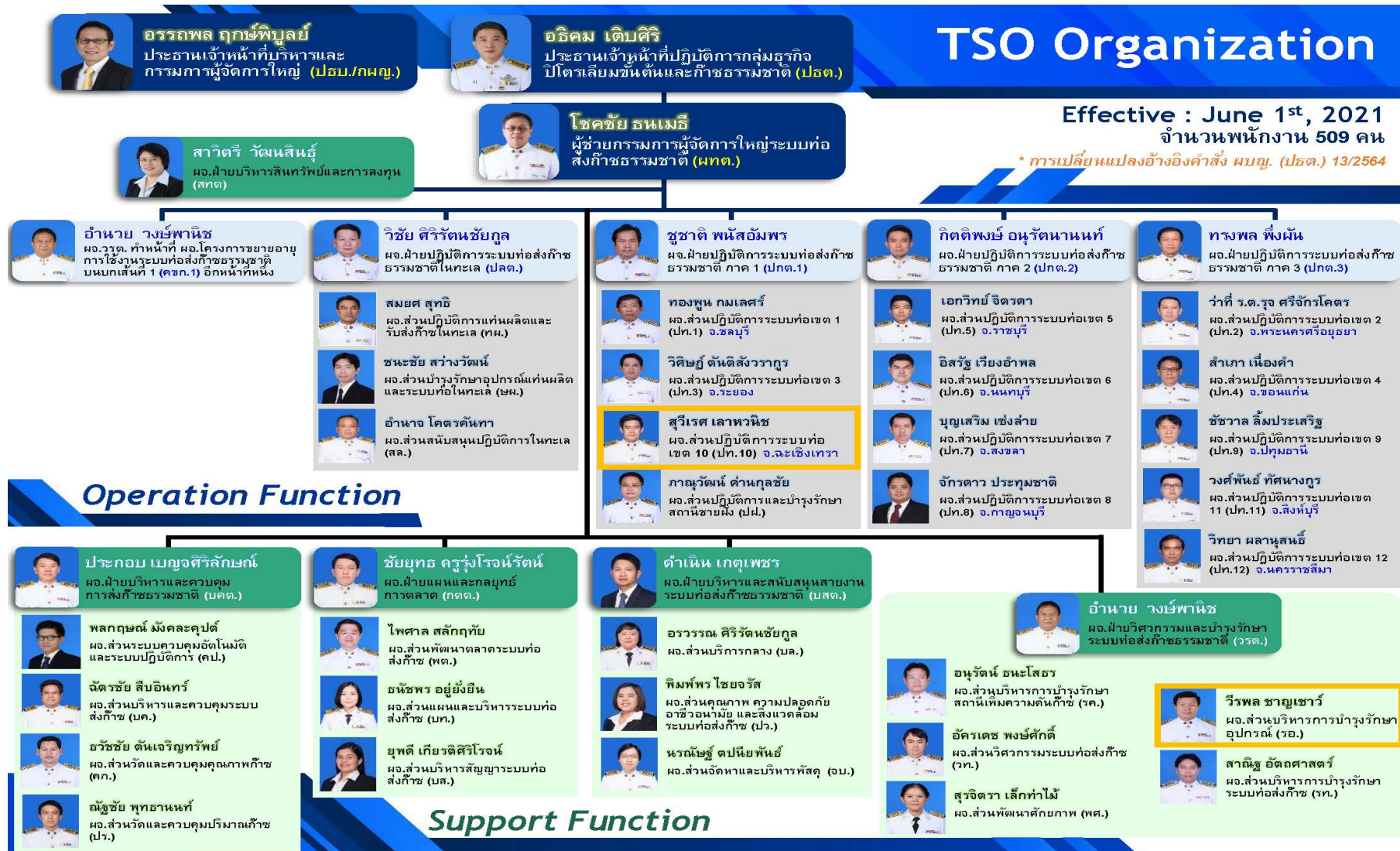
รูปที่ 2.2-1 แสดงโครงสร้างกลุ่มธุรกิจปิโตรเลียมขั้นต้นและก๊าซธรรมชาติ (สายงานระบบทอส่งก๊าซธรรมชาติ)