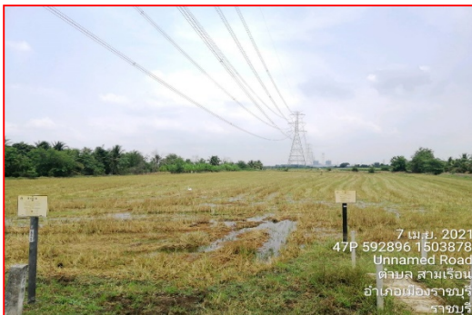
แนวท่อบริเวณใกล้แนวสายส่งไฟฟ้าแรงสูง กลางทุ่งนา