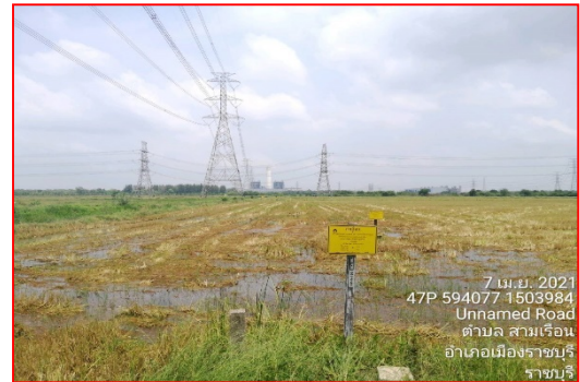
แนวท่อบริเวณใกล้แนวสายส่งไฟฟ้าแรงสูง ริมคลอง