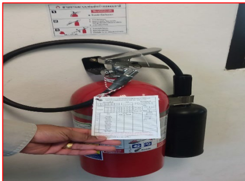
การติดตั้งถังดับเพลิงภายในสถานีควบคุม