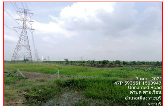
แนวท่อนก่อนเข้าสถานีรับก๊าซโรงไฟฟ้าราชบุรีเพาเวอร์

ภาพที่ 2.1-3 สภาพปัจจุบันตามแนวท่อส่งก๊าซฯ ของโครงการท่อส่งก๊าซธรรมชาติไปยัง บริษัท ราชบุรีเพาเวอร์ จำกัด