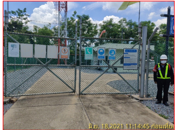
เจ้าหน้าที่รักษาความปลอดภัยตลอด 24 ชั่วโมง ประจำสถานีควบคุมก๊าซ