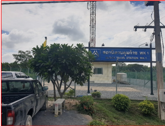
ภายในสถานีควบคุมความดันและวัดปริมาณก๊าซ