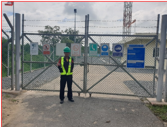
ป้ายเตือนต่างๆ ภายในสถานีควบคุมก๊าซ