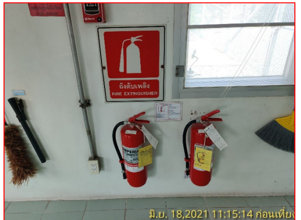
การติดตั้งถังดับเพลิงภายในสถานีควบคุมก๊าซ