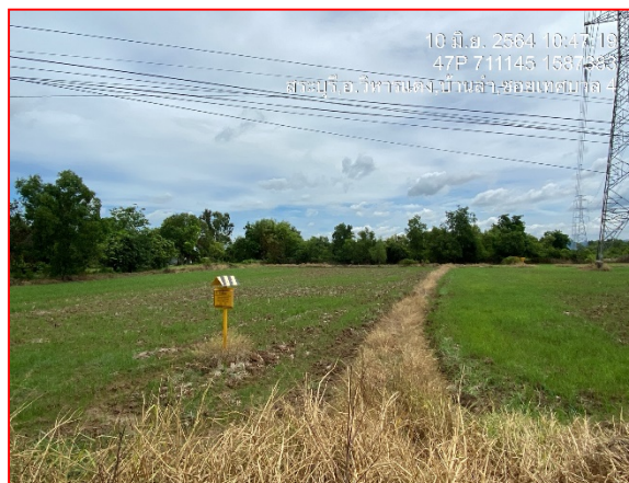
ป้ายเตือนแสดงแนวท่อ