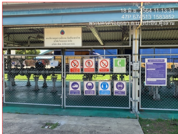
ภายในสถานีควบคุมความดันและวัดปริมาณก๊าซ