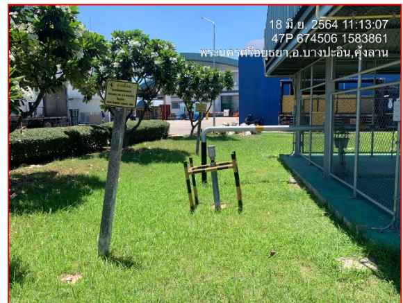
ป้ายเตือนแสดงแนวท่อก๊าซ