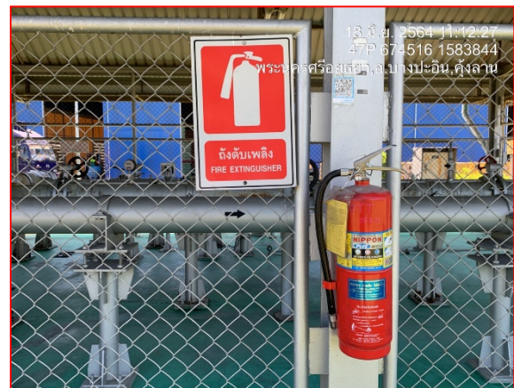
การติดตั้งถังดับเพลิงภายในสถานีควบคุมความดัน และวัดปริมาณก๊าซ

ภาพที่ 3.2-1 ภาพถ่ายระบบรักษาความปลอดภัยบริเวณสถานีก๊าซโครงการวางทอส่งก๊าซธรรมชาติ ไปยัง บริษัท ไอสอท จำกัด